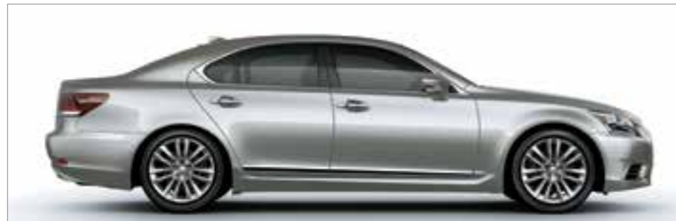
Sonic Titanium <1J7>