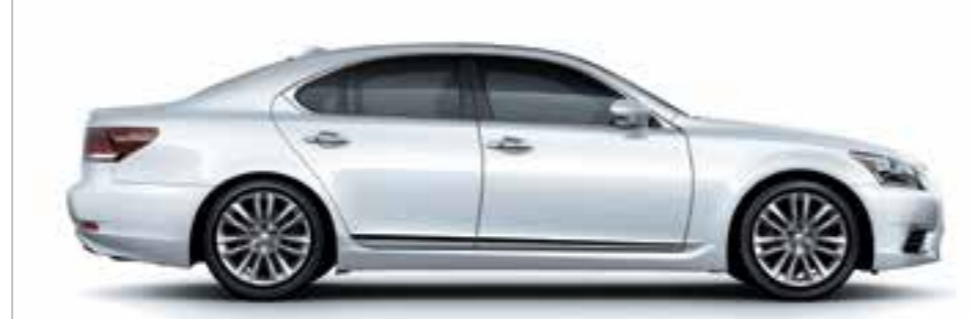
Sonic Quartz <085>*2