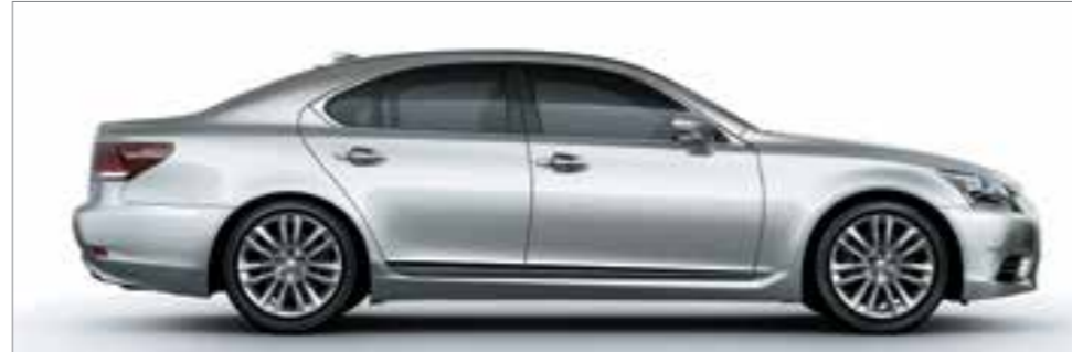
Sonic Silver <1J2>