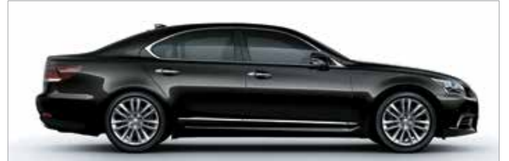
Starlight Black Glass Flake <217>