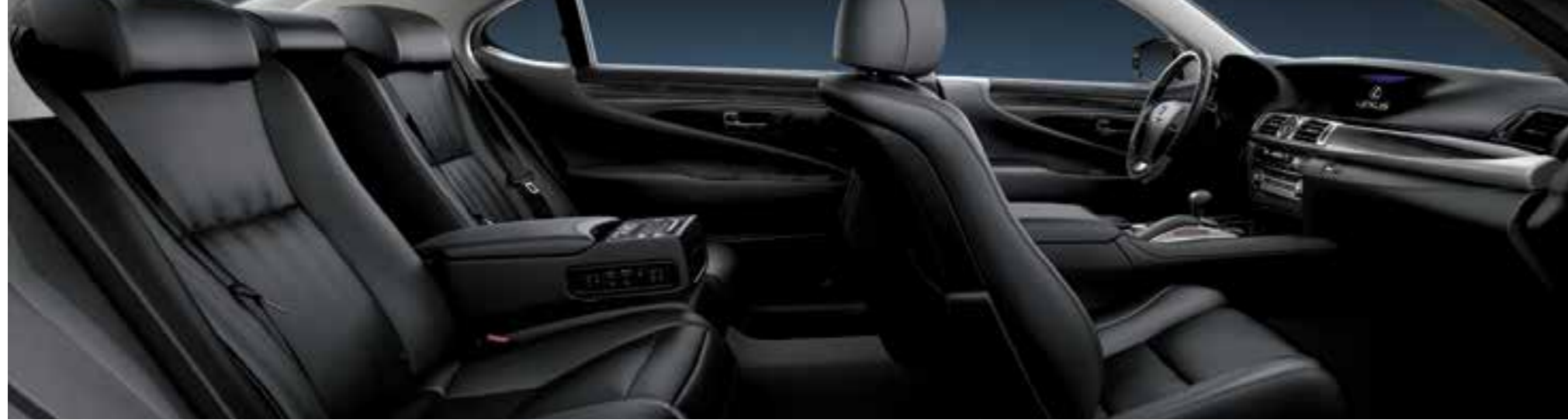
Black (Semi-aniline Leather)