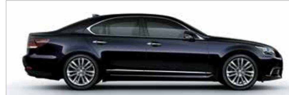
Black Opal Mica <214>*2