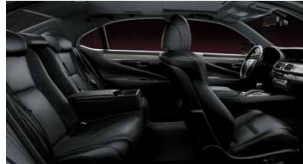
Black & White Gray (Smooth Leather)