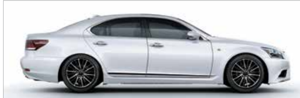
White Nova Glass Flake <083>*1