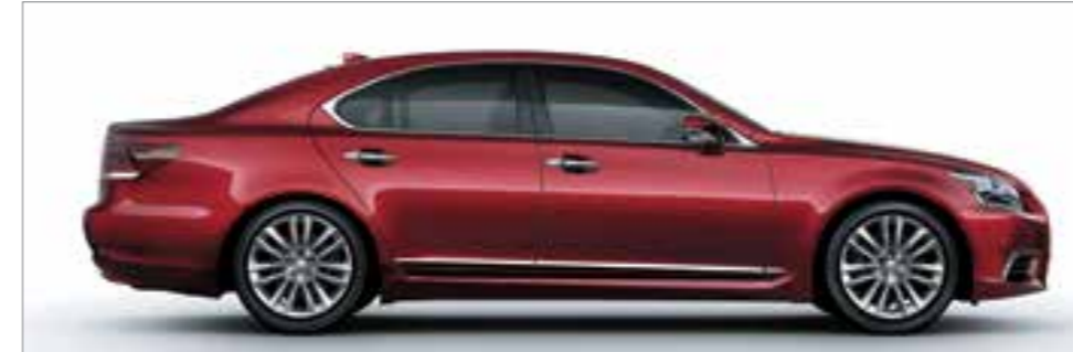
Red Mica Crystal Shine <3R1>