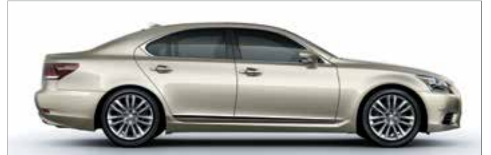
Sleek Ecru Metallic <4U7>*2