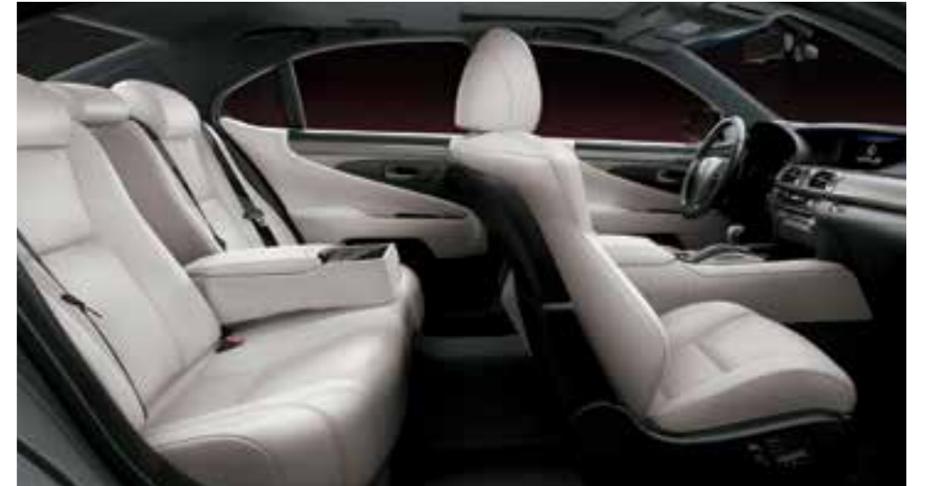
Black & Mellow White (Smooth Leather)