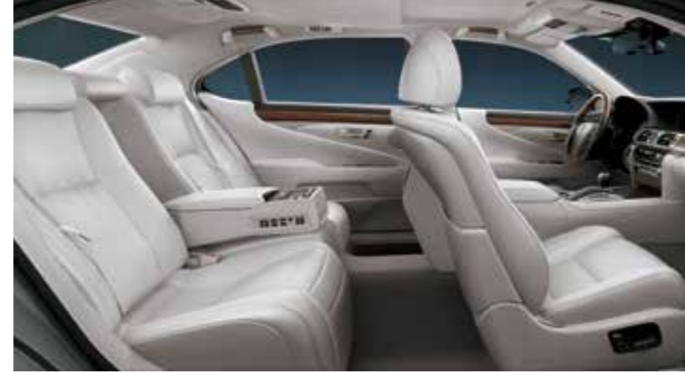
Mellow White (Semi-aniline Leather)