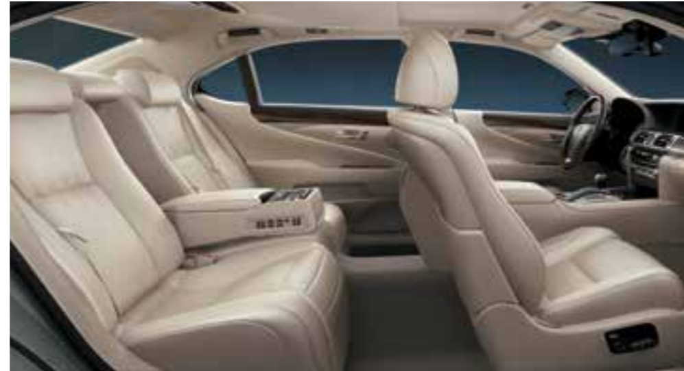
Ivory (Semi-aniline Leather)