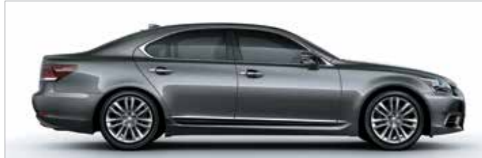
Mercury Gray Mica <1H9>