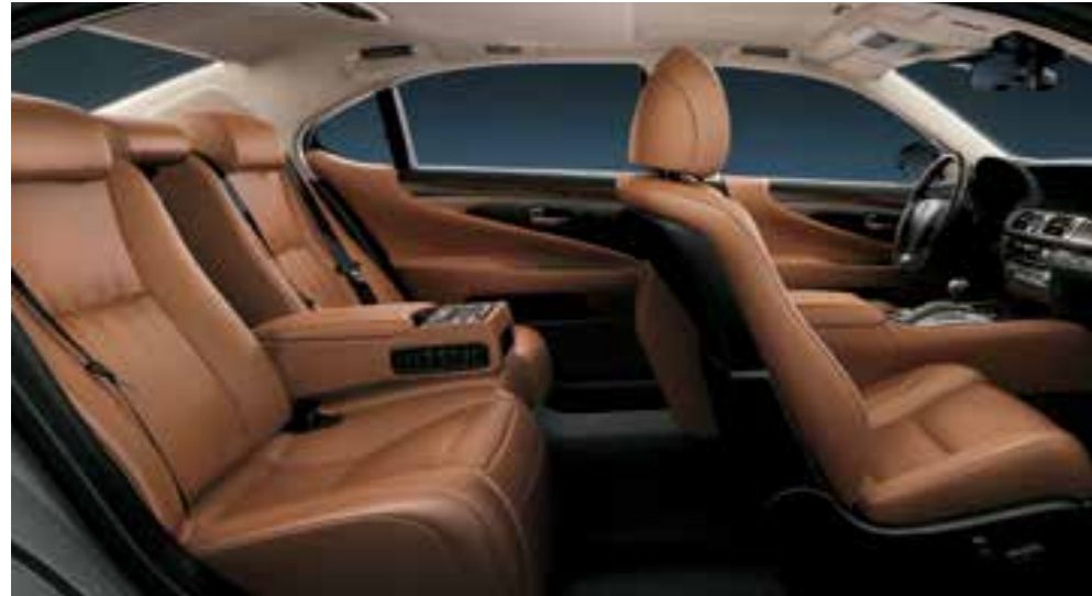
Topaz Brown (Semi-aniline Leather)