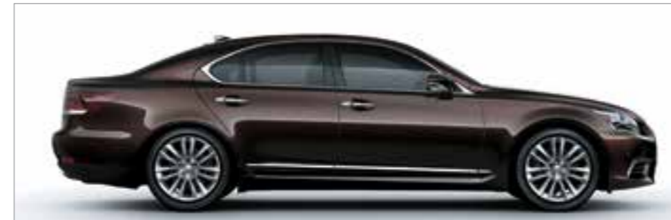
Fire Agate Mica Metallic <4V3>*2