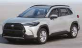
لمعان بلوري لؤلؤي أبيض (٠٧٠) White Pearl Crystal Shine (070)