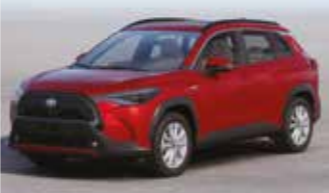
معدني مايكا أحمر (٣R٣) Red Mica Metallic (3R3)