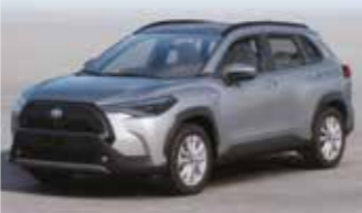
معدني فضي (١F٧) Silver Metallic (1F7)