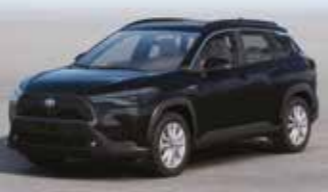
مايكا أسود (٢٠٩) Black Mica (209)