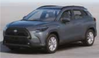
معدني رمادي سيليستل (١K٣) Celestite Gray Metallic (1K3)