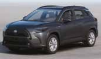
معدني رمادي (١G٣) Gray Metallic (1G3)