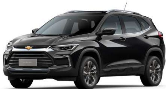
BLACK MEET KETTLE