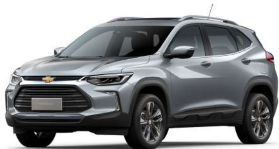
SATIN STEEL GREY