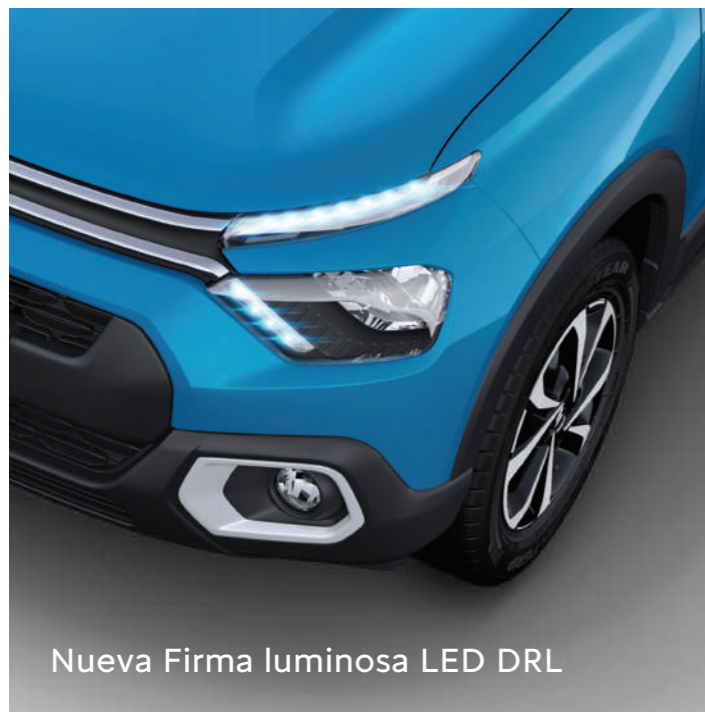
Nueva Firma luminosa LED DRL