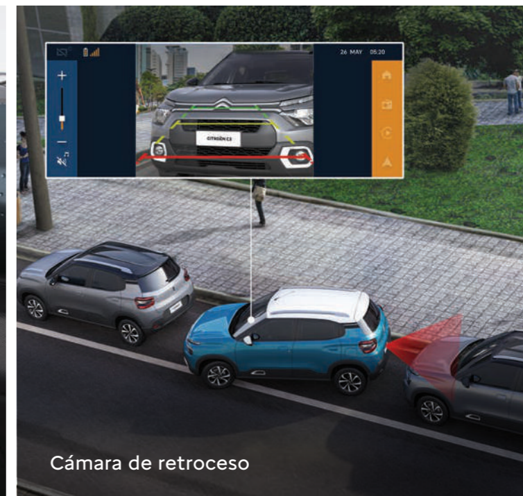
Cámara de retroceso