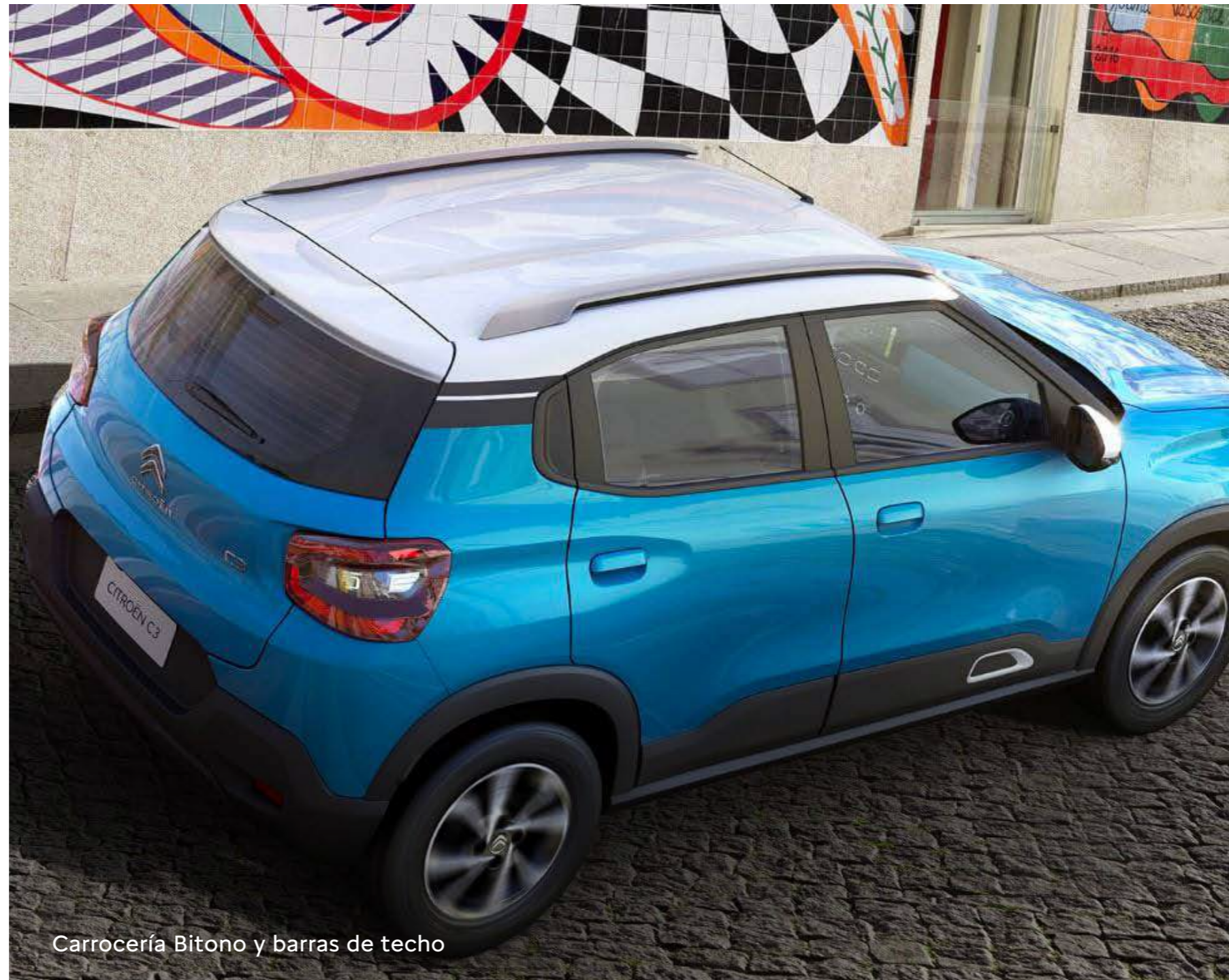
Carrocería Bitono y barras de techo