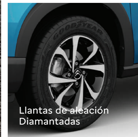
Llantas de aleación Diamantadas