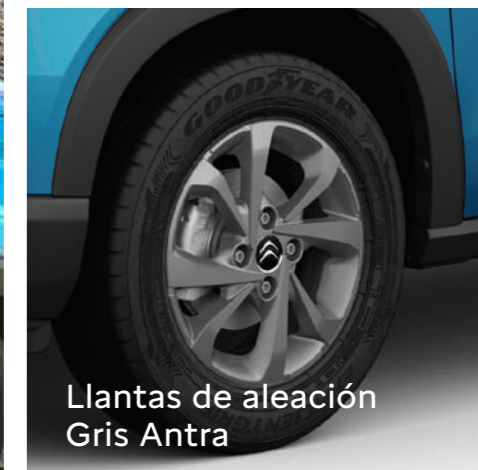
Llantas de aleación Gris Antra