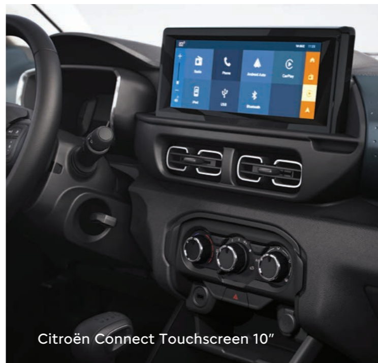
Citroën Connect Touchscreen 10"

Levantavidrios eléctricos One Touch Espejos retrovisores eléctricos 3 tomas de USB (1 delantera y 2 traseras) Toma 12V