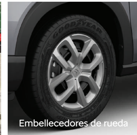
Embellecedores de rueda