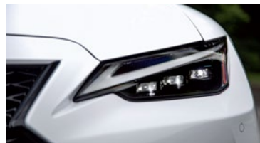
ÓPTICAS DELANTERAS MULTI-LED CON NIVELACIÓN AUTOMÁTICA Y LAVAFAROS