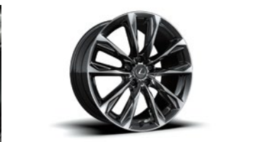
NEUMÁTICOS DELANTEROS 235/40 R19 Y TRASEROS 265/35 R19