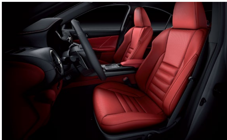
ASIENTOS DELANTEROS DISEÑO F-SPORT