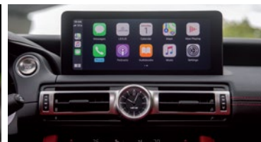
PANTALLA 10,3" CON CONECTIVIDAD APPLE CARPLAY™ Y ANDROID AUTO™