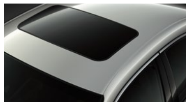
TECHO SOLAR ELÉCTRICO