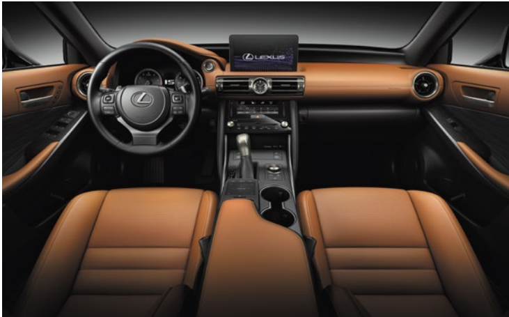
ASIENTOS DELANTEROS ELÉCTRICOS CALEFACCIONADOS Y VENTILADOS CON MEMORIA PARA EL CONDUCTOR