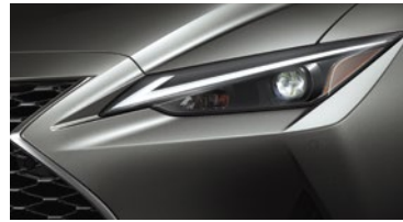
ÓPTICAS DELANTERAS LED