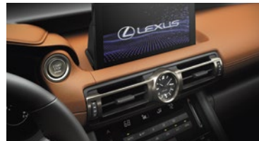
PANTALLA 10,3" CON CONECTIVIDAD APPLE CARPLAY™ Y ANDROID AUTO™