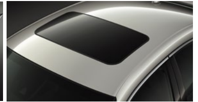
TECHO SOLAR ELÉCTRICO