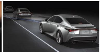
CONTROL DE VELOCIDAD CRUCERO ADAPTATIVO