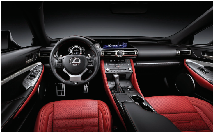
CONFORT DE CONDUCCIÓN