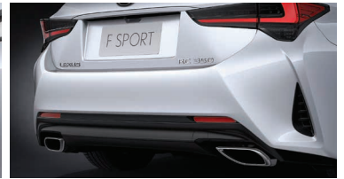
PARAGOLPES TRASERO DISEÑO F-SPORT