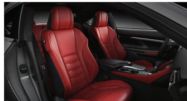
ASIENTOS DISEÑO F-SPORT