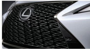
PARRILLA FRONTAL DISEÑO F-SPORT