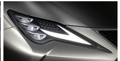
ÓPTICAS DELANTERAS MULTI-LED