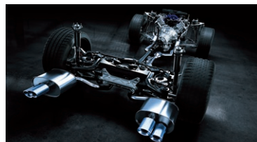
SISTEMA DE ESCAPE CONFECCIONADO EN TITANIO®