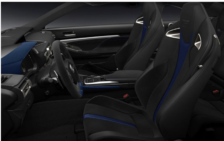
BUTACAS PERFORMANCE F TAPIZADAS EN ALCÁNTARA®