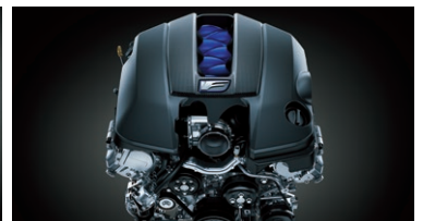
MOTOR 5.0L V8