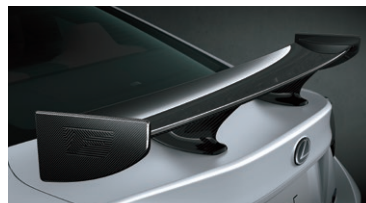
ALERÓN FIJO DE FIBRA DE CARBONO (CFRP)