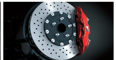
SISTEMA DE FRENOS BREMBO® CON CÁLIPER ROJO DISEÑO F