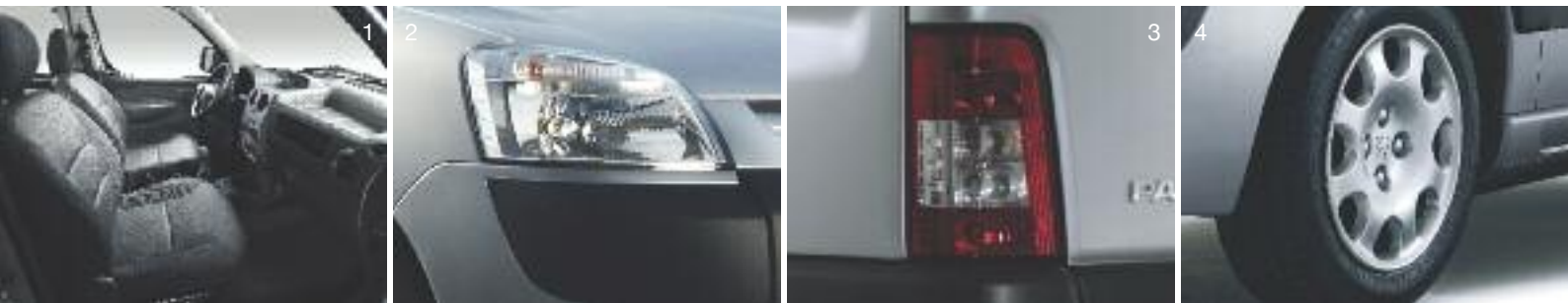
1. Interiores. 2. Faros delanteros de vidrio liso. 3. Faros traseros. 4. Ruedas de 14" con embellecedor.

El embellecedor de ruedas cierra armónicamente su imagen de resultado polivalente.