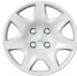
Embellecedor Pacaya 15''