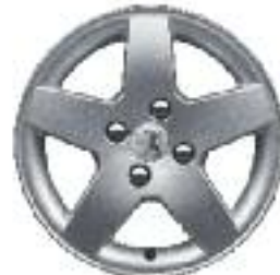
Llantas de aluminio Mónaco 15''

La información y las ilustraciones que figuran en este folleto se basan en las características técnicas vigentes en el momento de la impresión del presente documento (Mayo 2012). El equipamiento presentado en los vehículos fotografiados es de serie u opcional según las versiones. En el marco de una política de mejora constante del producto, Peugeot puede modificar sin preaviso las características técnicas, el equipamiento, las opciones y los tonos. De esta manera, este folleto constituye una información de carácter general y no un documento contractual. Para toda información complementaria, te rogamos dirigirte a tu concesionario. Fotos y equipamientos no contractuales.