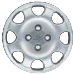
Embellecedor Cuba 14''