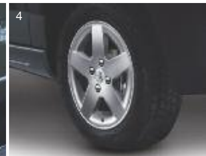
1. Interior. 2. Grillas de protección faros delanteros. 3. Grillas de protección de faros traseros. 4. Llantas de aluminio Mónaco 15".