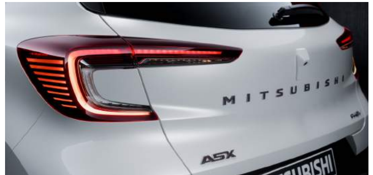
Voll-LED Scheinwerfer vorne und hinten