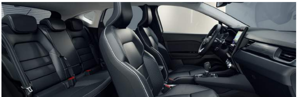
DIAMOND Ledersitze schwarz