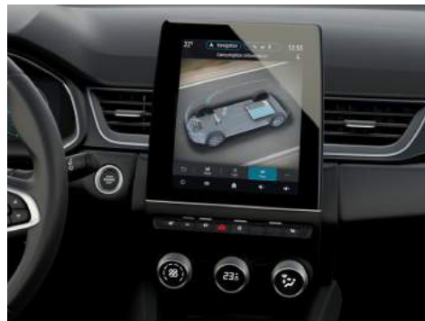
9,3" Smartphone-Link Display Audio inkl. Navigation Intense, Diamond