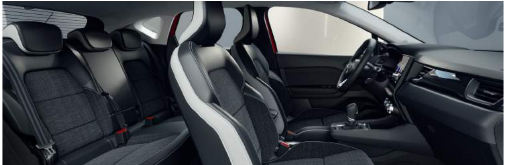
INTENSE Stoffsitze dunkelgrau mit Ledernachbildung hellgrau/schwarz