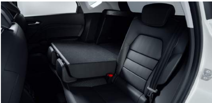
Rücksitzlehne geteilt umklappbar