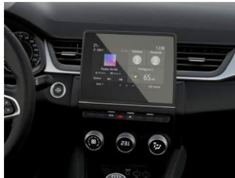
7" Smartphone-Link Display Audio inkl. Smartphone-Integration und DAB+ Radio Inform, Invite