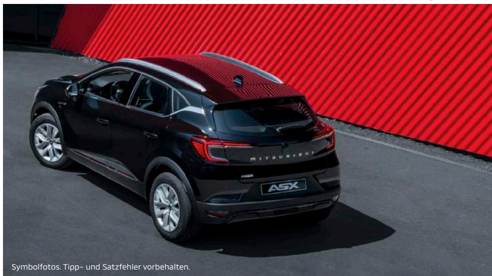
Symbolfotos. Tipp- und Satzfehler vorbehalten.