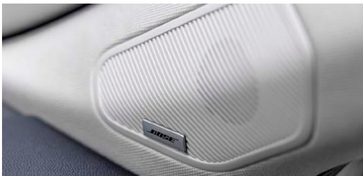
Bose® Sound System