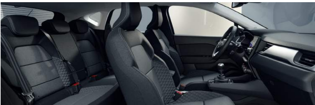
INFORM & INVITE Stoffsitze grau/schwarz