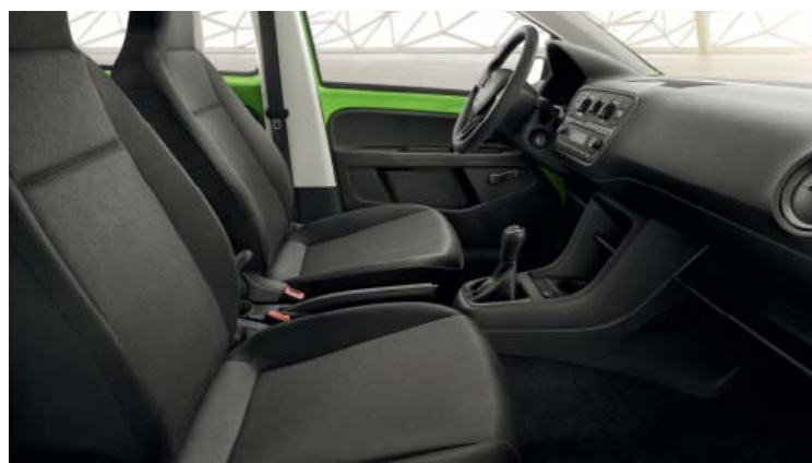
INTERIEUR ACTIVE Armaturenbrett in Schwarz