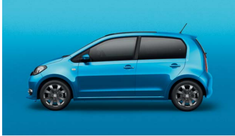
KRISTALL-BLAU METALLIC (3K3K)