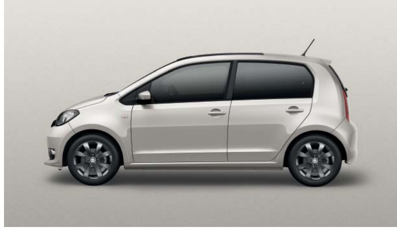
TUNGSTEN-SILBER METALLIC (K5K5)