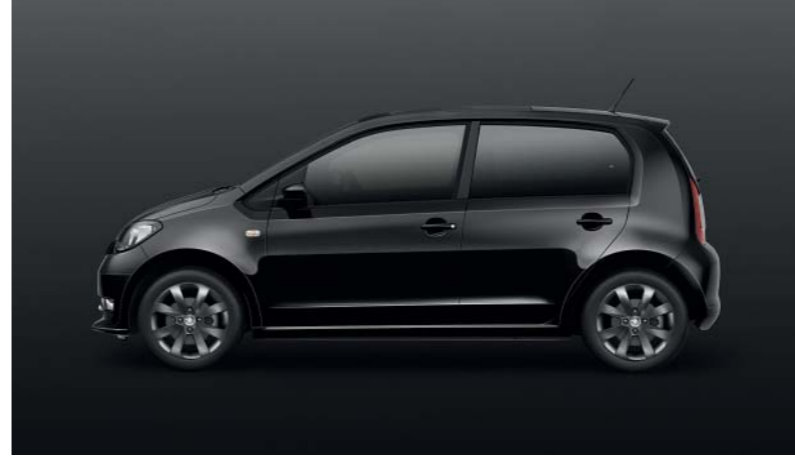
DEEP-SCHWARZ PERLEFFEKT (2T2T)