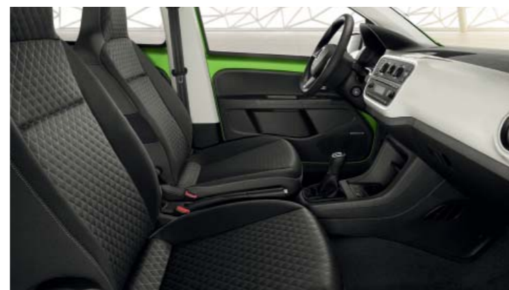
INTERIEUR DYNAMIC Dekoreinlagen „Piano-Schwarz“ am Armaturenbrett und Lenkrad.