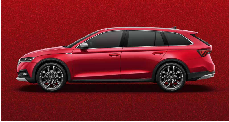
VELVET-ROT METALLIC (K1K1)