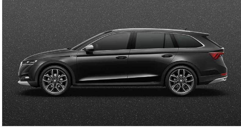
BLACK-MAGIC PERLEFFEKT (1Z1Z)