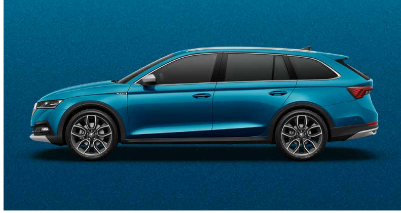
LAVA-BLAU METALLIC (0F0F)