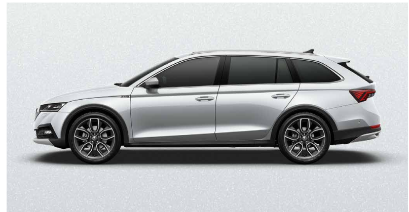
MOON-WEISS METALLIC (2Y2Y)