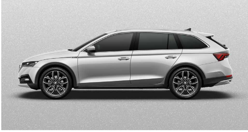
BRILLANT-SILBER METALLIC (8E8E)