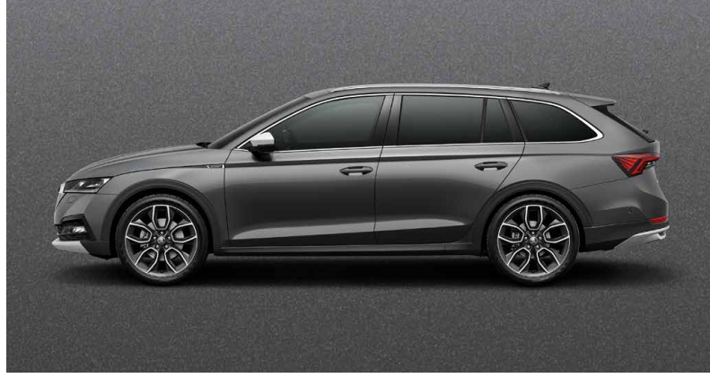
GRAPHIT-GRAU METALLIC (5X5X)