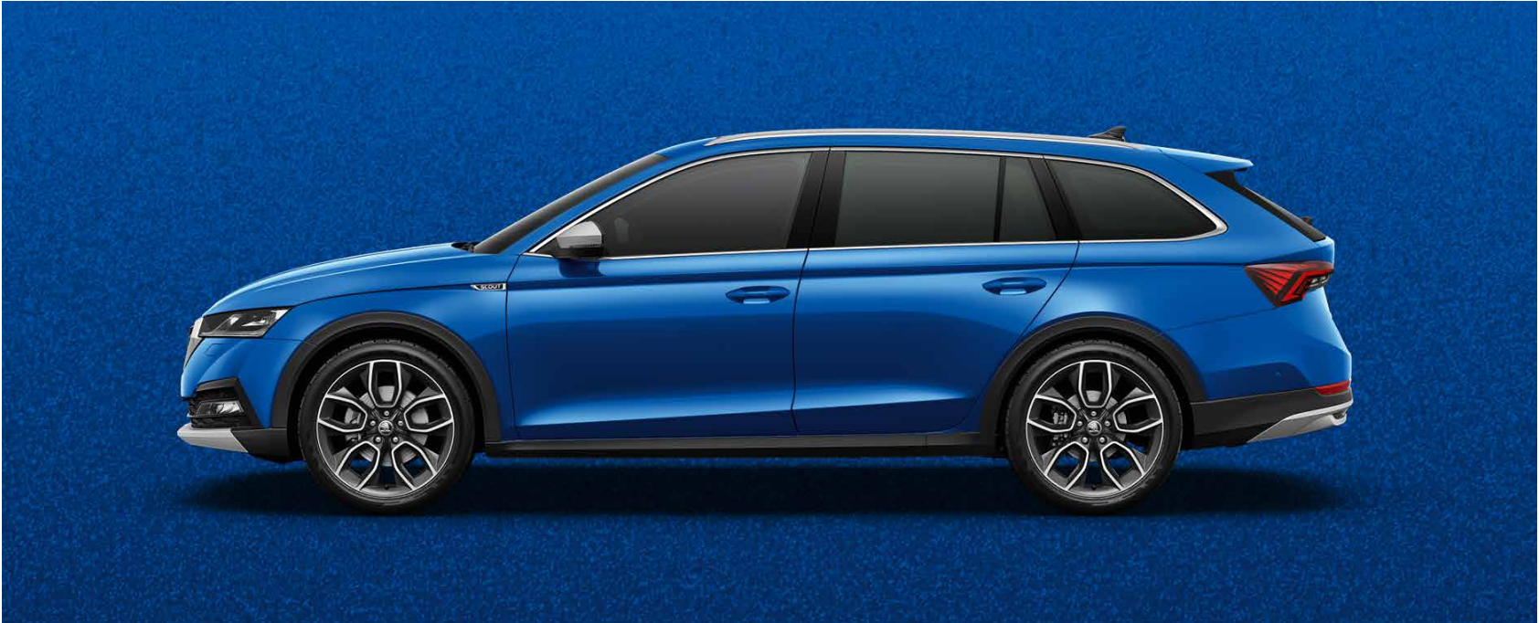
RACE-BLAU METALLIC (8X8X)

Die Abbildungen auf diesen Seiten sind nur Anhaltspunkte. Die Druckfarben können die Lackierungen nicht so darstellen, wie sie in Wirklichkeit sind.