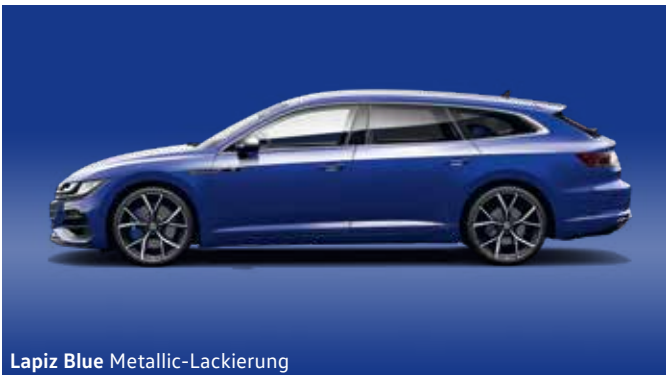
Lapiz Blue Metallic-Lackierung