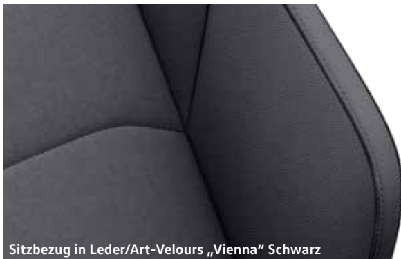
Sitzbezug in Leder/Art-Velours „Vienna“ Schwarz