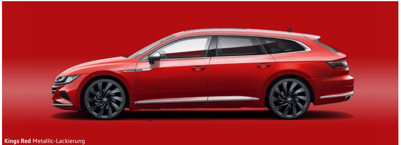
Kings Red Metallic-Lackierung