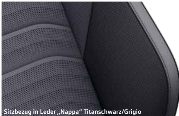
Sitzbezug in Leder „Nappa“ Titanschwarz/Grigio