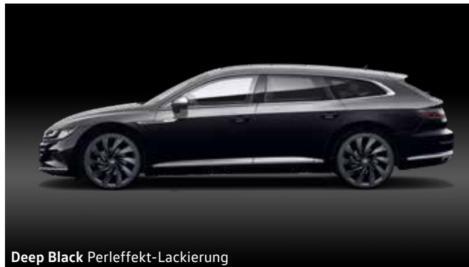
Deep Black Perleffekt-Lackierung