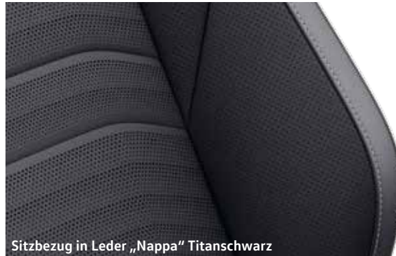
Sitzbezug in Leder „Nappa“ Titanschwarz