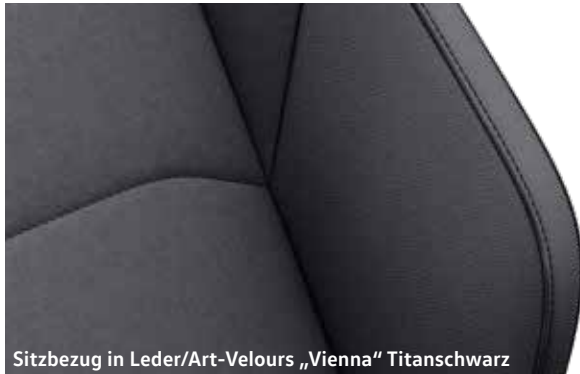
Sitzbezug in Leder/Art-Velours „Vienna“ Titanschwarz