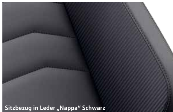
Sitzbezug in Leder „Nappa“ Schwarz