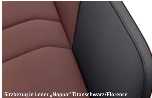
Sitzbezug in Leder „Nappa“ Titanschwarz/Florence