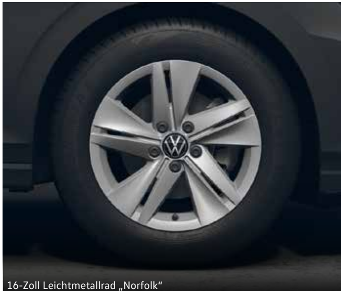
16-Zoll Leichtmetallrad „Norfolk“