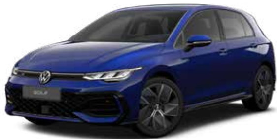
Lapiz Blue Metallic-Lackierung