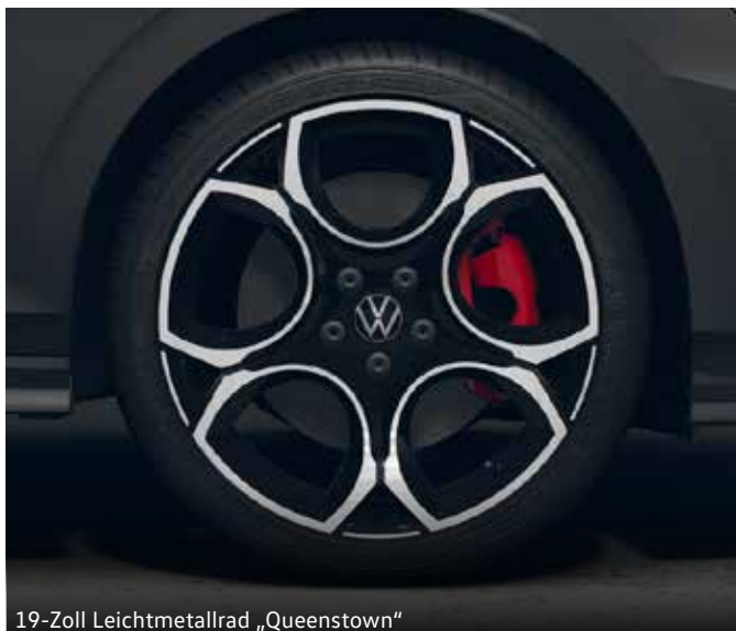
19-Zoll Leichtmetallrad „Queenstown“