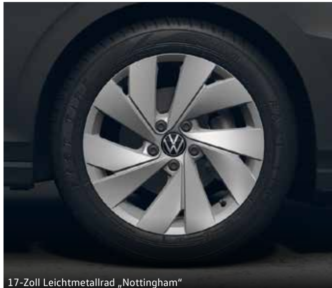
17-Zoll Leichtmetallrad „Nottingham“