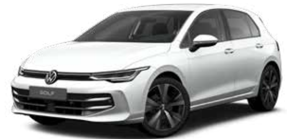
Pure White Uni-Lackierung