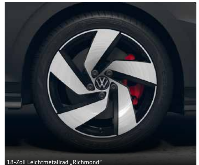
18-Zoll Leichtmetallrad „Richmond“