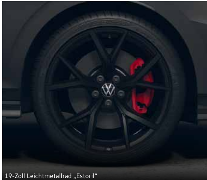
19-Zoll Leichtmetallrad „Estoril“