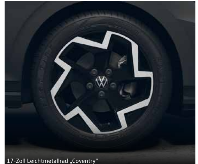
17-Zoll Leichtmetallrad „Coventry“