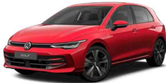
Kings Red Metallic-Lackierung