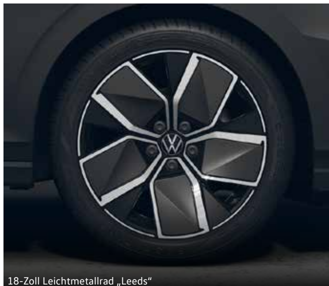
18-Zoll Leichtmetallrad „Leeds“