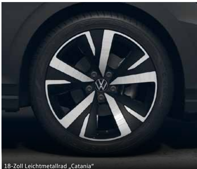
18-Zoll Leichtmetallrad „Catania“