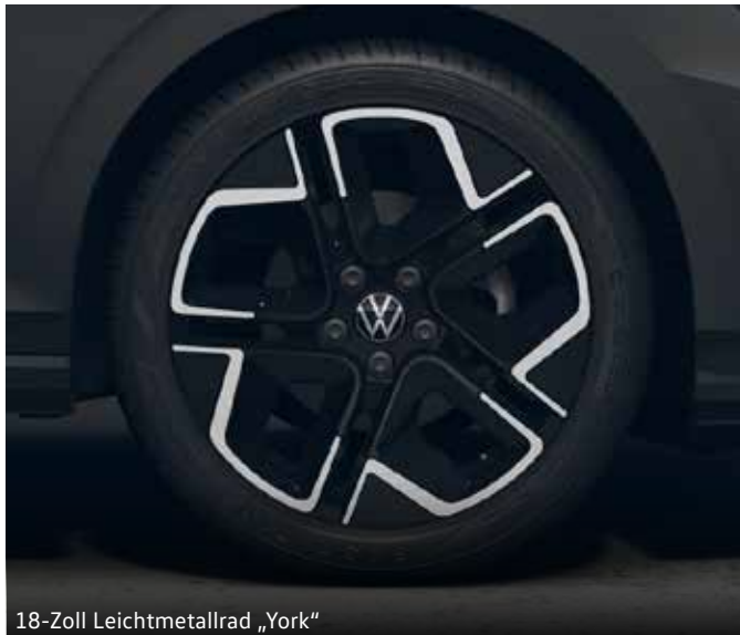
18-Zoll Leichtmetallrad „York“