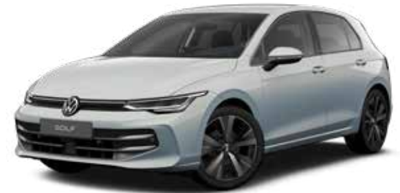
Crystal Ice Blue Metallic-Lackierung