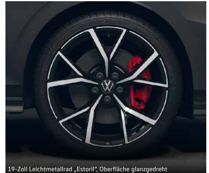
19-Zoll Leichtmetallrad „Estoril“, Oberfläche glanzgedreht