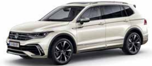
Ivory Silver Metallic-Lackierung 6N