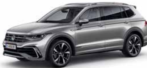
Pyrit Silber Metallic-Lackierung K2