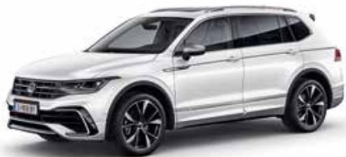
Oryxweiß Perlmuttereffekt-Lackierung OR