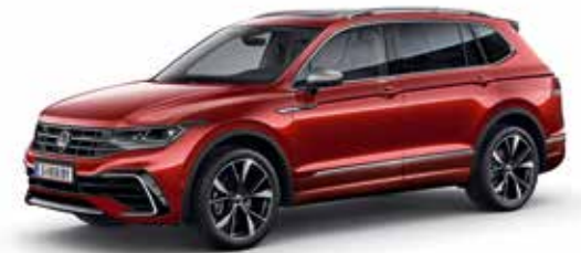
Kings Red Metallic-Lackierung P8