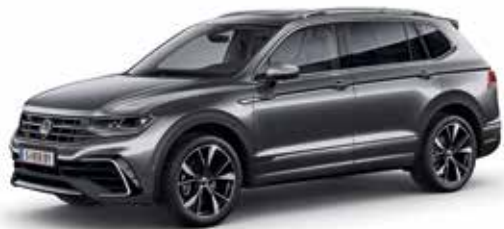
Platinum Grey Metallic-Lackierung 2R