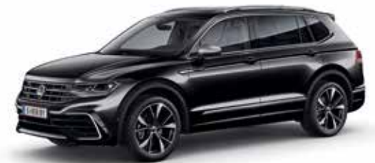
Deep Black Perleffekt-Lackierung 2T