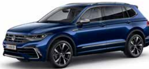
Atlantik Blue Metallic-Lackierung H7