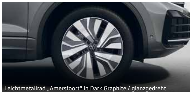
Leichtmetallrad „Amersfoort“ in Dark Graphite / glanzgedreht