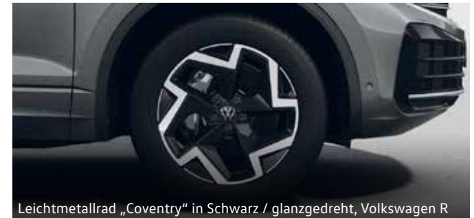
Leichtmetallrad „Coventry“ in Schwarz / glanzgedreht, Volkswagen R