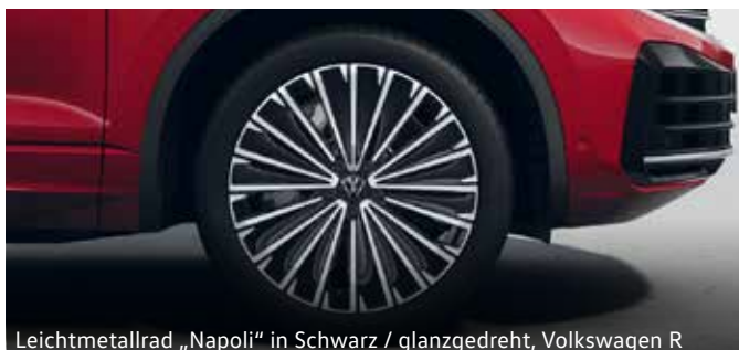
Leichtmetallrad „Napoli“ in Schwarz / glanzgedreht, Volkswagen R