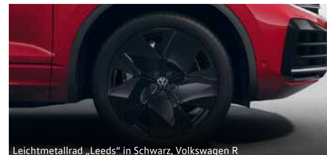
Leichtmetallrad „Leeds“ in Schwarz, Volkswagen R