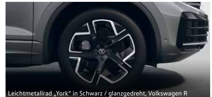
Leichtmetallrad „York“ in Schwarz / glanzgedreht, Volkswagen R

Bitte beachten Sie, dass manche Räder/Reifen limitiert sind oder zum Zeitpunkt der Bestellung bzw. der Fahrzeuglieferung nicht mehr verfügbar sind. Fragen Sie Ihren Händler nach der Verfügbarkeit der Räder/Reifen und prüfen Sie, dass Ihr konfiguriertes Fahrzeug auch die gewünschten Sonderausstattungen enthält. Die gezielte Bestellung eines bestimmten Reifenfabrikats ist aus logistischen und produktionstechnischen Gründen nicht möglich. Informationen zum EU-Reifenlabel erhalten Sie online im Konfigurator unter https://konfigurator.volkswagen.at oder direkt bei Ihrem Volkswagen Partner. Unsere Fahrzeuge sind serienmäßig mit Sommerreifen ausgestattet. In Österreich besteht im Zeitraum von 1.11. bis 15.4. Winterreifenpflicht bei winterlichen Straßenverhältnissen. Ihr Volkswagen Partner berät Sie gern.