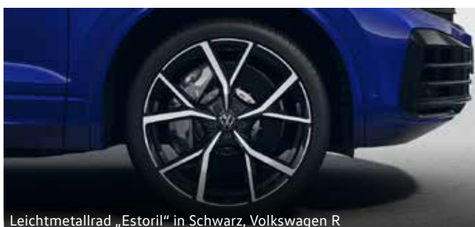
Leichtmetallrad „Estoril“ in Schwarz, Volkswagen R