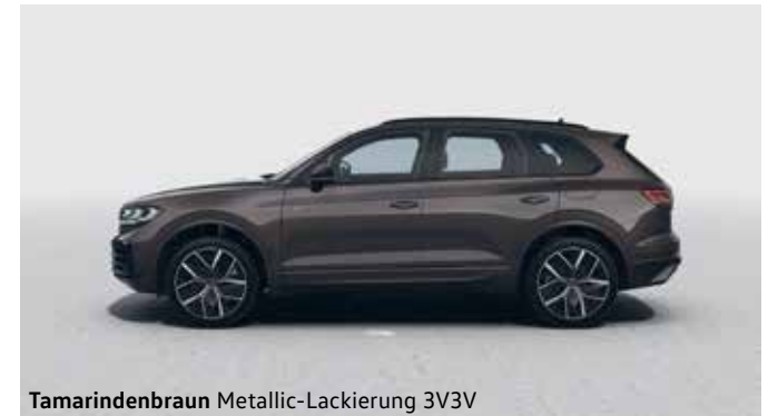
Tamarindenbraun Metallic-Lackierung 3V3V