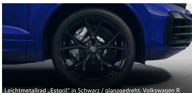
Leichtmetallrad „Estoril“ in Schwarz / glanzgedreht, Volkswagen R

Bitte beachten Sie, dass manche Räder/Reifen limitiert sind oder zum Zeitpunkt der Bestellung bzw. der Fahrzeuglieferung nicht mehr verfügbar sind. Fragen Sie Ihren Händler nach der Verfügbarkeit der Räder/Reifen und prüfen Sie, dass Ihr konfiguriertes Fahrzeug auch die gewünschten Sonderausstattungen enthält. Die gezielte Bestellung eines bestimmten Reifenfabrikats ist aus logistischen und produktionstechnischen Gründen nicht möglich. Informationen zum EU-Reifenlabel erhalten Sie online im Konfigurator unter https://konfigurator.volkswagen.at oder direkt bei Ihrem Volkswagen Partner. Unsere Fahrzeuge sind serienmäßig mit Sommerreifen ausgestattet. In Österreich besteht im Zeitraum von 1.11. bis 15.4. Winterreifenpflicht bei winterlichen Straßenverhältnissen. Ihr Volkswagen Partner berät Sie gern.