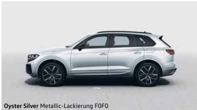
Oyster Silver Metallic-Lackierung F0F0