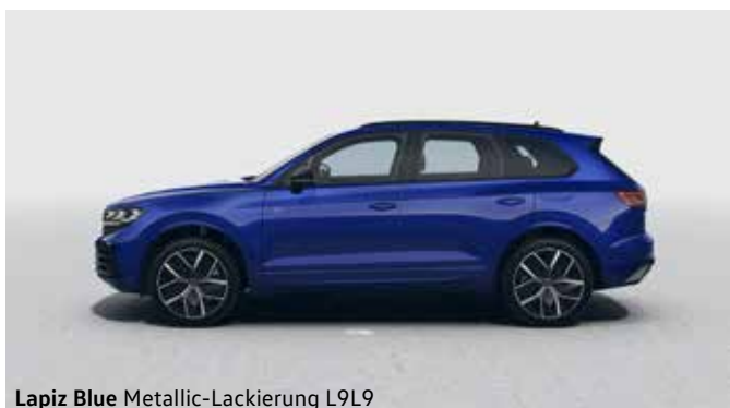
Lapiz Blue Metallic-Lackierung L9L9