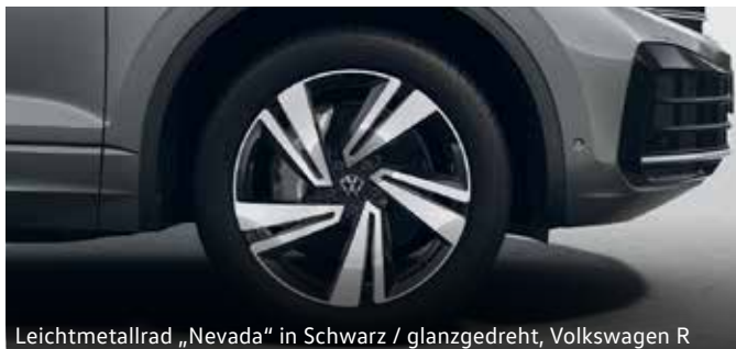
Leichtmetallrad „Nevada“ in Schwarz / glanzgedreht, Volkswagen R