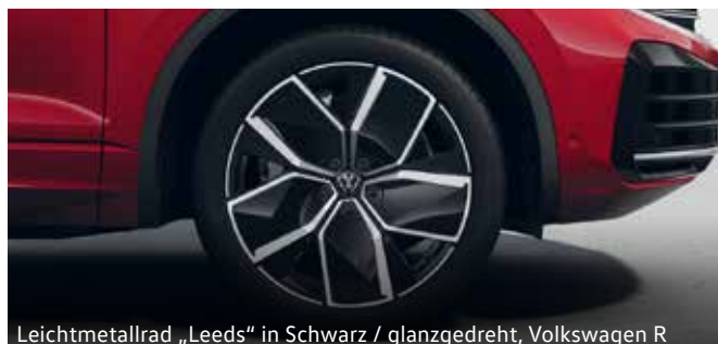
Leichtmetallrad „Leeds“ in Schwarz / glanzgedreht, Volkswagen R