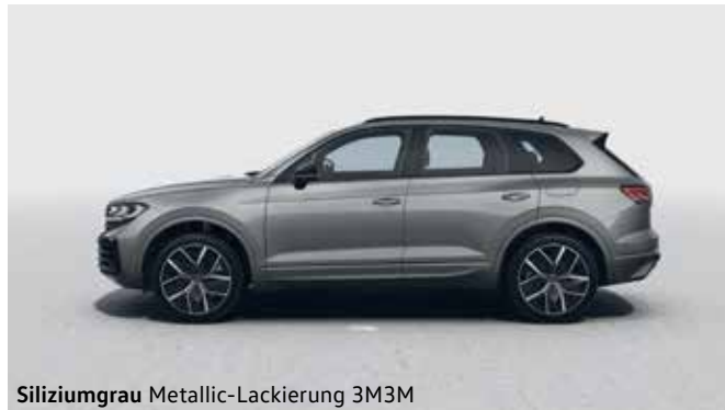
Siliziumgrau Metallic-Lackierung 3M3M