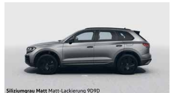
Siliziumgrau Matt Matt-Lackierung 9D9D