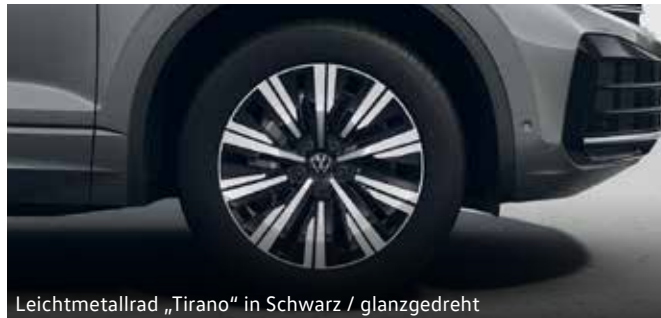
Leichtmetallrad „Tirano“ in Schwarz / glanzgedreht