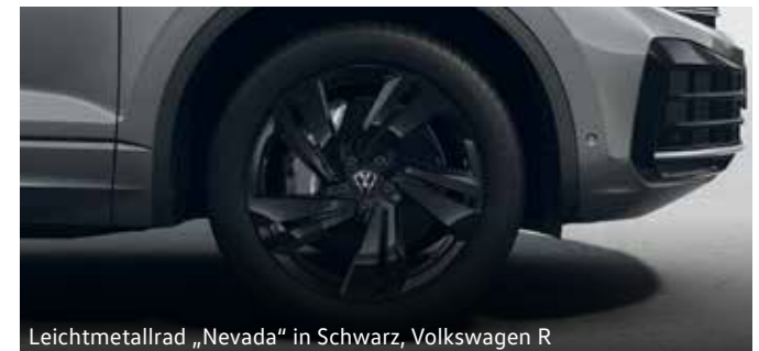
Leichtmetallrad „Nevada“ in Schwarz, Volkswagen R