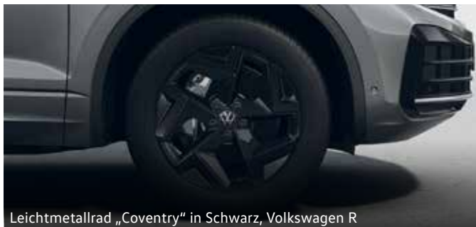
Leichtmetallrad „Coventry“ in Schwarz, Volkswagen R