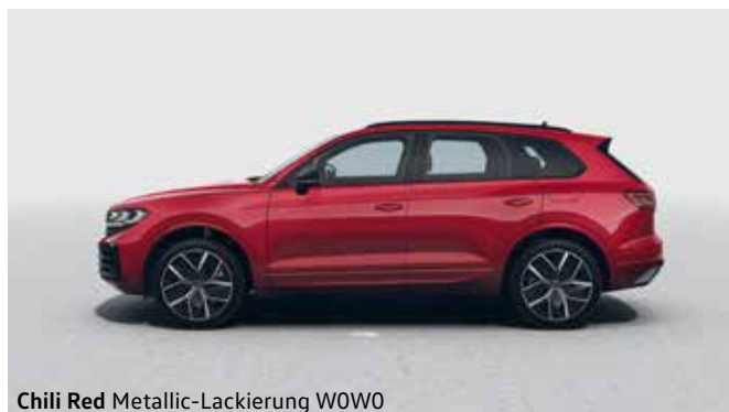
Chili Red Metallic-Lackierung W0W0