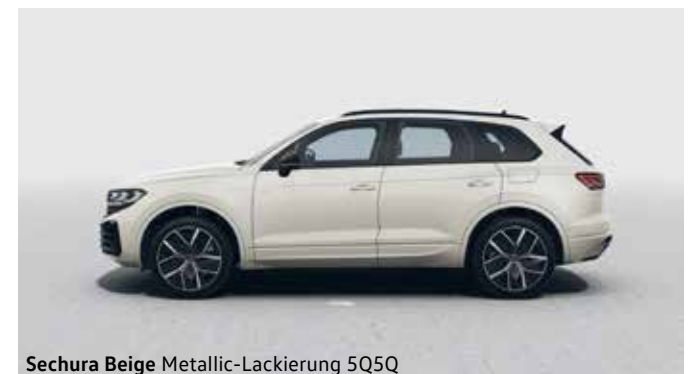
Sechura Beige Metallic-Lackierung 5Q5Q