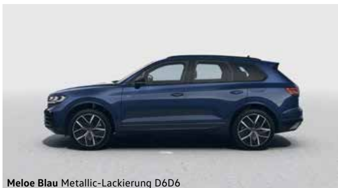
Meloe Blau Metallic-Lackierung D6D6