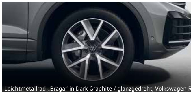
Leichtmetallrad „Braga“ in Dark Graphite / glanzgedreht, Volkswagen R