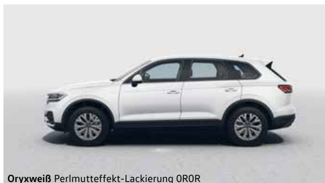
Oryxweiß Perlmutteffekt-Lackierung 0R0R