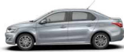
BLEU TELES (M)