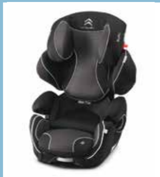
Gamme de sièges enfant