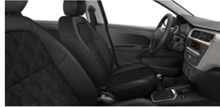
TISSU BIRDY MISTRAL