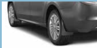
Bavettes de style