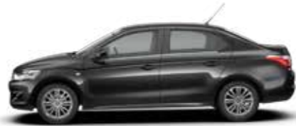
NOIR ONYX (O)