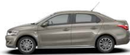
BRUN NOCCIOLA (M)