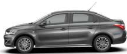
GRIS SHARK (M)