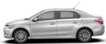
GRIS ALUMINIUM (M)