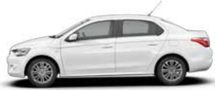
BLANC BANQUISE (O)