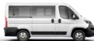
CITROËN JUMPER COMBI

CITROËN C-ELYSÉE UNE BERLINE À LA PERSONNALITÉ AFFIRMÉE