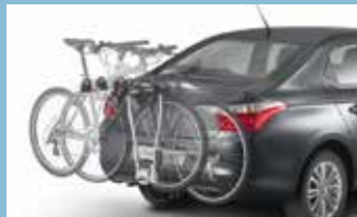
Porte-vélos sur attelage

Facile à personnaliser, la CITROËN C-ELYSÉE propose de nombreux accessoires pratiques.