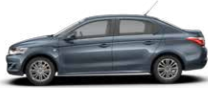
BLEU KYANOS (M)