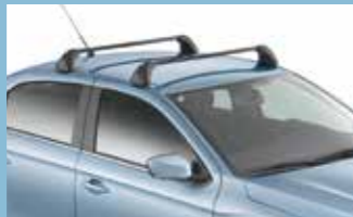
Barres de toit