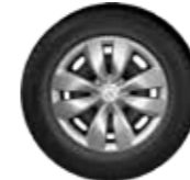
ENJOLIVEUR ASTERODEA 15"