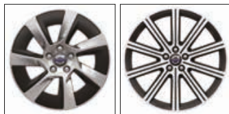
Titania Dark Chrome 18"

● Standard ○ Option contre supplément OSS Option sans supplément - Non disponible