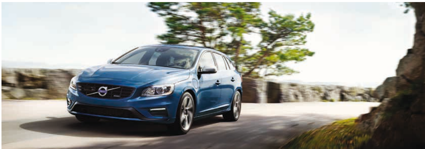
V60 Plug-In Hybrid Summum R-Design