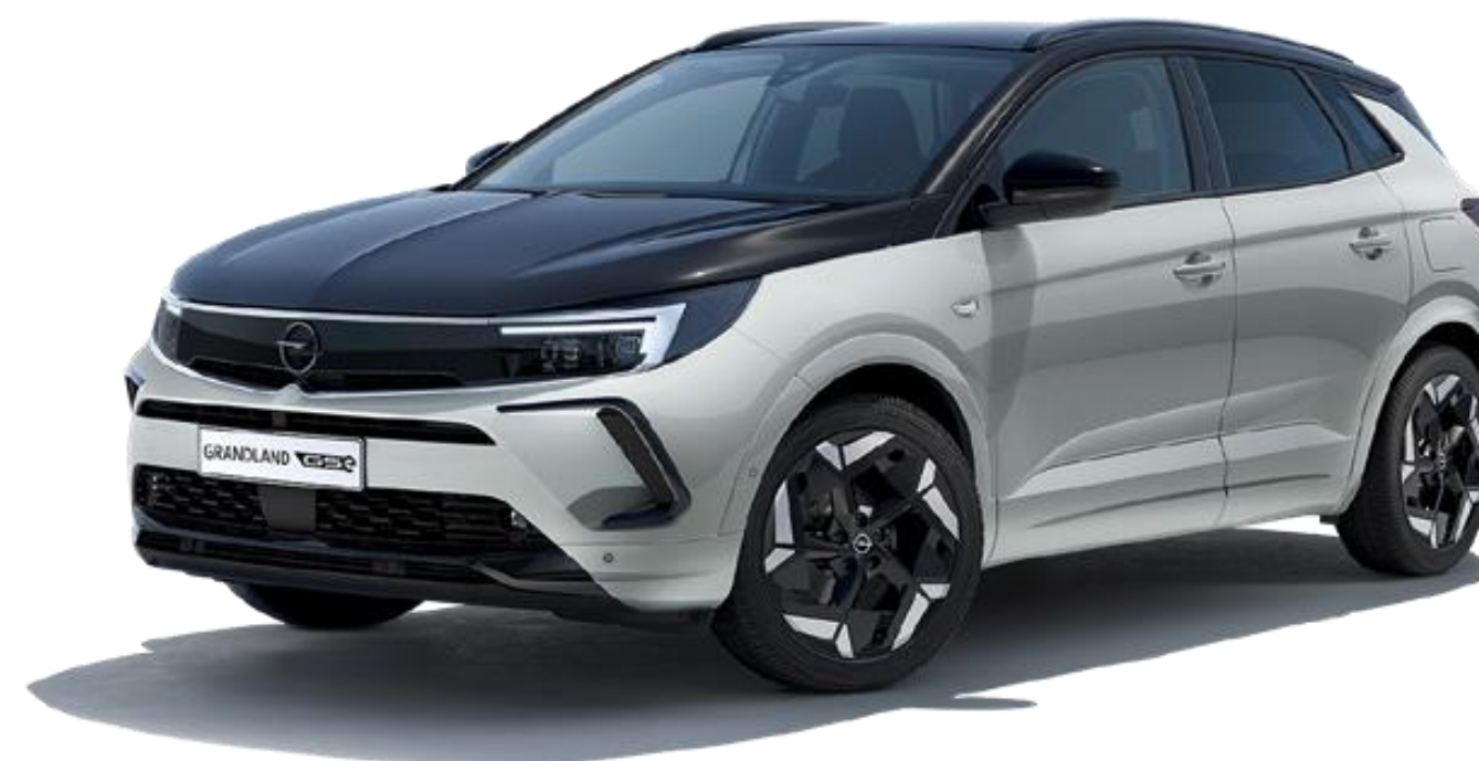
Grandland GSe, цвят на екстериора Kompass Grey с черен покрив Karbon

Чрез използването на последно поколение на технологията Frequency Selective Damping (FSD) на KONI, движенията на автомобила се абсорбират по-добре, а незначителните вибрации причинени от неравни пътища, се „изглаждат“, създавайки значително повече комфорт при возене.