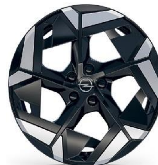
19-инчова алуминиева джантата Monza, 7 J x 19