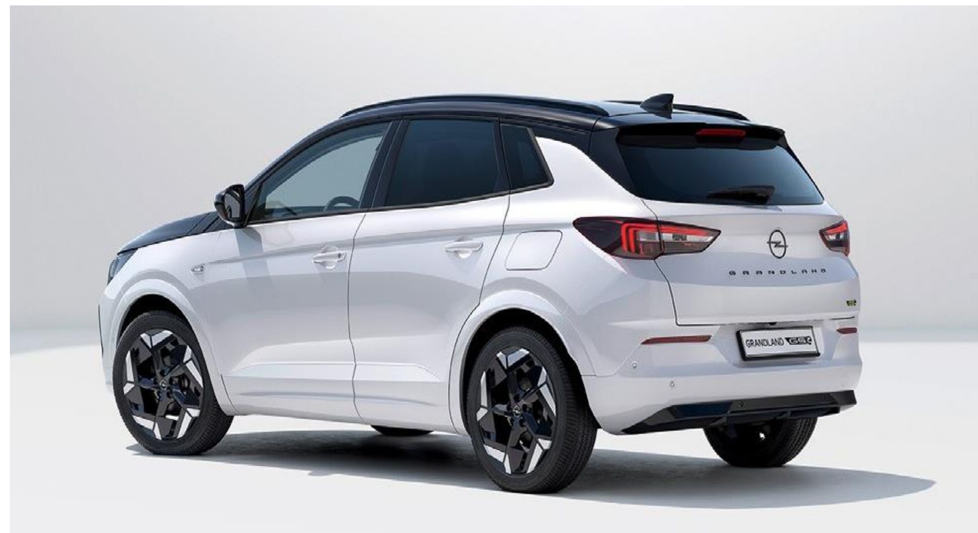
Grandland GSe, цвят на екстериора Arktis White с карбоново черен покрив

Кампанията за здрави гърбове (AGR) потвърждава, че ергономично сертифицираните седалки на новия Grandland GSe отговарят дори на най-високите немски стандарти и гарантират, че гърбовете на клиентите са в сигурни ръце. Специална GSe емблема индикира за духа на автомобила.