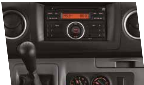
Sistema de audio AM/FM/CD/MP3