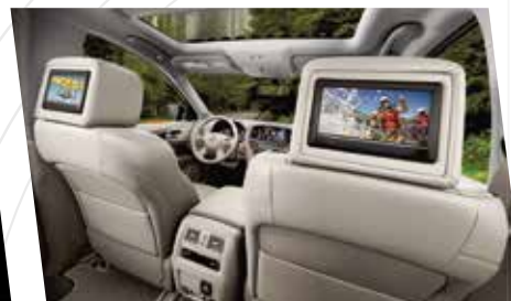
SISTEMA DE ENTRETENIMIENTO CON 2 PANTALLAS DE 8", REPRODUCTOR DE DVD Y SISTEMA DE SONIDO BOSE®