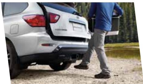
PORTÓN TRASERO CON FUNCIÓN DE APERTURA AUTOMÁTICA CON SENSOR DE MOVIMIENTO