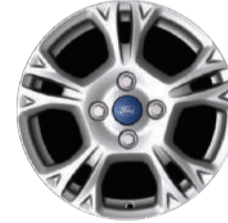
SEL Roda de liga leve, aro 15