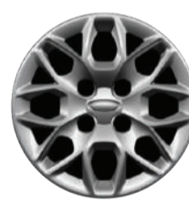
SE Roda de aço, aro 14, com calota integral