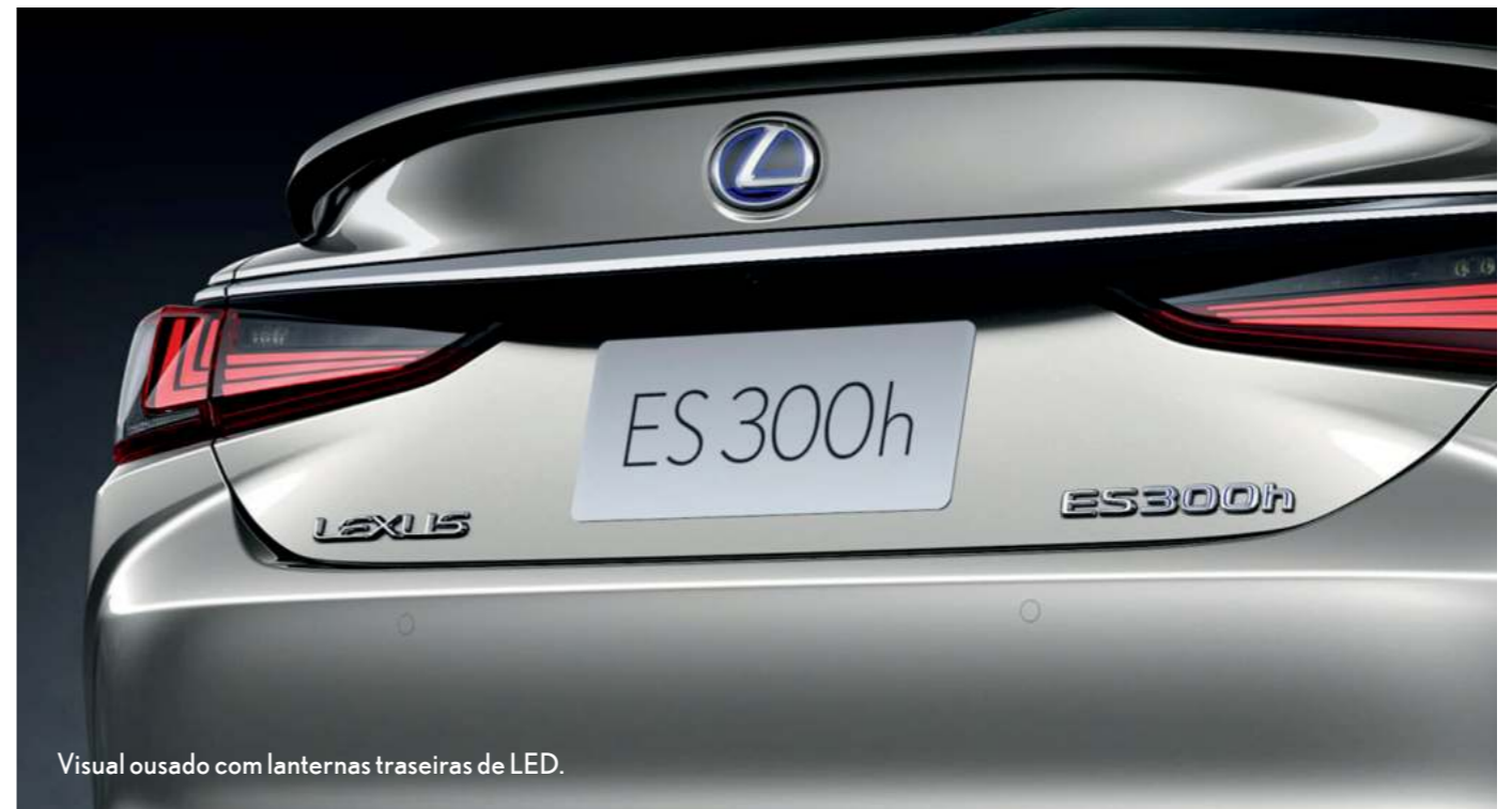
Visual ousado com lanternas traseiras de LED.