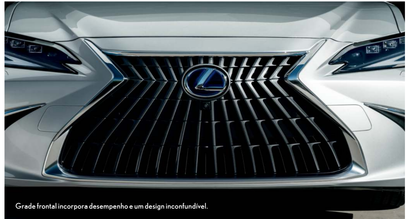
Grade frontal incorpora desempenho e um design inconfundível.