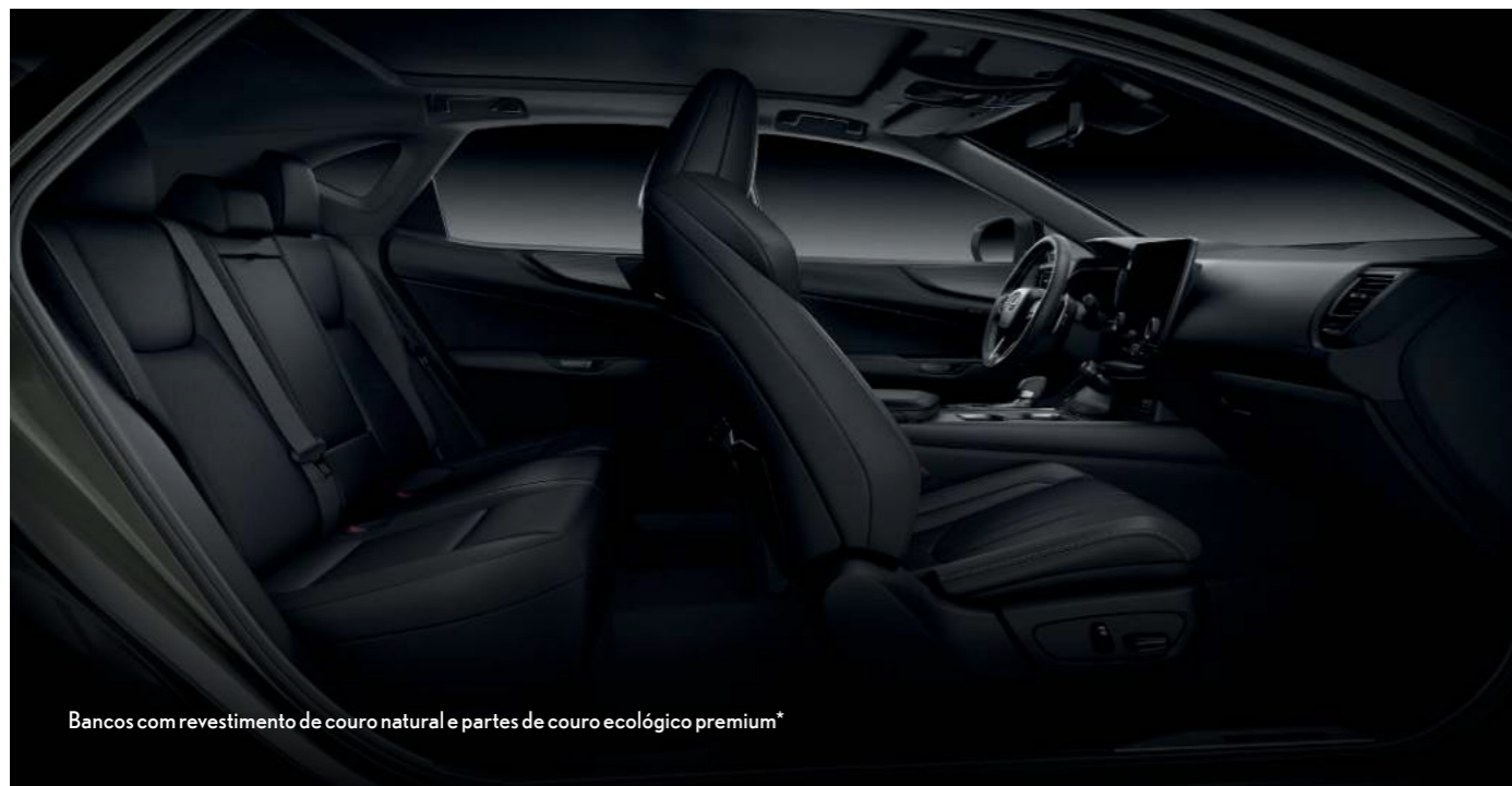
Bancos com revestimento de couro natural e partes de couro ecológico premium*

O Lexus NX 350h combina elegância esportiva com a funcionalidade prática de um amplo espaço interno. Para isso, o SUV híbrido oferece itens que facilitam a vida a bordo, como a coluna de direção com regulagem elétrica de altura e profundidade, o ar-condicionado digital dual zone integrado frio e quente, sensor de umidade e sistema S/Flow (direcionamento automático do fluxo de ar para os bancos dianteiros com ocupantes) e o porta-malas com abertura e fechamento elétrico e sistema hands-free*. Os bancos apresentam revestimento de couro natural e partes de couro ecológico premium, sendo os dianteiros dotados de regulagem elétrica de oito posições para o motorista e oito para o passageiro com ajustes de distância, inclinação e altura. Os bancos traseiros possuem rebatimento elétrico com sistema de aquecimento, bipartidos com descansa-braço central e porta-copos. O encosto e o banco do motorista contam ainda com Easy Access (função que desliza o banco para trás ou para a frente automaticamente, facilitando a entrada e a saída do carro)*.