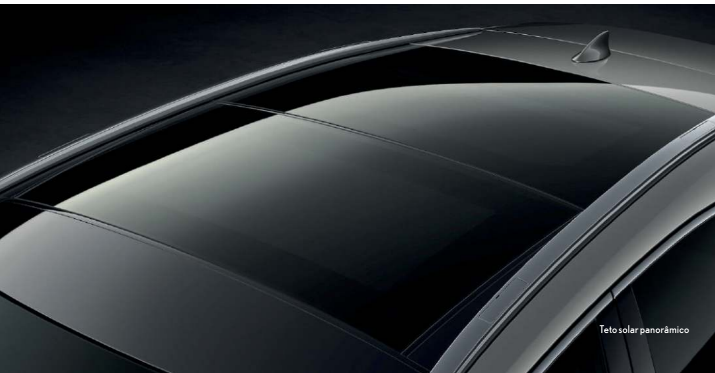
Teto solar panorâmico