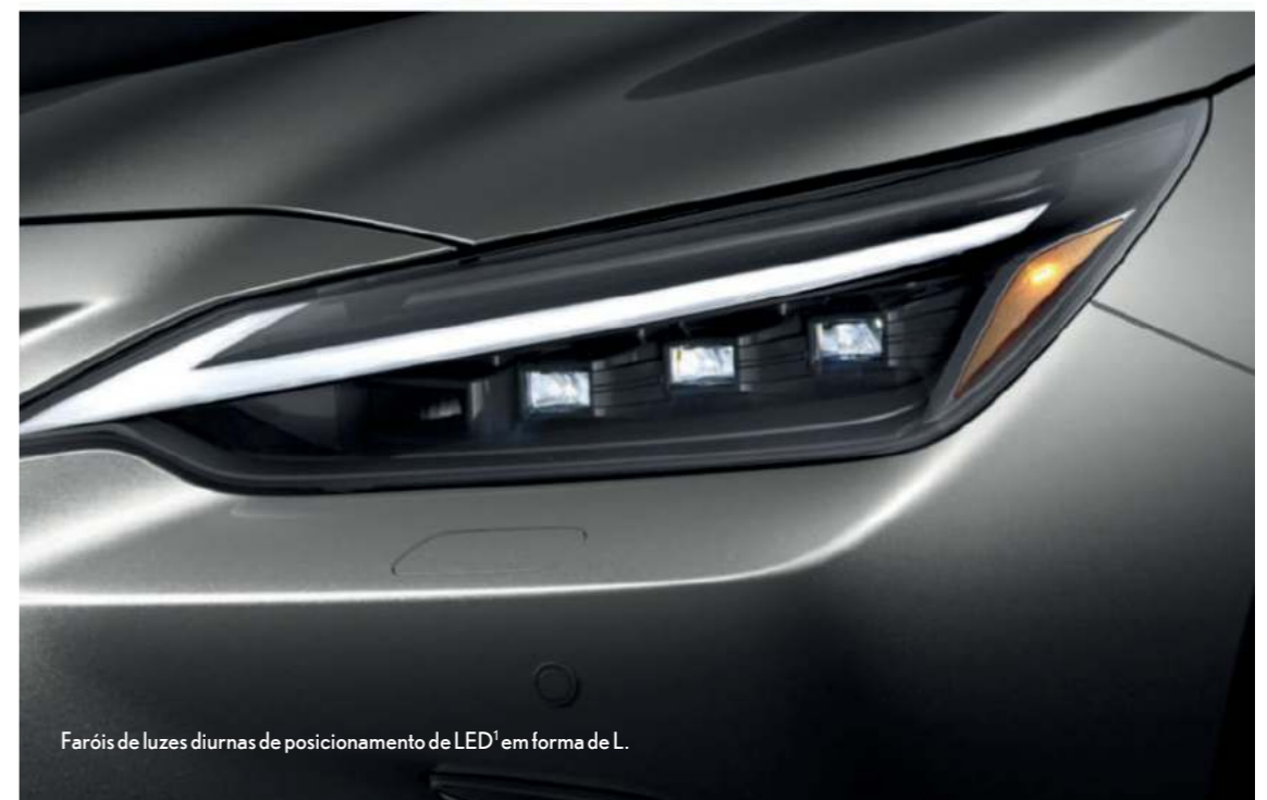
Faróis de luzes diurnas de posicionamento de LED 1 em forma de L.