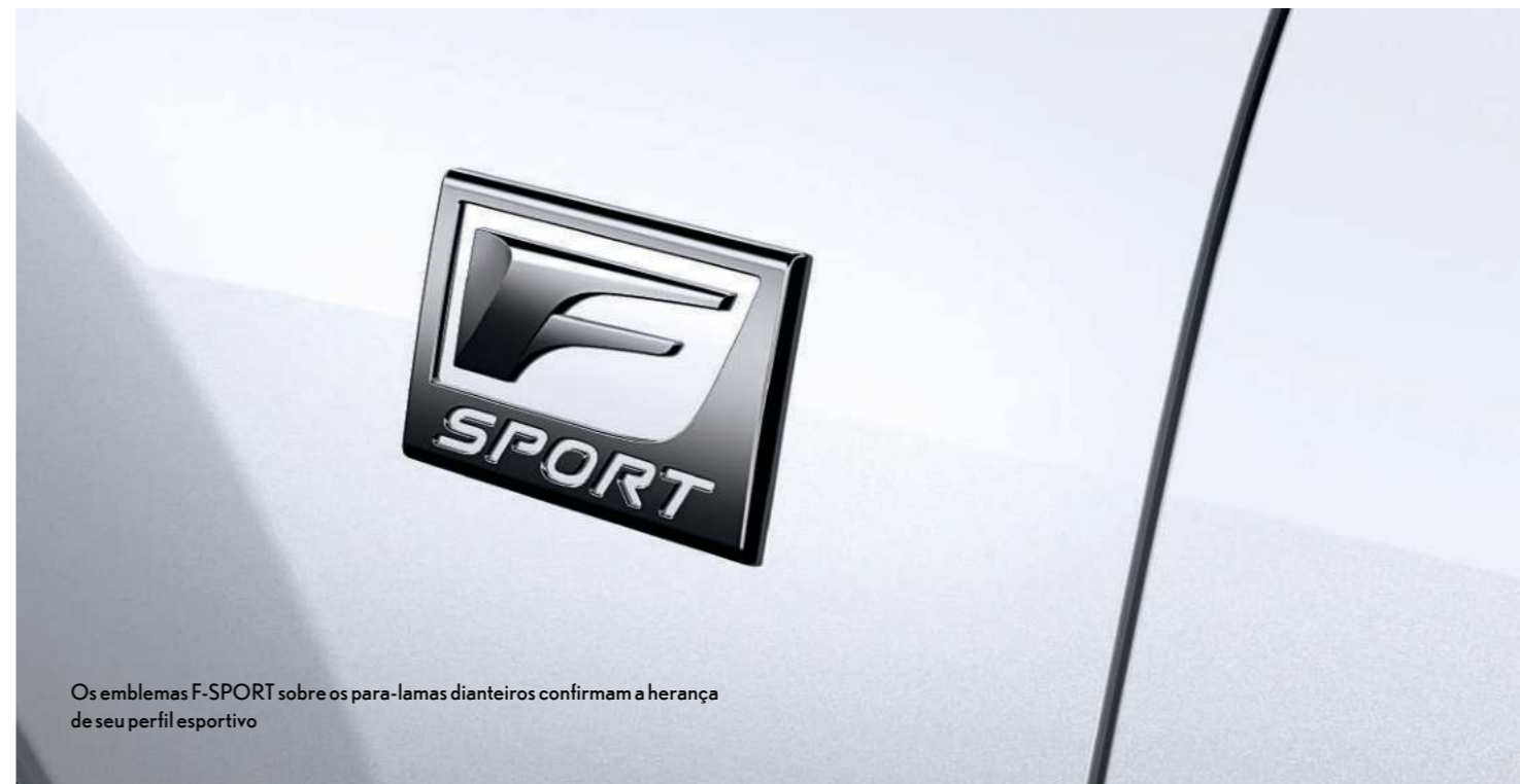
Os emblemas F-SPORT sobre os para-lamas dianteiros confirmam a herança de seu perfil esportivo