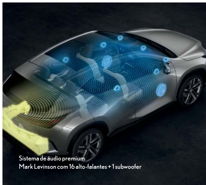
Sistema de áudio premium Mark Levinson com 16 alto-falantes + 1 subwoofer