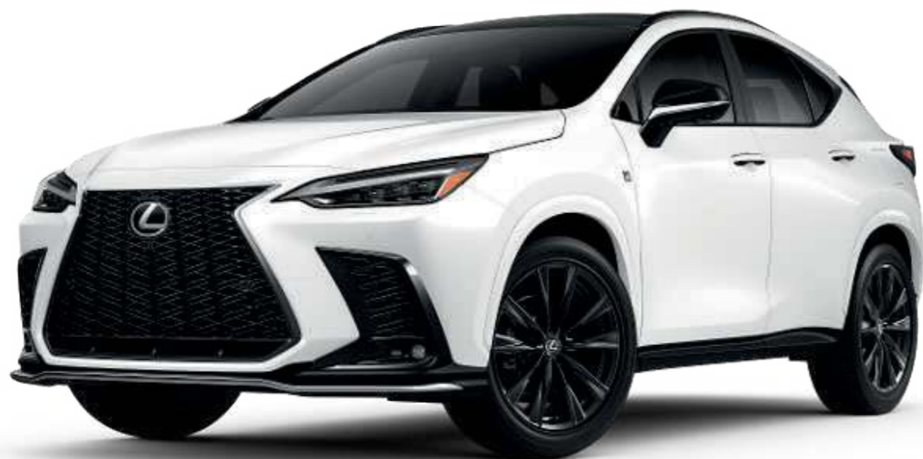
Branco Super Nova