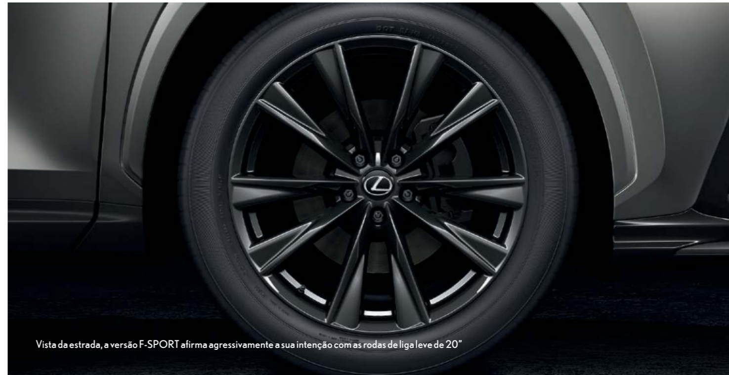
Vista da estrada, a versão F-SPORT afirma agressivamente a sua intenção com as rodas de liga leve de 20"