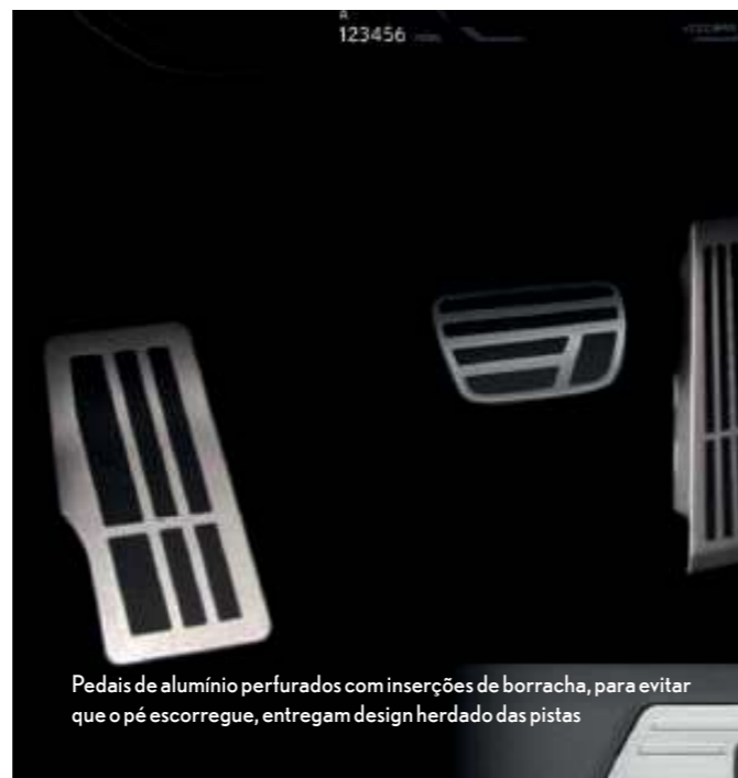
Pedais de alumínio perfurados com inserções de borracha, para evitar que o pé escorregue, entregam design herdado das pistas