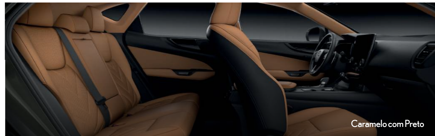
Caramelo com Preto