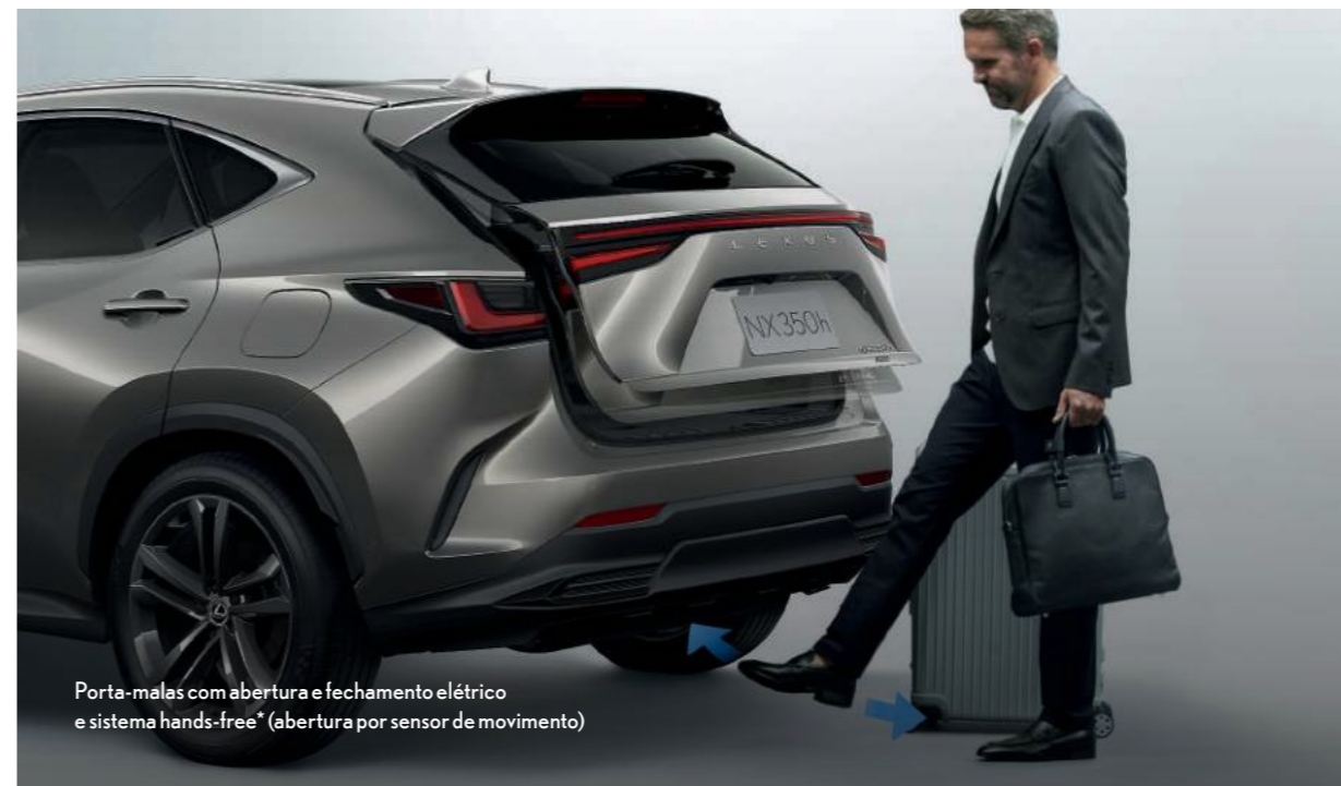
Porta-malas com abertura e fechamento elétrico e sistema hands-free* (abertura por sensor de movimento)