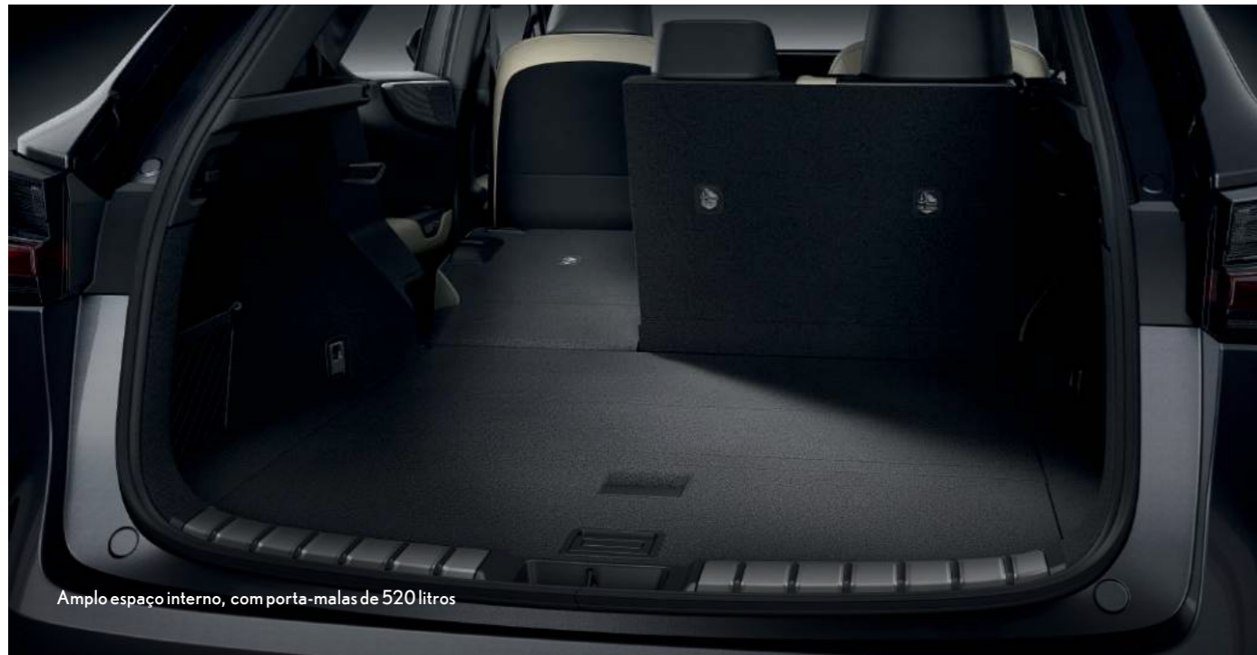
Amplo espaço interno, com porta-malas de 520 litros