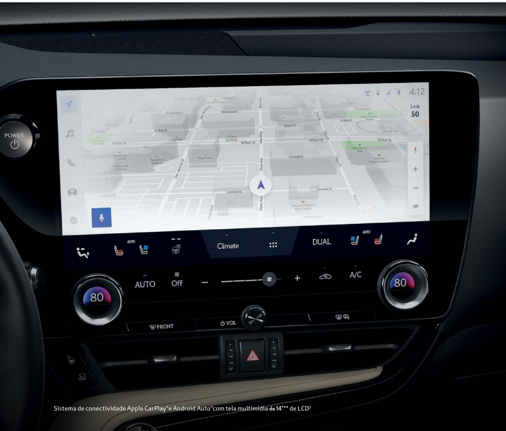
Sistema de conectividade Apple CarPlay ® e Android Auto ® com tela multimídia de 14 *** de LCD 2