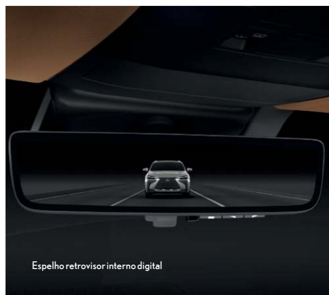
Espelho retrovisor interno digital