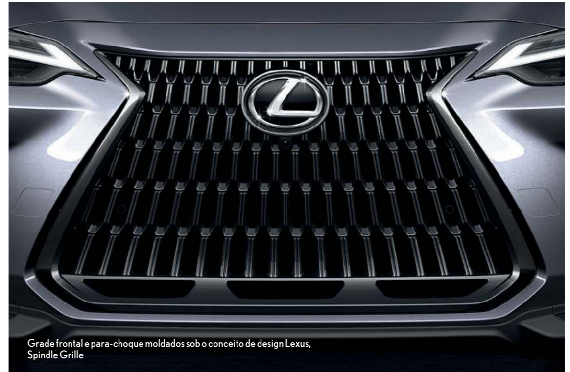
Grade frontal e para-choque moldados sob o conceito de design Lexus, Spindle Grille