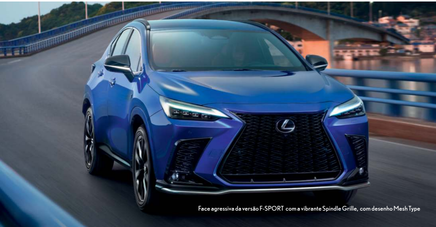
Face agressiva da versão F-SPORT com a vibrante Spindle Grille, com desenho Mesh Type