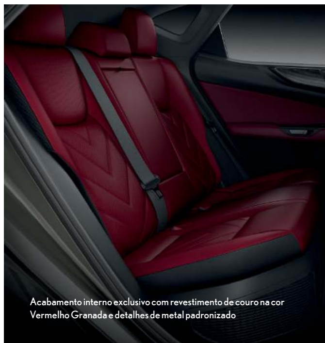
Acabamento interno exclusivo com revestimento de couro na cor Vermelho Granada e detalhes de metal padronizado