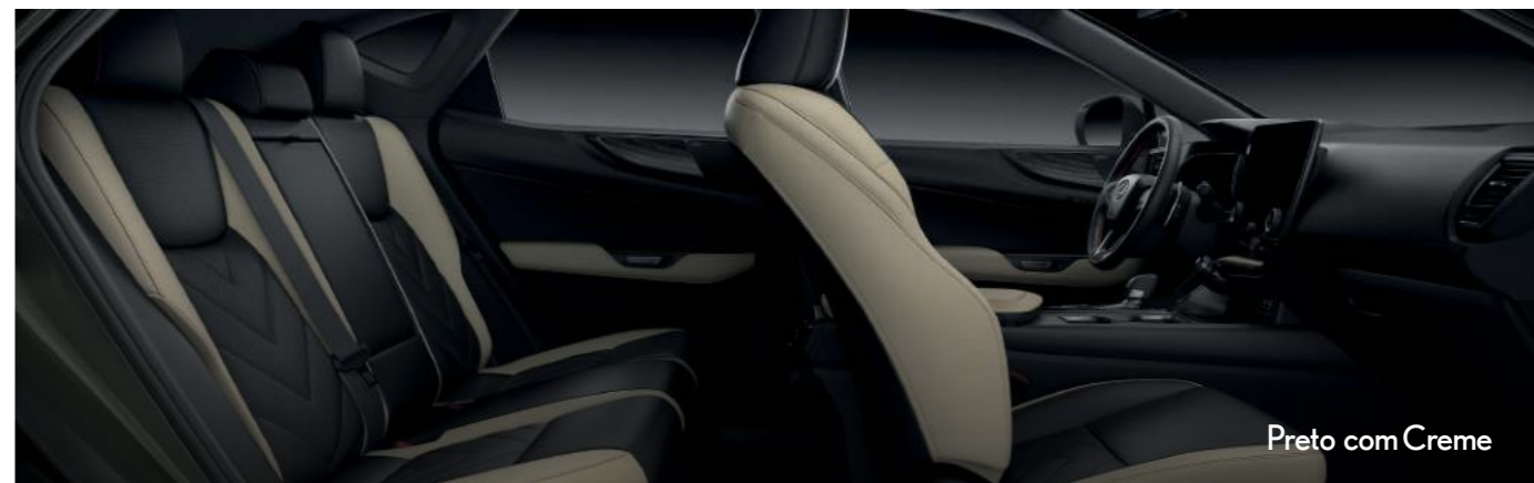
Preto com Creme