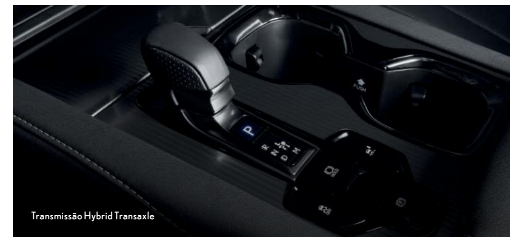
Transmissão Hybrid Transaxle