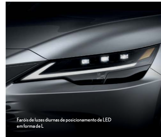
Faróis de luzes diurnas de posicionamento de LED em forma de L