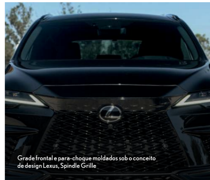
Grade frontal e para-choque moldados sob o conceito de design Lexus, Spindle Grille