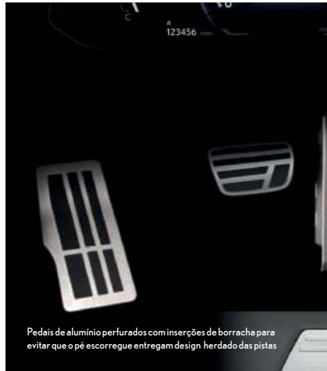
Pedais de alumínio perfurados com inserções de borracha para evitar que o pé escorregue entregam design herdado das pistas