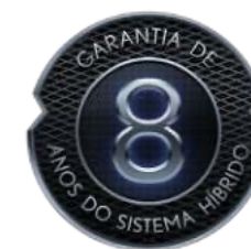
Tecnologia híbrida Resultado da combinação eficiente de um motor a combustão com um motor elétrico