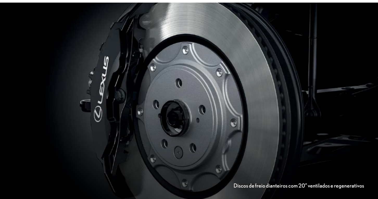
Discos de freio dianteiros com 20" ventilados e regenerativos