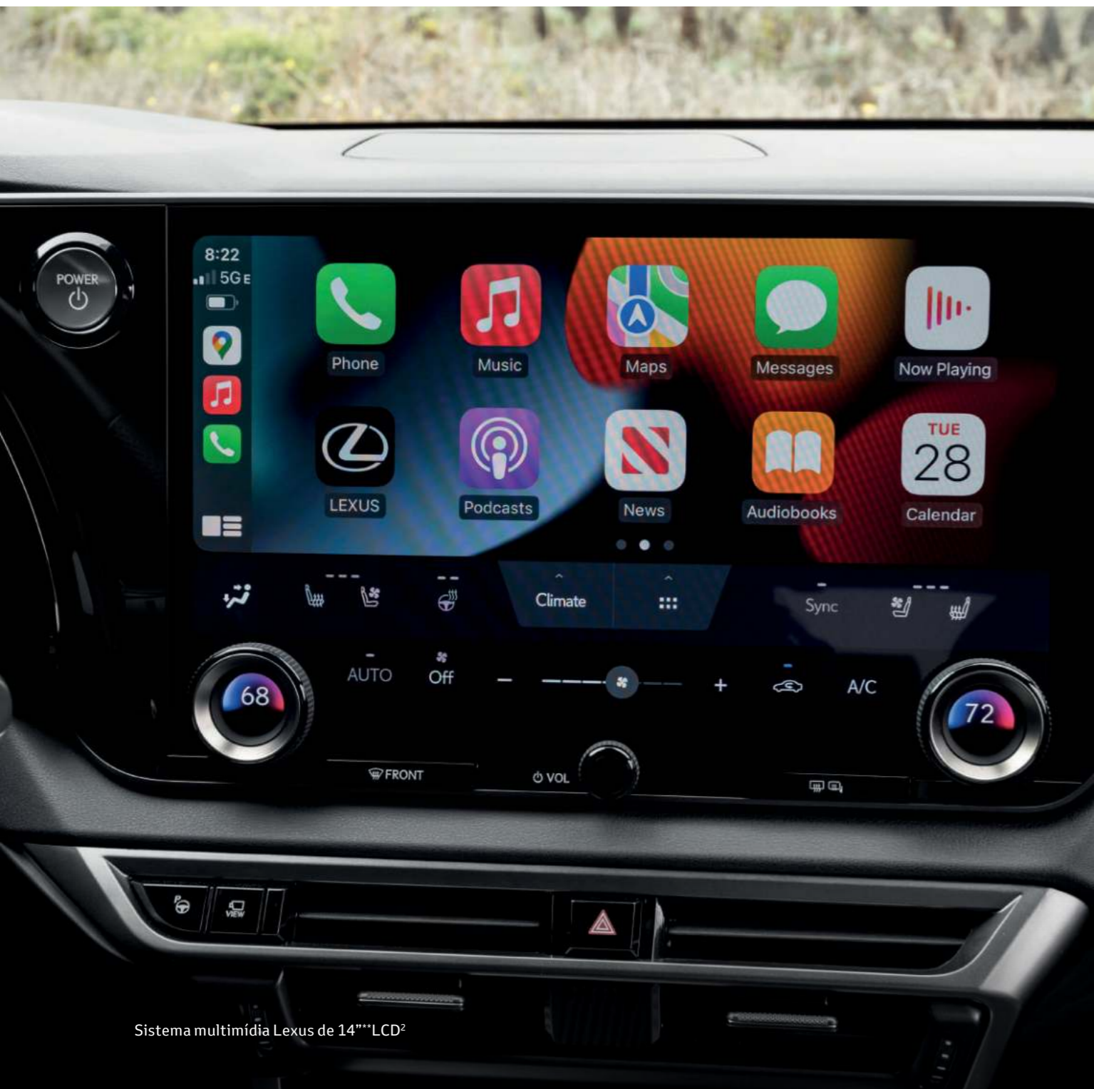
Sistema multimídia Lexus de 14" LCD 2