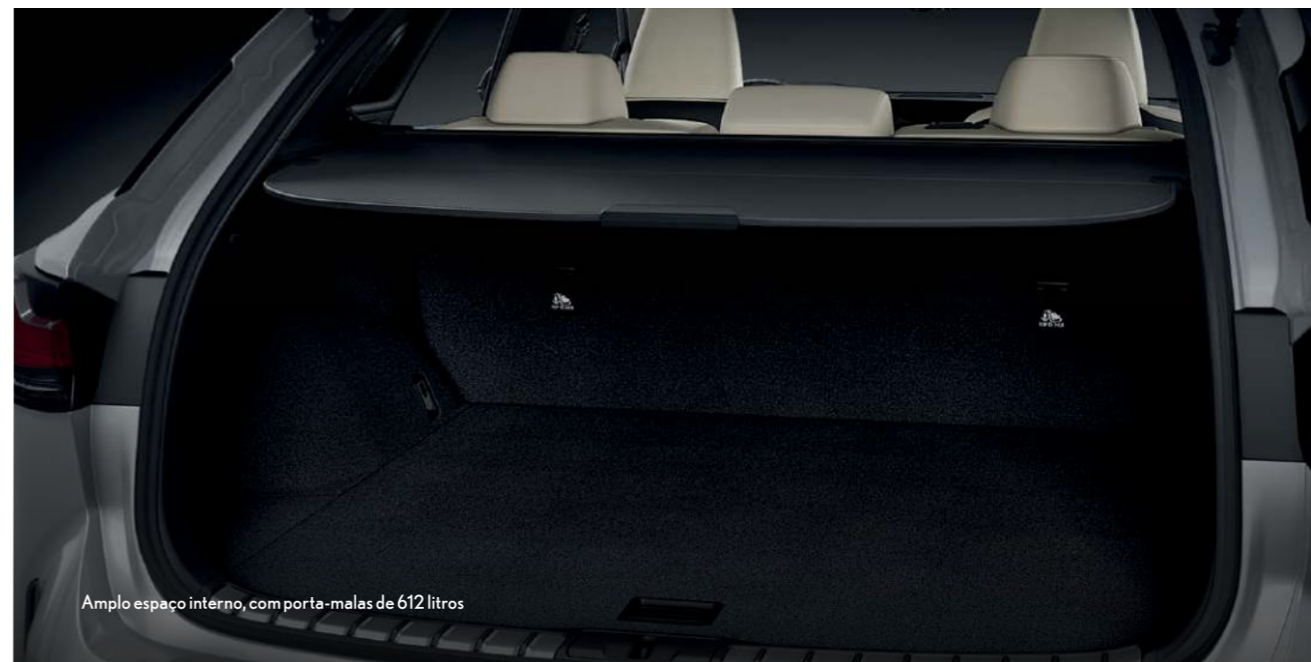
Amplio espaço interno, com porta-malas de 612 litros