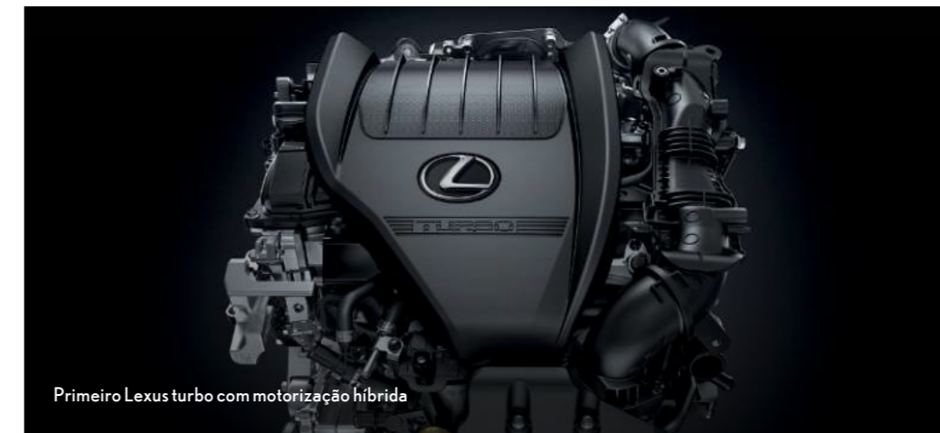
Primeiro Lexus turbo com motorização híbrida