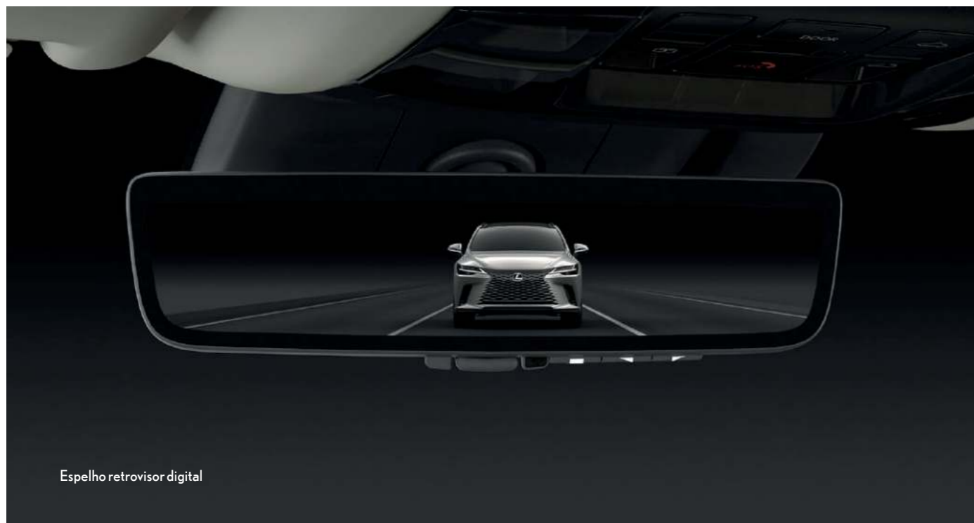
Espelho retrovisor digital

Experimente um interior meticulosamente projetado para conectar o motorista ao veículo, em que os recursos são colocados exatamente onde você espera que eles estejam e arranjados artisticamente para ajudar a manter seu foco na estrada à frente. O Lexus RX 500h apresenta bancos dianteiros com regulagem elétrica para 10 posições, incluindo ajustes de distância, inclinação, altura e lombar, controle de memória com capacidade para armazenar até 3 perfis + função Smart Entry. O motorista também conta com a direção eletroassistida progressiva, que facilita a realização de manobras, e a coluna de direção com regulagem elétrica de altura e profundidade, promovendo mais conforto ao dirigir. Além disso, o SUV apresenta comando elétrico para abertura e fechamento do porta-malas, privilegiando comodidade. O RX 500h conta com uma segunda fileira de acentos com rebatimento elétrico.