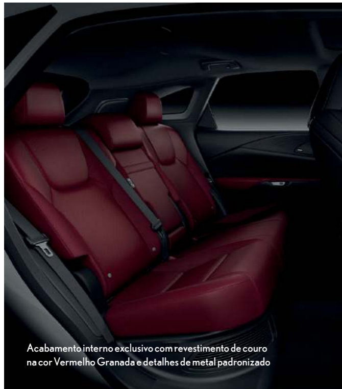
Acabamento interno exclusivo com revestimento de couro na cor Vermelho Granada e detalhes de metal padronizado