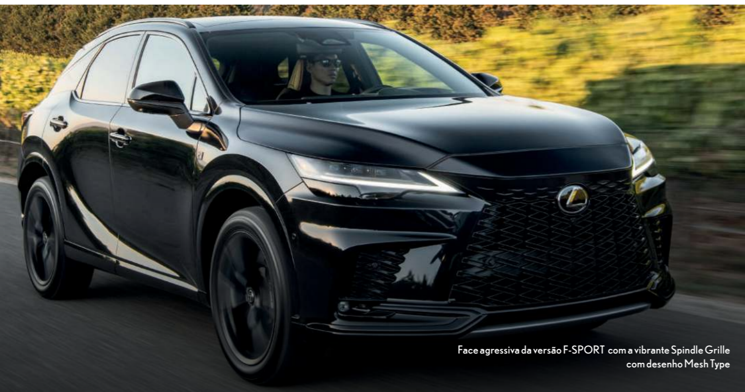
Face agressiva da versão F-SPORT com a vibrante Spindle Grille com desenho Mesh Type