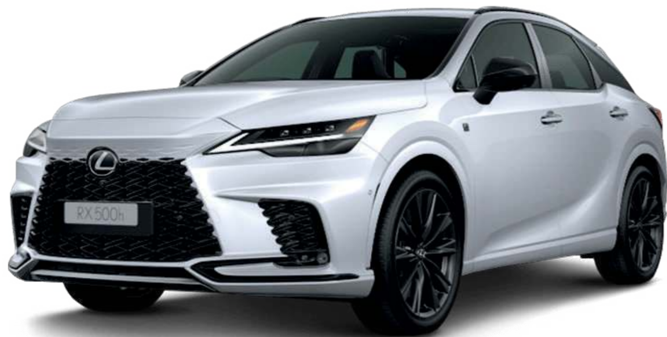
Branco Super Nova