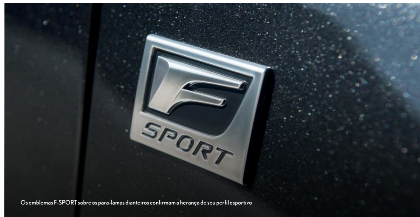
Os emblemas F-SPORT sobre os para-lamas dianteiros confirmam a herança de seu perfil esportivo