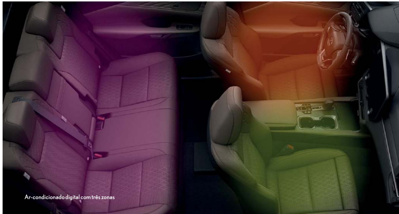
Ar-condicionado digital com três zonas