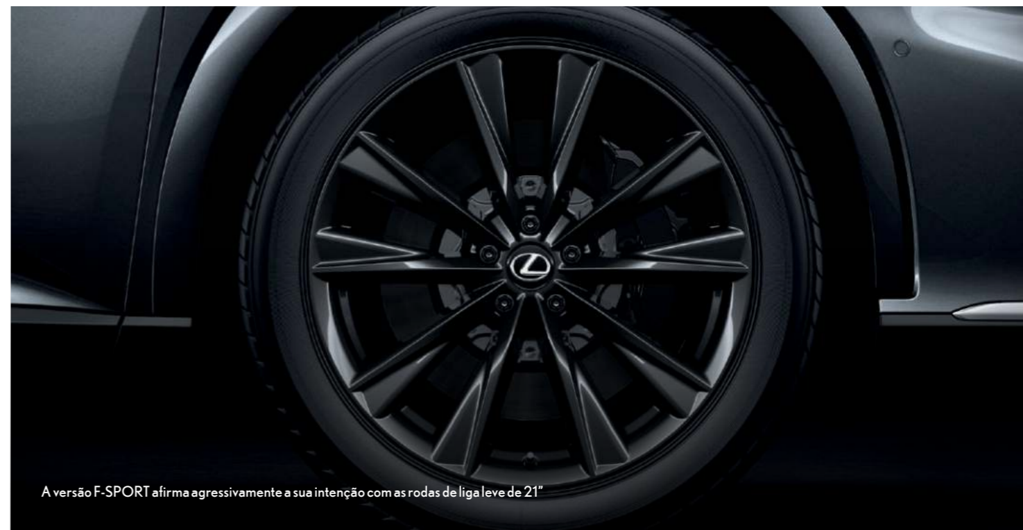
A versão F-SPORT afirma agressivamente a sua intenção com as rodas de liga leve de 21"