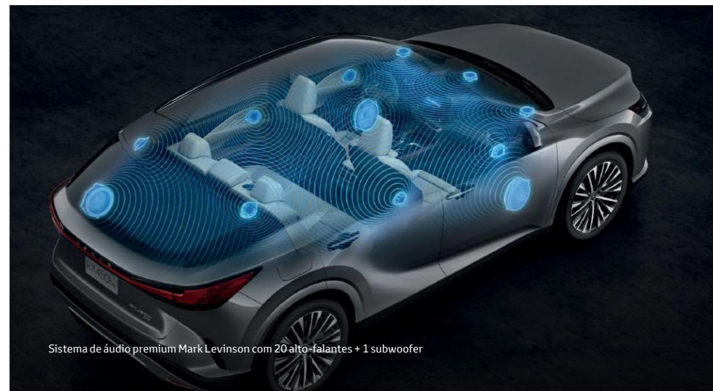
Sistema de áudio premium Mark Levinson com 20 alto-falantes + 1 subwoofer

Vá além da interação, experimente uma tecnologia que funciona como uma extensão de você, permitindo que você personalize sua experiência. A integração do Intelligent Assistant permite que você controle a maioria dos recursos apenas com sua voz. Com o sistema multimídia Lexus de 14" touchscreen + sistema Bluetooth + rádio AM/FM + sistema de conectividade Apple CarPlay® e Android Auto® + sistema de navegação GPS + câmera com visão 360°, o novo RX 500h não é apenas incomparável, é impressionante.