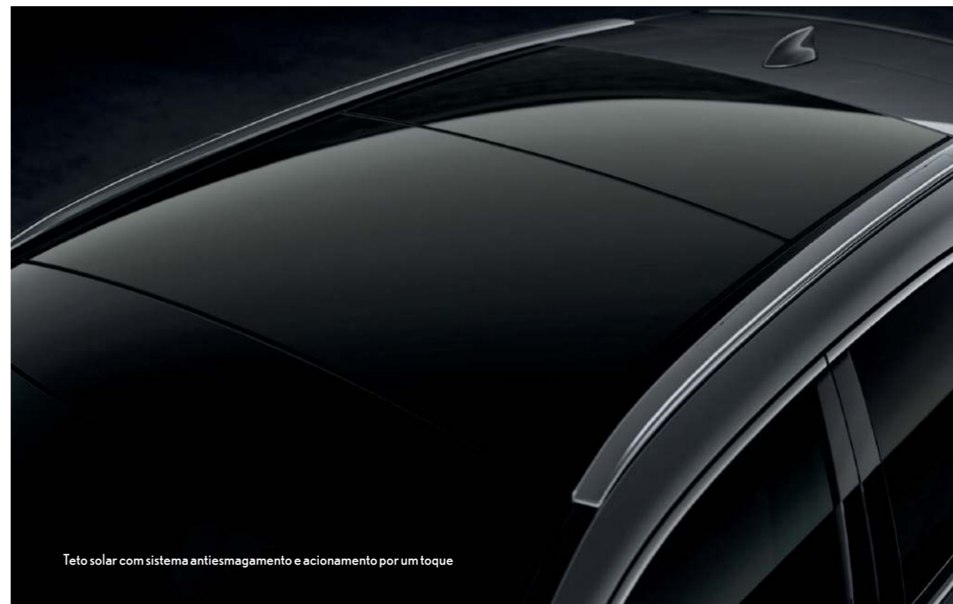
Teto solar com sistema antiesmagamento e acionamento por um toque