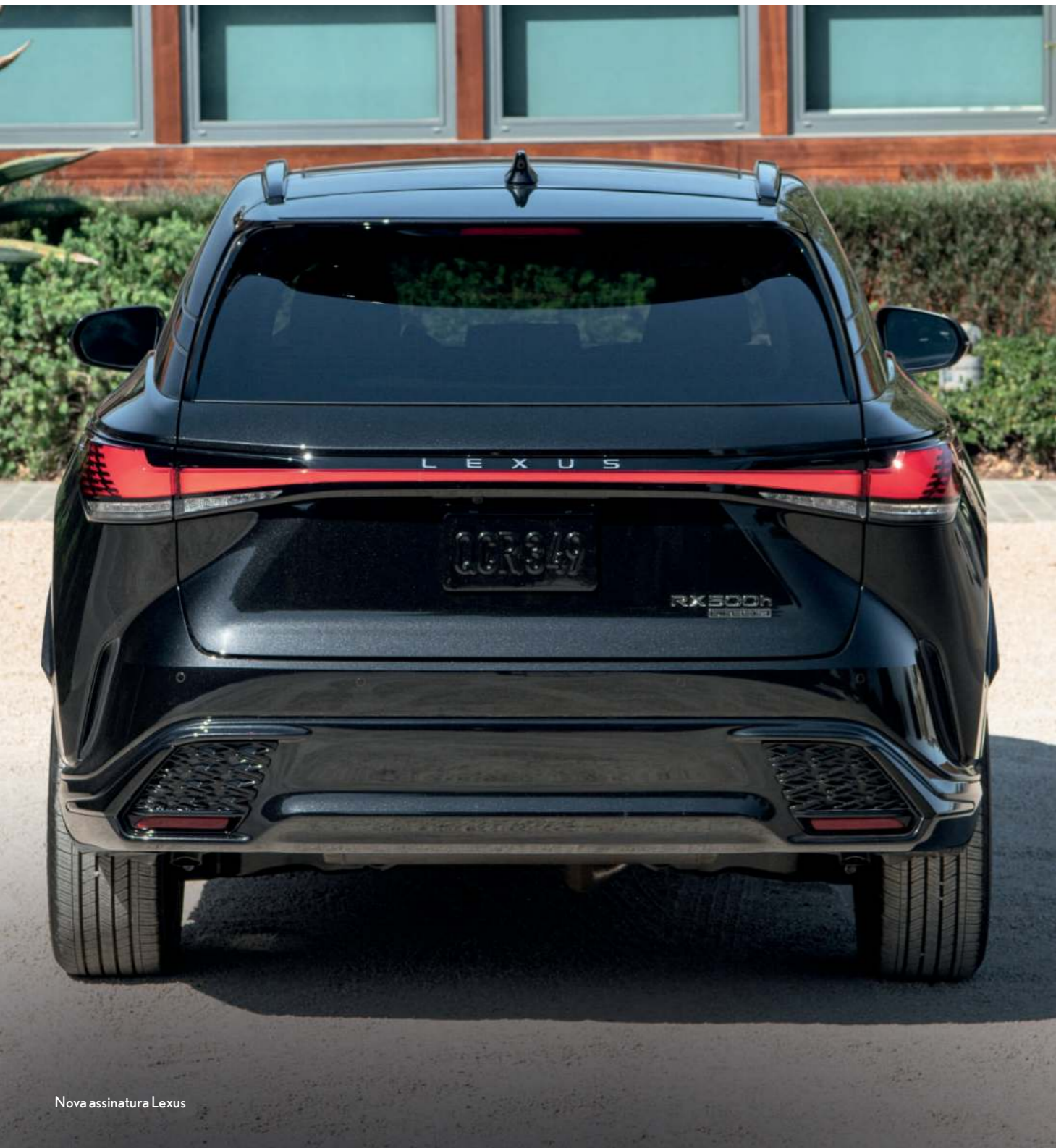
Nova assinatura Lexus