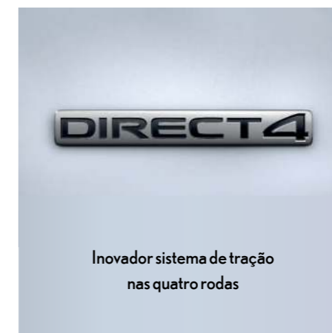
Inovador sistema de tração nas quatro rodas