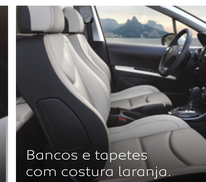
Bancos e tapetes com costura laranja.