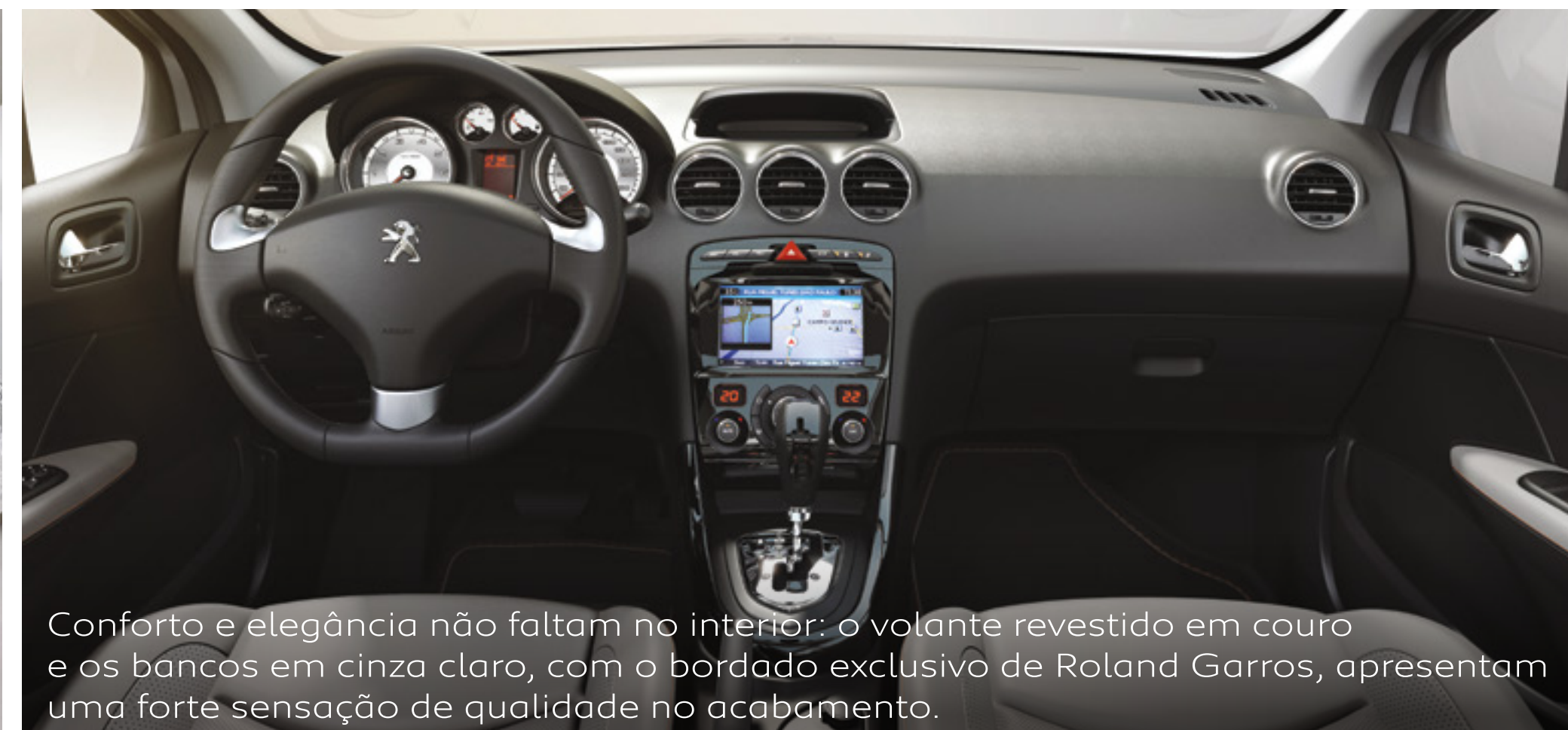
Conforto e elegância não faltam no interior: o volante revestido em couro e os bancos em cinza claro, com o bordado exclusivo de Roland Garros, apresentam uma forte sensação de qualidade no acabamento.