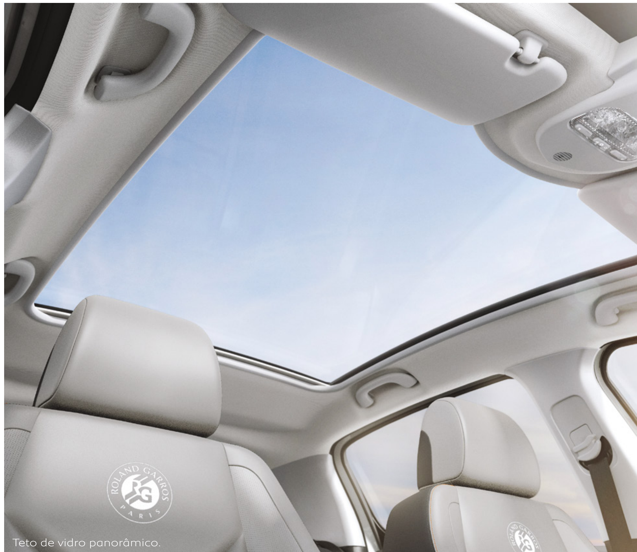
Teto de vidro panorâmico.

Dinamismo, esportividade e estilo. Um carro cheio de personalidade.