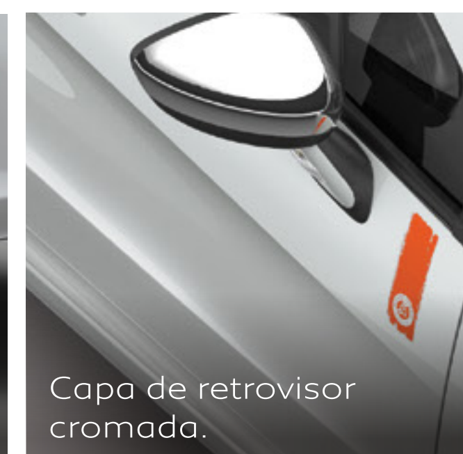
Capa de retrovisor cromada.