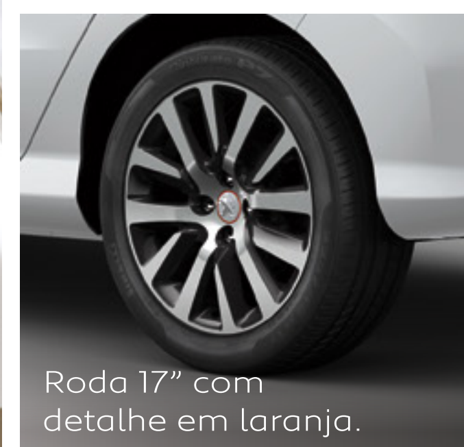
Roda 17" com detalhe em laranja.