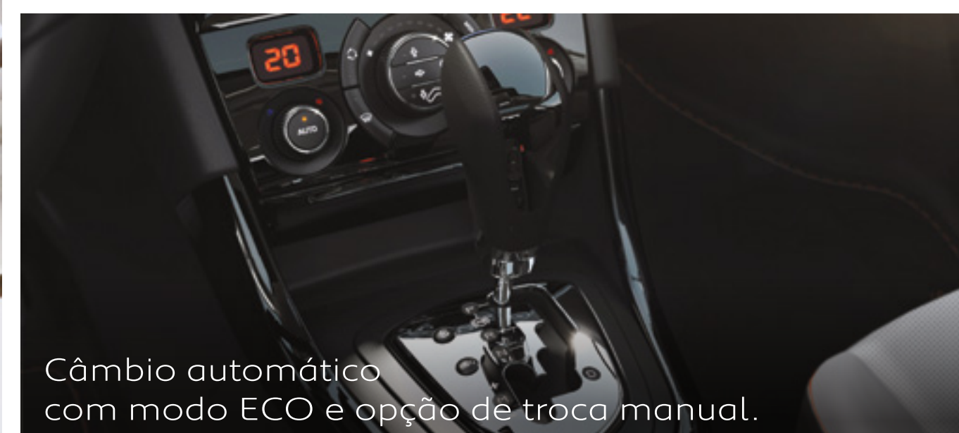
Câmbio automático com modo ECO e opção de troca manual.