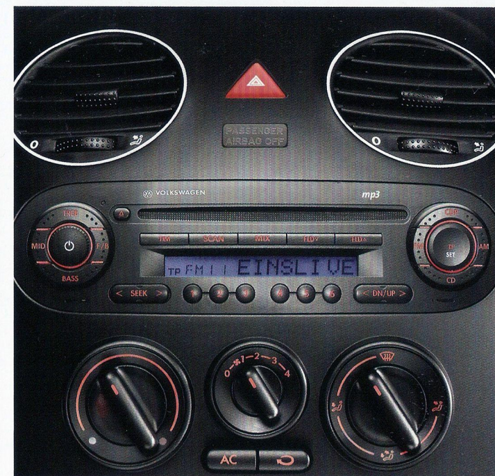
Ar-condicionado, CD player com função MP3 e 6 alto-falantes