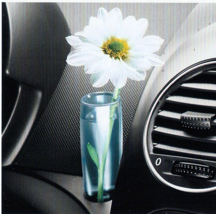
Porta-decoração no painel de instrumentos