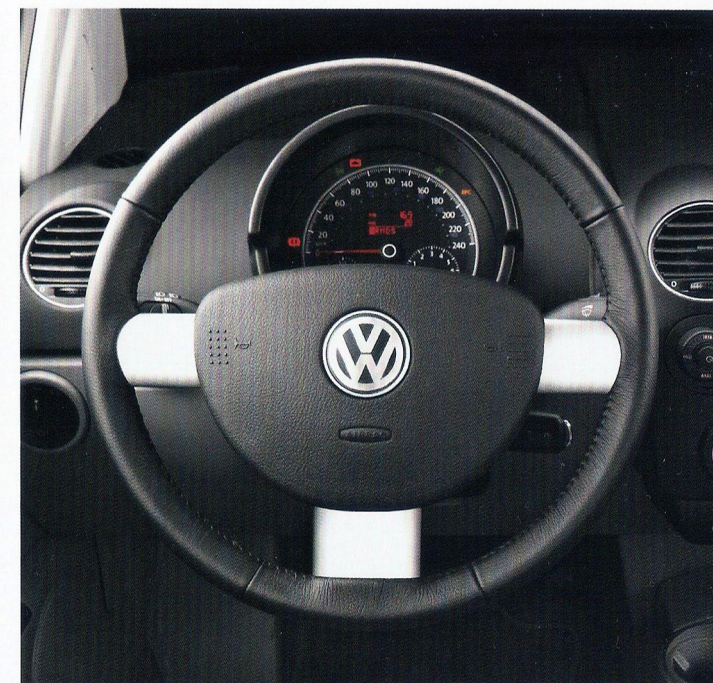
Airbag frontal e lateral - série