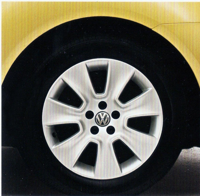
Roda de liga leve 16" - Mali