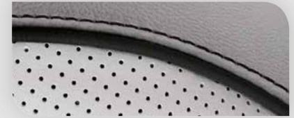
Cuir (synthétique) gris avec accentuations noires