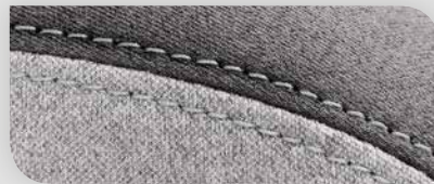
Tissu gris bicolore avec coutures grises