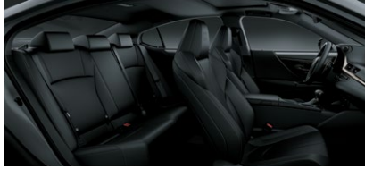
NULUXE F SPORT NOIR