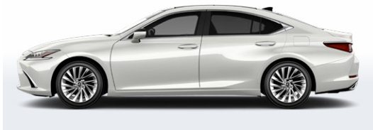
BLANC ÉMINENT NACRÉ