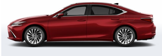
ROUGE MATADOR MICA