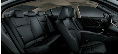
CUIR SUPÉRIEUR NOIR