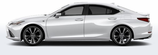
ULTRA BLANC ( F SPORT )