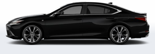
NOIR OBSIDIENNE ( F SPORT )