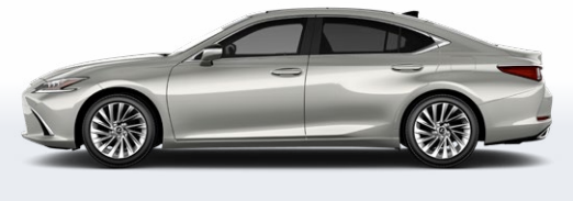
BEIGE LUNAIRE MÉTALLISÉ