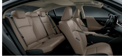
CUIR SUPÉRIEUR CHÂTEAU