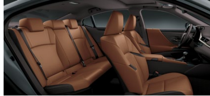
CUIR SUPÉRIEUR LIN