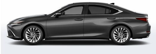
GRIS NÉBULEUX NACRÉ