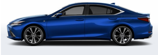
BLEU ULTRASONIQUE MICA 2.0 ( F SPORT )