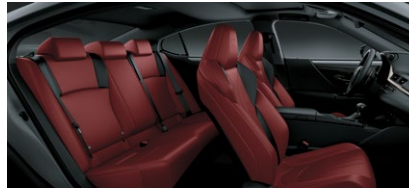
NULUXE F SPORT ROUGE CIRCUIT