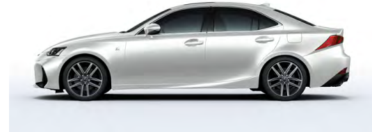
ULTRA BLANC ( F SPORT )