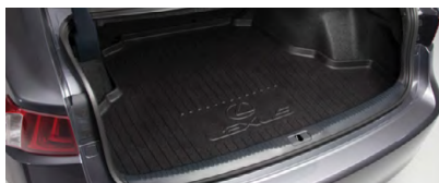
DOUBLURE DE COMPARTIMENT DE CHARGE