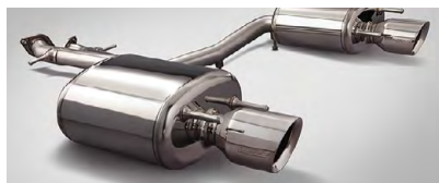
ÉCHAPPEMENT DOUBLE DE PERFORMANCE F SPORT