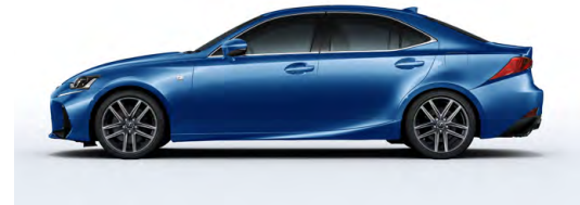
BLEU ULTRASONIQUE MICA 2.0 ( F SPORT )