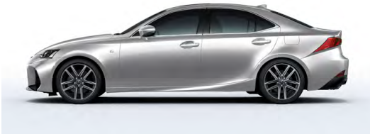
PLATINE LIQUIDE ( F SPORT )