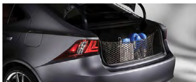
FILET DE RÉTENTION