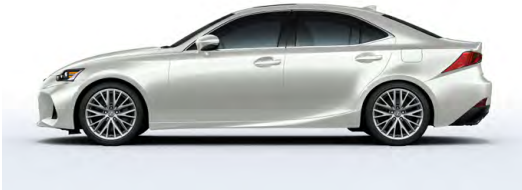
BLANC ÉMINENT NACRÉ