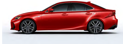
LIGNE ROUGE ( F SPORT )