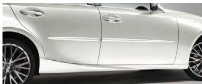
MOULURES PROTECTRICES LATÉRALES