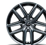
F SPORT (EN OPTION) – ROUES EN ALLIAGE DE 18 PO À 5 RAYONS DOUBLES EN PARALLÈLE