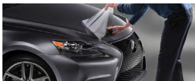
PELLICULE DE PROTECTION DE LA PEINTURE