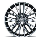
IS 300 AWD (EN OPTION) – ROUES EN ALLIAGE DE 18 PO À 10 RAYONS