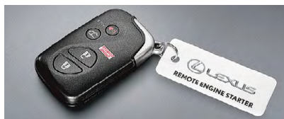
DÉMARREUR DE MOTEUR À DISTANCE