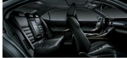
NULUXE NOIR F SPORT