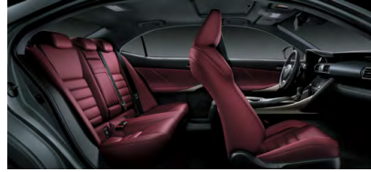
NULUXE ROUGE RIOJA F SPORT