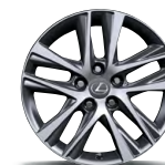
IS 300 RWD, IS 300 AWD – ROUES EN ALLIAGE DE 17 PO À 10 RAYONS