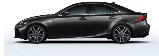
NOIR OBSIDIENNE ( F SPORT )