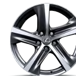
IS 350 AWD – ROUES EN ALLIAGE DE 18 PO À 5 RAYONS