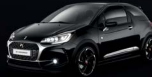
Noir Perla Nera (N) Pavillon Monoton