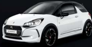
Blanc Banquise (O) Pavillon Noir Onyx (O)