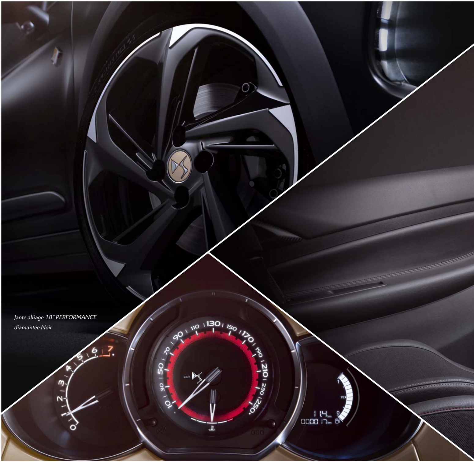
Jante alliage 18" PERFORMANCE diamantée Noir