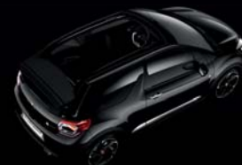
Noir Perla Nera (N) Toile Noir