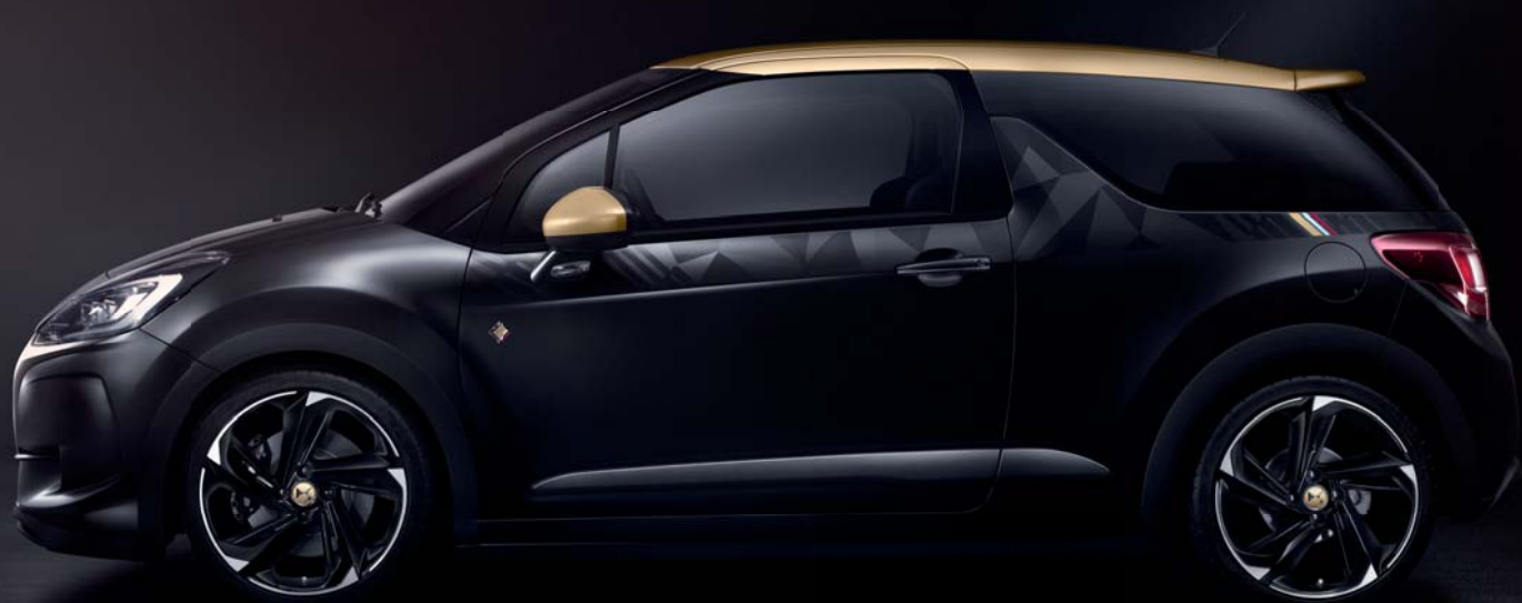
DS 3 PERFORMANCE Black Special avec Adhésifs latéraux de personnalisation extérieure PERFORMANCE