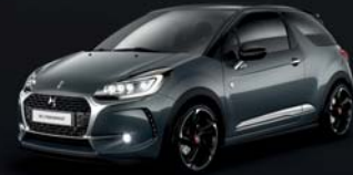
Gris Shark (N) Pavillon Noir Onyx (O)