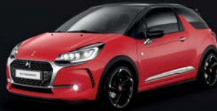
Rouge Aden (O) Pavillon Noir Onyx (O)