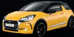
Jaune Pégase (O) Pavillon Noir Onyx (O)