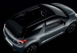
Gris Shark (N) Toile Noir