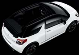
Blanc Banquise (O) Toile Noir