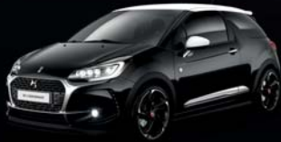
Noir Perla Nera (N) Pavillon Blanc Opale (O)