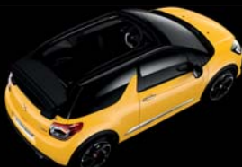
Jaune Pégase (O) Toile Noir