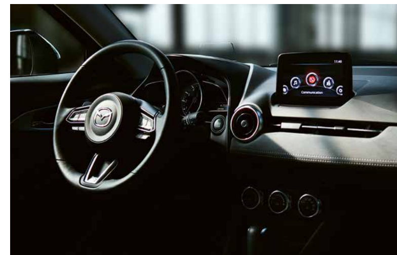
Mazda CX-3 Revolution in Soul Red Crystal

Unser Crossover-SUV hat genau die richtige Grösse für Ihren dynamischen urbanen Lebensstil. Mit ihm ist das Parkieren in der Stadt ein Kinderspiel – nicht nur dank seiner kompakten Grösse, sondern auch dank dem 360° Surround View. Deshalb ist der Mazda CX-3 die richtige Wahl fürs Einkaufen, die Fahrt zur Arbeit, zu Ihren Hobbys oder ganz einfach für den Spass am Fahren. Und mit einem Kofferraumvolumen von bis zu 1260 Litern bei abgeklappten Rücksitzen haben Sie genau den Stauraum, den Sie im Alltag benötigen.