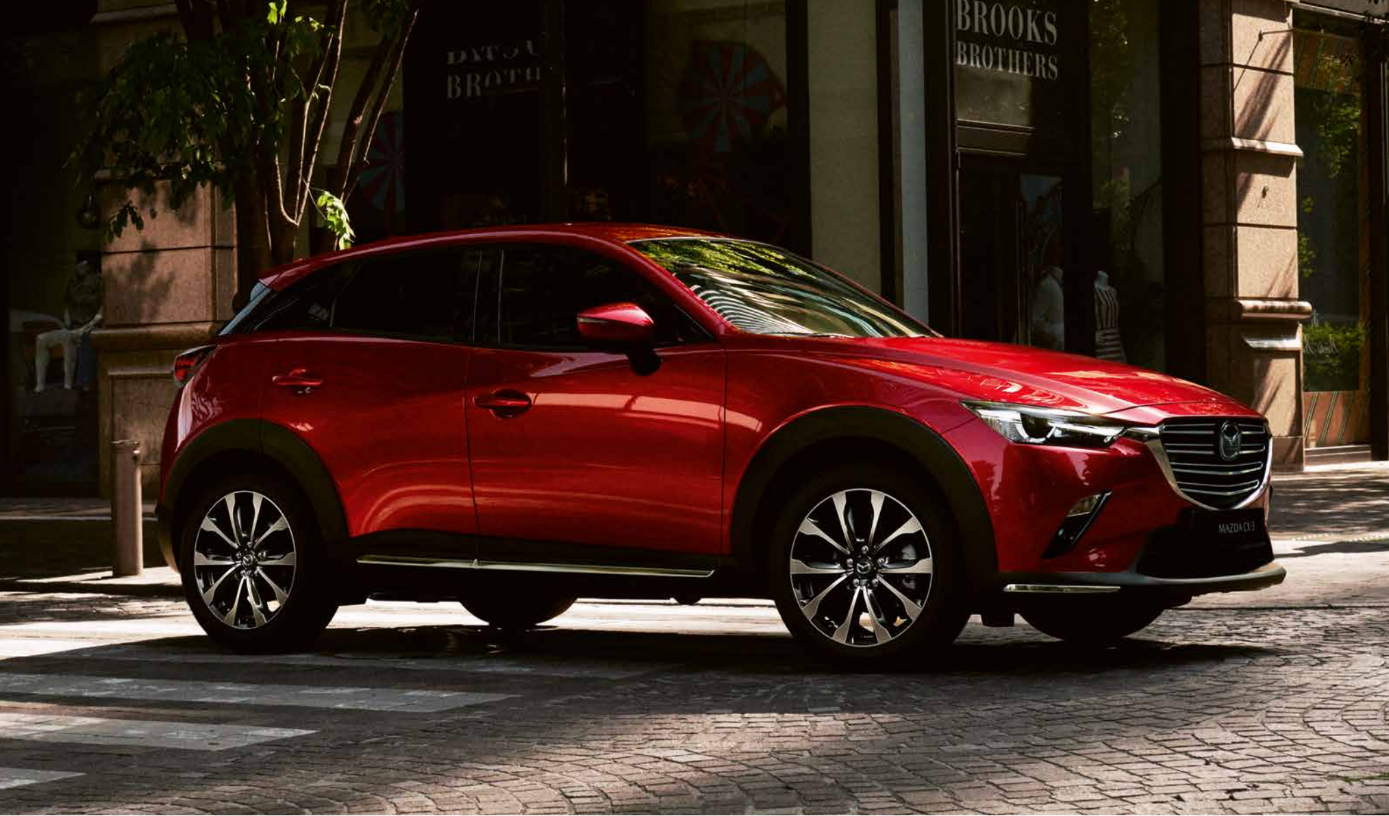
Mazda CX-3 Revolution in Soul Red Crystal