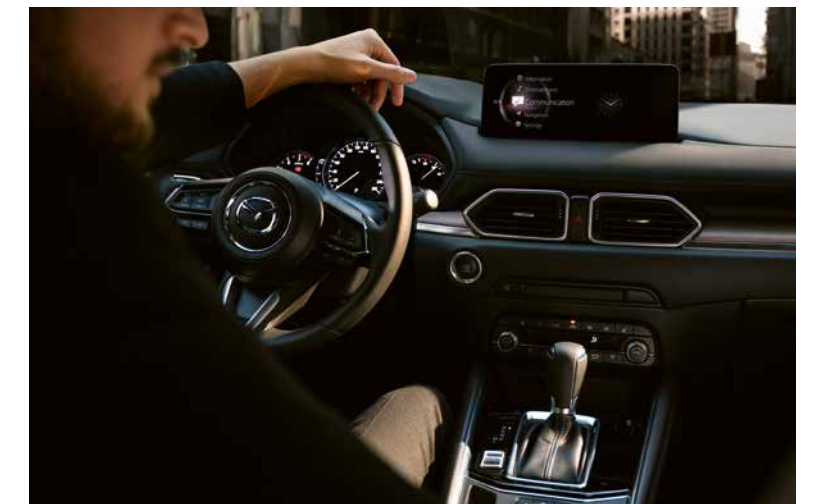
Mazda CX-5 Revolution in Soul Red Crystal

Für längere Reisen mit Ihrer Familie bietet der Innenraum bis zu fünf Personen viel Beinfreiheit. Mit der Sitzbelüftung vorn sowie den beheizbaren Vorder- und Rücksitzen ist der Komfort in jeder Jahreszeit sichergestellt. Und keine Sorge, dass sich auf der langen Fahrt jemand langweilt: Der Mazda CX-5 verfügt über USB-Anschlüsse vorn und hinten, einen AUX-Anschluss sowie Konnektivitätsfunktionen der neuesten Generation.