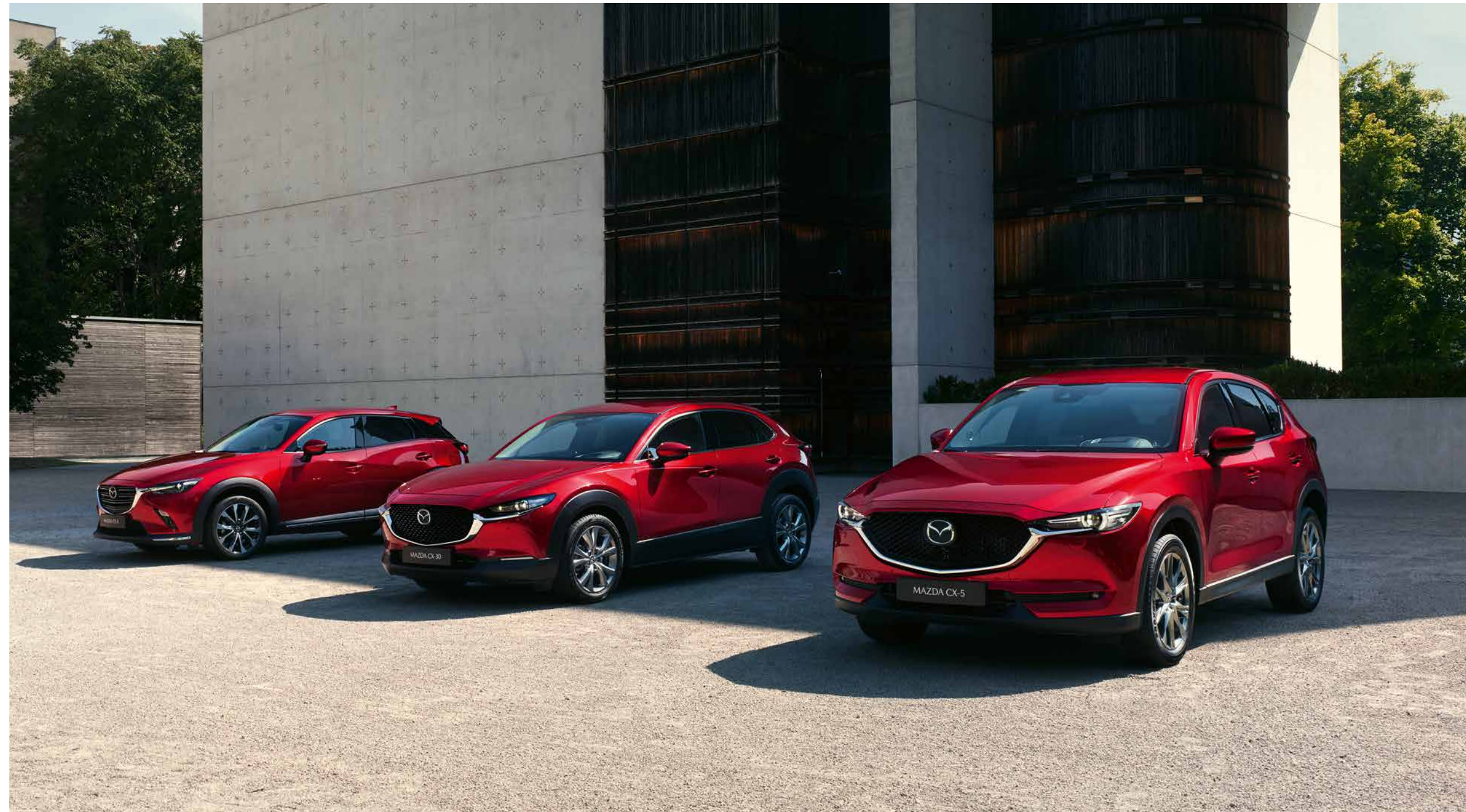
Mazda CX-3, Mazda CX-30 und Mazda CX-5 (von links nach rechts)

Es ist einfach, die richtige Wahl zu treffen, wenn man die richtigen Optionen hat. Die CX-Palette von Mazda bietet Ihnen ein einzigartiges, stilvolles und dynamisches Fahrerlebnis. Mit jedem unserer Kompakt-, Crossover- und Familien-SUV-Modelle. Ob junge oder erfahrenere Familien, ob Abenteuerer oder Stadtentdecker – Mazda hat für alle Bedürfnisse den perfekten SUV entwickelt. Denn das ist unser Beitrag zu einem besseren Leben: Wir bauen Fahrzeuge, die genau zu Ihrem Lebensstil passen.