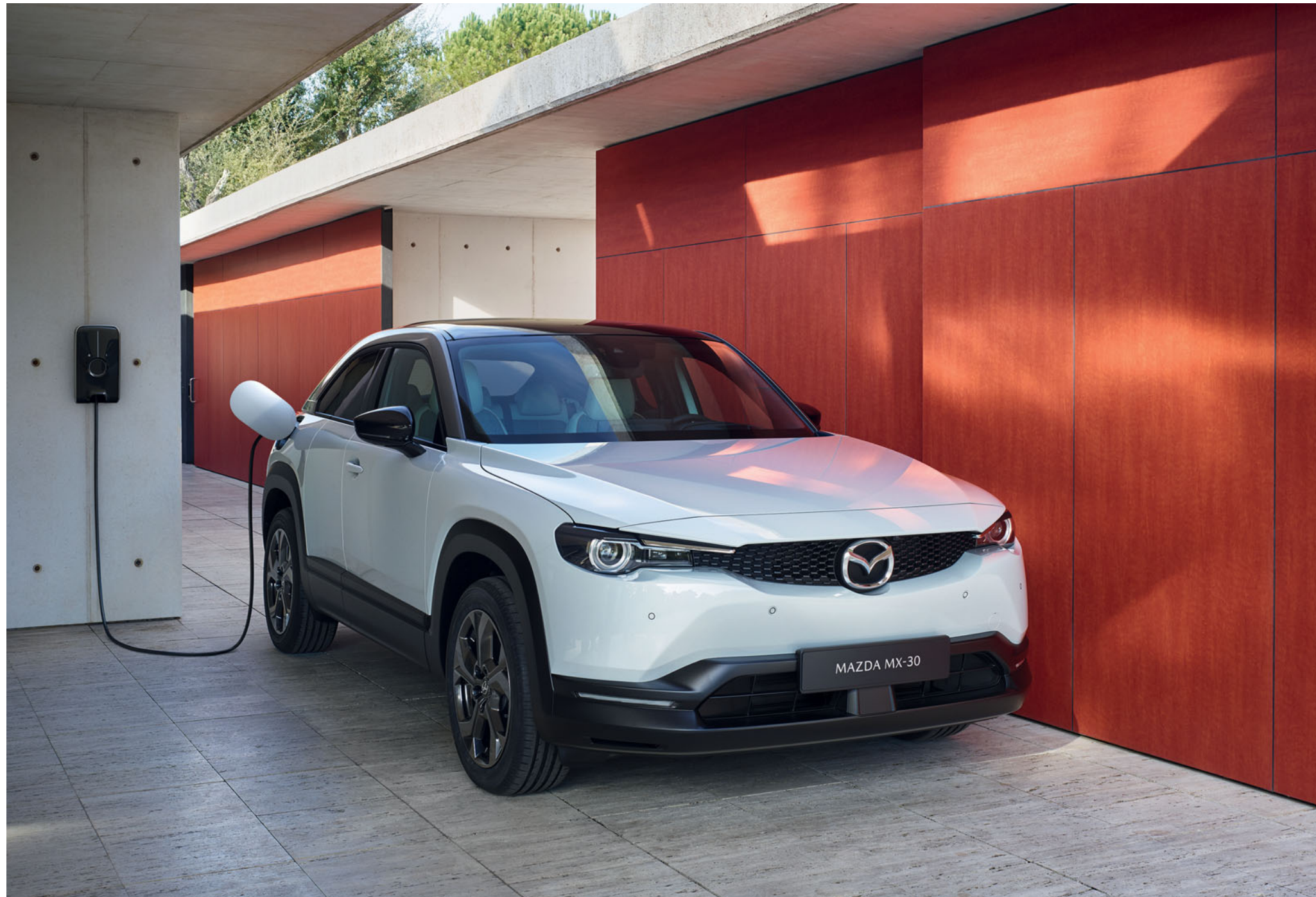
Mazda MX-30 Revolution in Ceramic 3-Ton