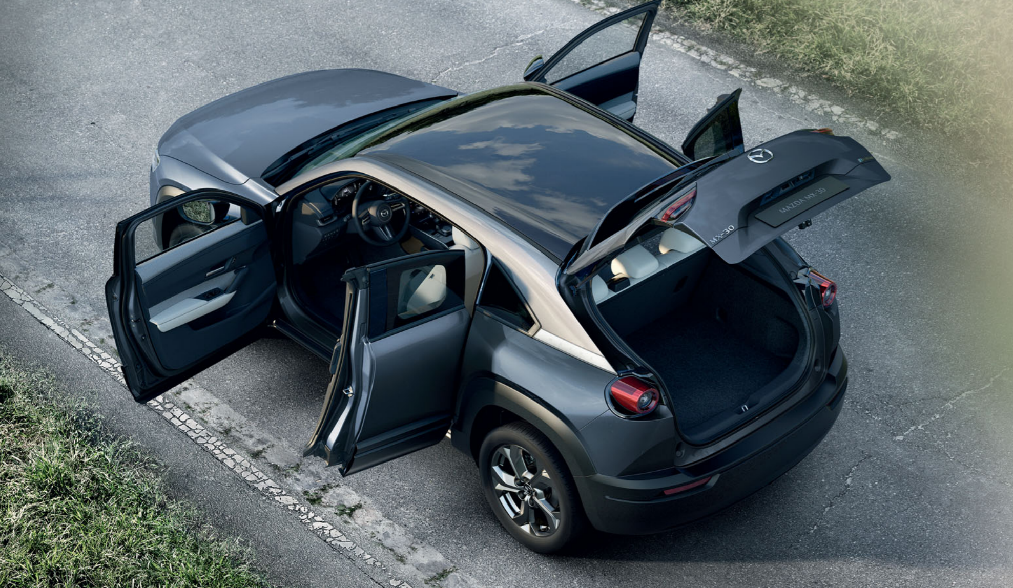
Mazda MX-30 Revolution in Polymetal Gray 3-Ton

Alle Mazda MX-30 in dieser Broschüre sind jeweils in der Version Revolution abgebildet. Die wichtigsten Highlights aller verfügbaren Ausstattungsvarianten finden Sie in der Übersicht in dieser Broschüre. Für die Preise und die detaillierten Ausstattungen sowie die vollständigen technischen Daten und Energieverbrauchsangaben konsultieren Sie bitte die beigefügte Preisliste Mazda MX-30, auch erhältlich bei Ihrem Mazda-Händler oder auf www.mazda.ch .