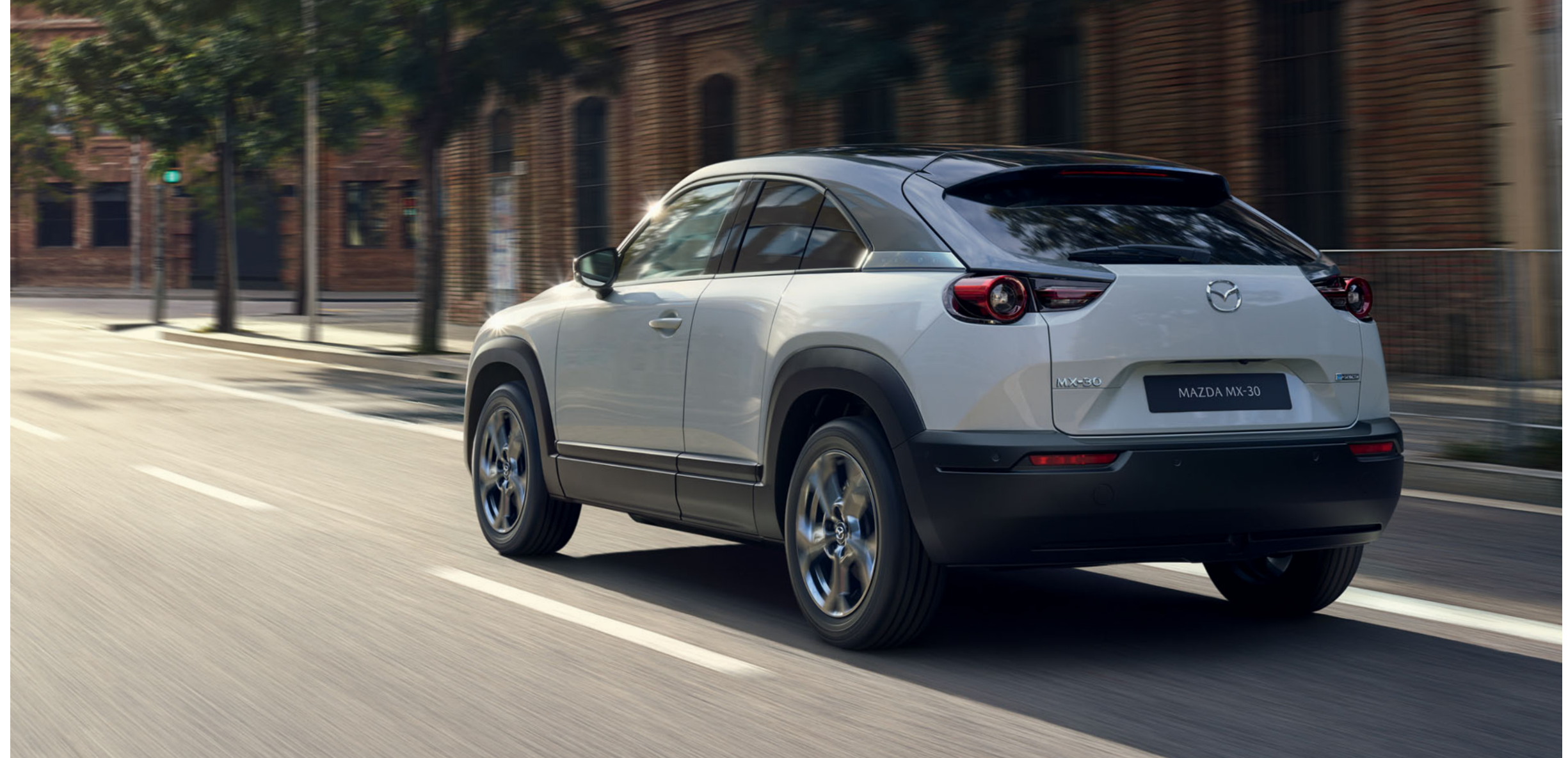
Mazda MX-30 Revolution in Ceramic 3-Ton

Von Anfang an bauten wir Fahrzeuge, die sich von der Masse abheben. Wo alle anderen es für unmöglich hielten, produzierten wir den allerersten Sportwagen mit Wankelmotor und gewannen das härteste Ausdauerrennen der Welt: das 24-Stunden-Rennen von Le Mans. Noch heute treibt uns diese Leidenschaft und Begeisterung an. Unser Challenger Spirit inspirierte uns auch zur Entwicklung unseres ersten rein elektrischen Fahrzeugs, das mehr ist, als einfach nur ein Elektroauto. Wie jeder Mazda fährt er sich natürlich und intuitiv, weil jedes unserer Autos auf Sie, Ihren Lebensstil und den reinen Fahrspass ausgelegt ist.