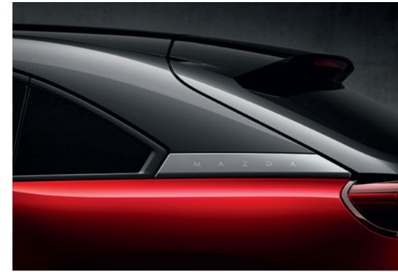
Soul Red Crystal 3-Ton

Scannen Sie diesen Code mit Ihrem Mobilgerät und konfigurieren Sie Ihren brandneuen Mazda MX-30.