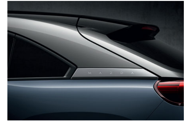
Polymetal Gray 3-Ton