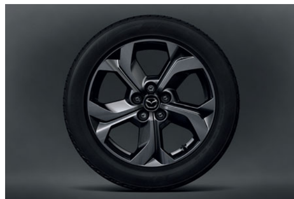
18"-Leichtmetallfelgen, Farbe Bright Silver