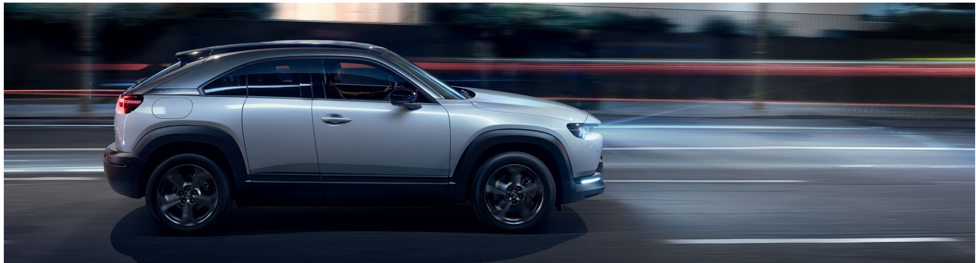
Mazda MX-30 Revolution in Ceramic 3-Ton