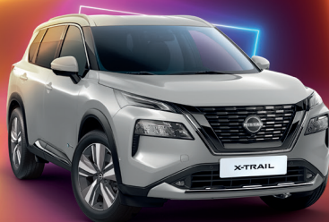
X-Trail e-POWER mit e-4ORCE Jede Herausforderung ein Vergnügen.