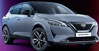
Qashqai e-POWER Elektrisch fahren – ohne laden.