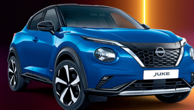
Juke Hybrid Sparsam und stylish zugleich.