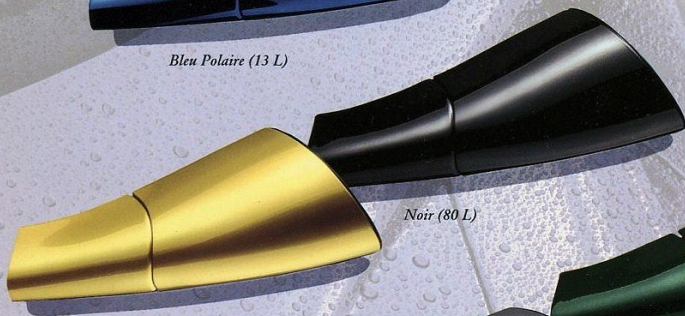
Jaune Curry (Peinture spéciale)