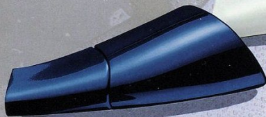
Bleu Polaire (13 L)

A présentation sportive, couleurs actives. Choisissez entre six coloris de grande qualité pour donner à la Vectra i500 la caractéristique qui va avec votre personne. Une grande qualité que l'on retrouve aussi dans l'aménagement intérieur. Les sièges ont un capitonnage de tissu au design sportif «Metropolis». Contre supplément, une sellerie cuir vous permettra de rendre encore plus exclusive votre berline dynamique à hautes performances. Ainsi, à chaque fois que vous prendrez le volant de votre Vectra i500, vous serez gagnant sur toute la ligne.