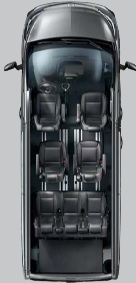
Configuration famille (7 places)