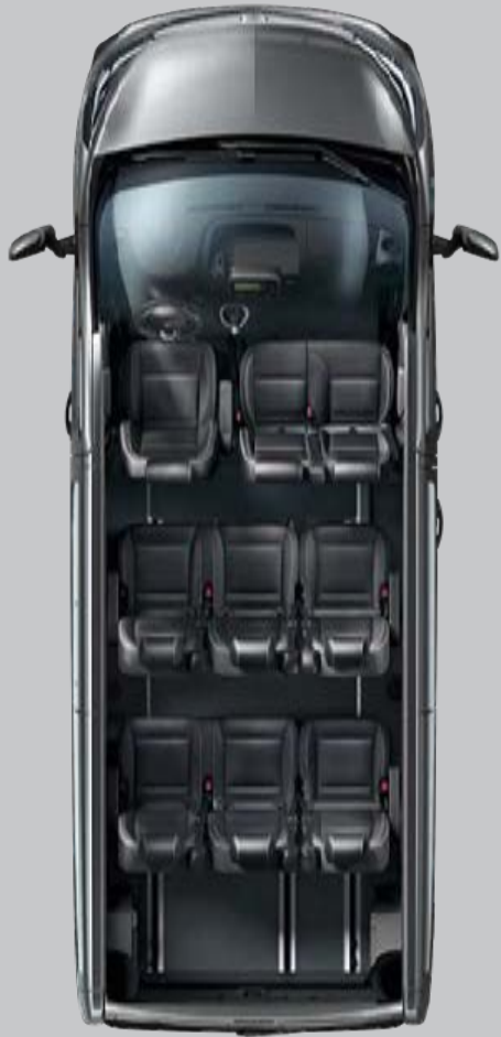
Configuration navette (9 places)