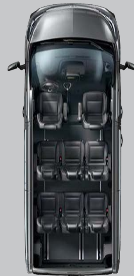
Configuration navette (8 places)