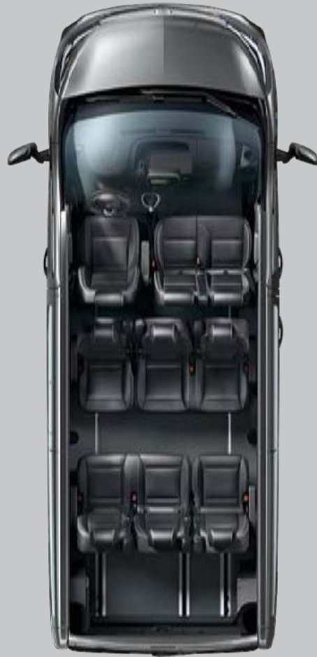
Configuration business (9 places)