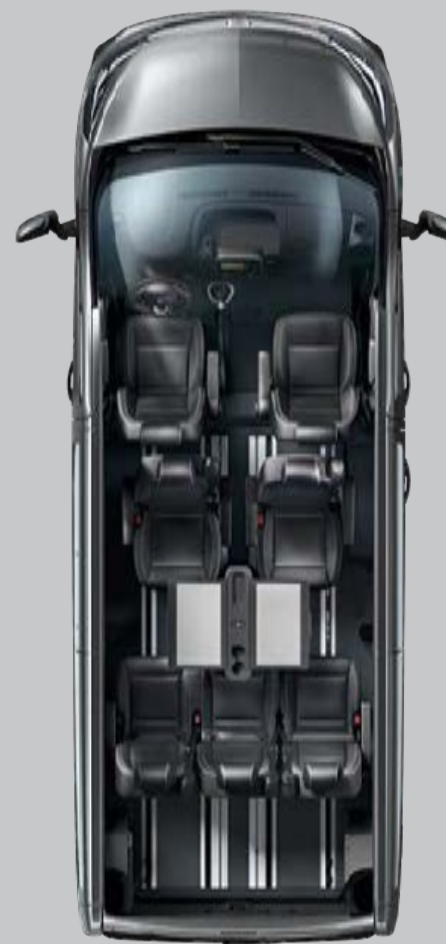
Configuration business (7 places et table)

Les illustrations ci-contre ne sont qu'un aperçu des agencements possibles. Pour de plus amples informations, veuillez vous adresser à votre partenaire Opel.