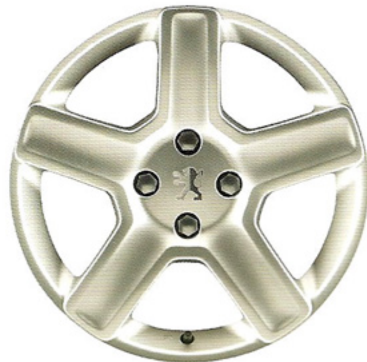
□ - Jantes Challenger 17"

Attention! Cette voiture risque de vous piquer violemment les sens, de réveiller des sensations assoupies et de faire monter votre température de quelques degrés.