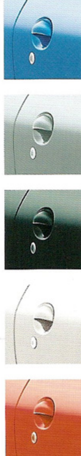
□ - 5 teintes de caisse : - Bleu Récife - Gris Aluminium - Noir Obsidien - Blanc Banquise - Rouge Aden