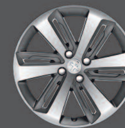
Jantes aluminium 18" ICAUNA