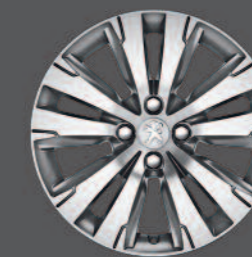
Jantes aluminium 17" AREGIA