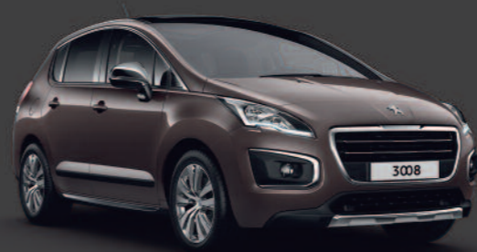
Brun Rich Oak