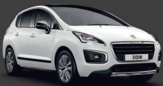
TEINTE NACRÉE (en option) Blanc Nacré