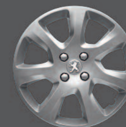
Enjoliveurs 17" ATAX