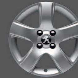
Jantes aluminium 16" ISARA* *Associée exclusivement à l'option Grip Control®