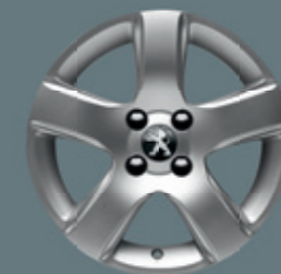
Jantes aluminium 16" ISARA