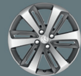
Jantes aluminium 18" ICAUNA (option)