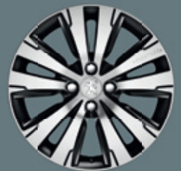
Jantes aluminium 17" SCALDIS*