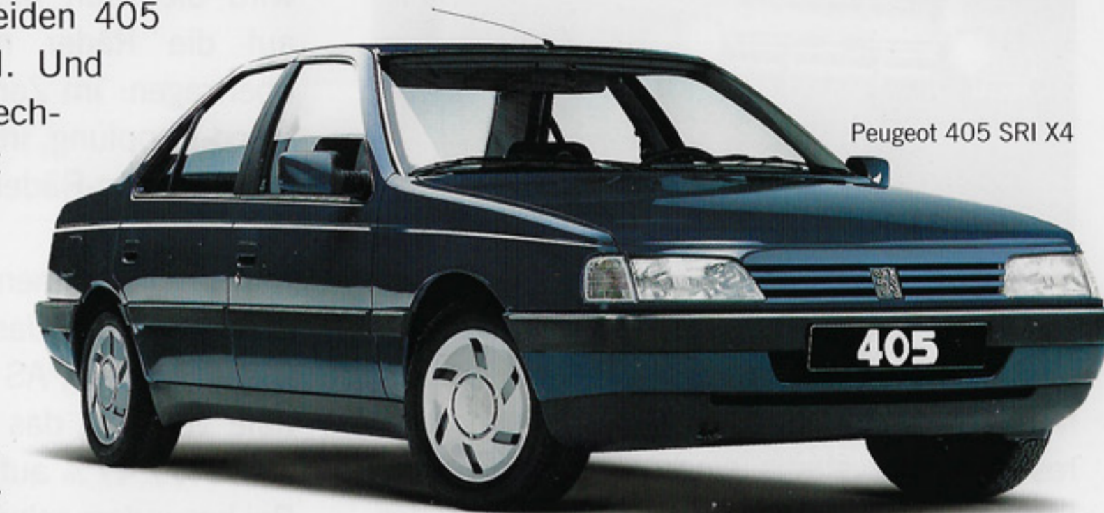
Peugeot 405 SRI X4

bleres Fahrverhalten. Besonders raffiniert ist die elektrohydraulische Hinterradaufhängung der 405 X4 Modelle. Unabhängig von der Last hält sie die Bodenfreiheit automatisch