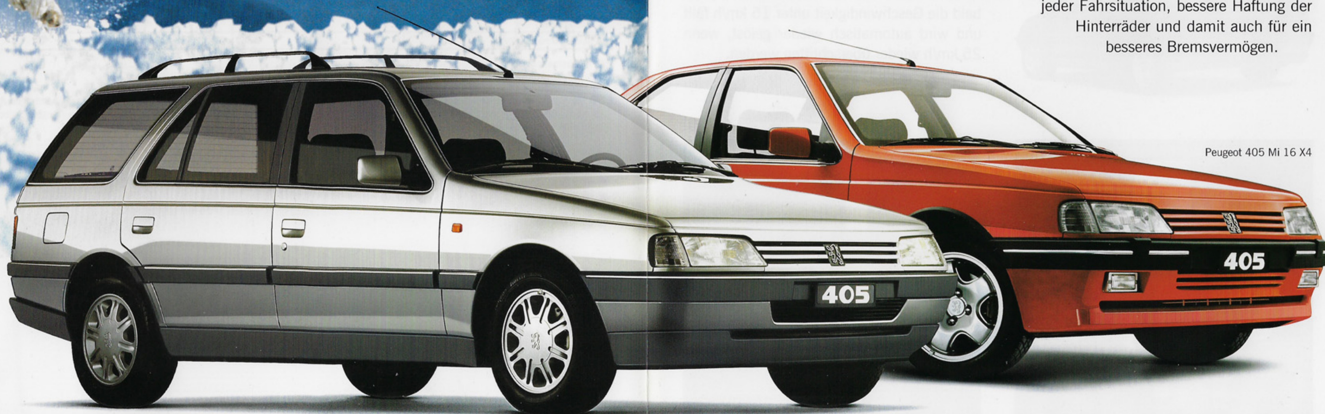
Peugeot 405 Mi 16 X4

konstant – für hohen Fahrkomfort auch bei vollbeladenem Fahrzeug, gute Traktion in jeder Fahrsituation, bessere Haftung der Hinterräder und damit auch für ein besseres Bremsvermögen.