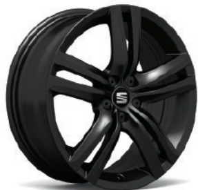
17" CERCHIO IN LEGA «BARCINO BLACK» CU