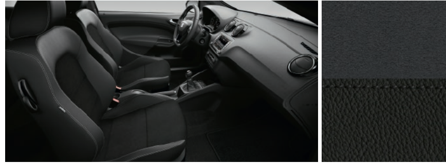
ALCANTARA BLACK CU