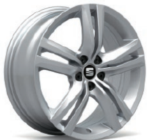
17" CERCHIO IN LEGA «BARCINO» CU