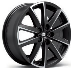
17" CERCHIO IN LEGA SPORTLINE «DIAMANT BLACK MATT» CU