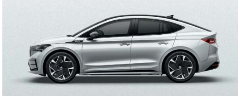
MOON WEISS, METALLIC