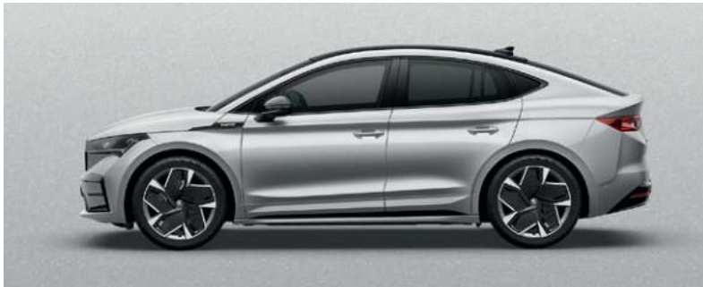
BRILLIANT SILBER, METALLIC