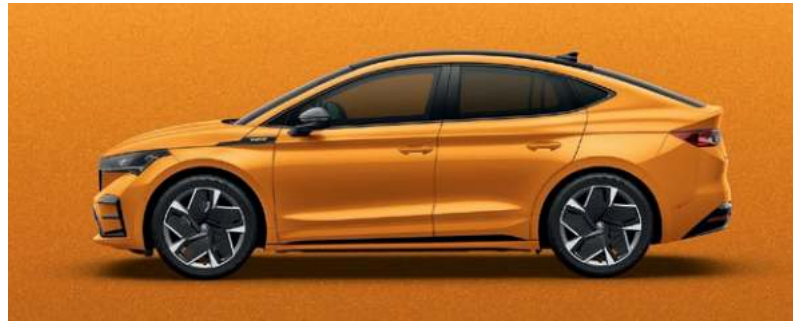
PHOENIX ORANGE, METALLIC