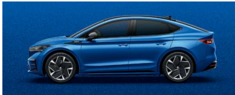
RACE BLAU, METALLIC