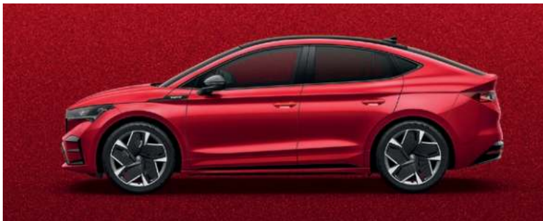
VELVET ROT, METALLIC