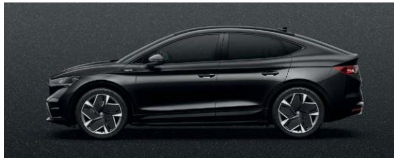
MAGIC SCHWARZ, METALLIC

Zur Farbpalette gehört auch Energy Blau, uni (ohne Bild).