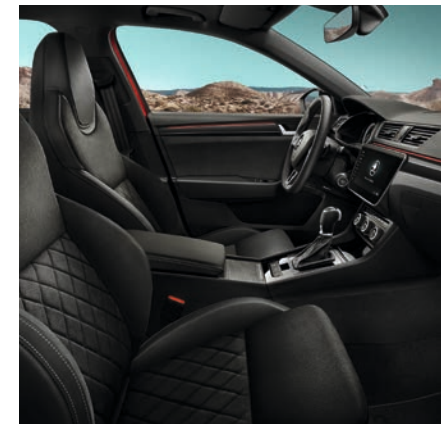
Les SIÈGES sport disposent d'un revêtement en Alcantara/en cuir et de coutures couleur argent.