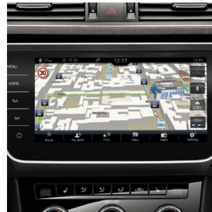
Le SYSTÈME DE NAVIGATION DYNAMIQUE «COLUMBUS» avec cartes routières pour l'Europe est aisément réglable via l'écran tactile en couleur de 9.2".