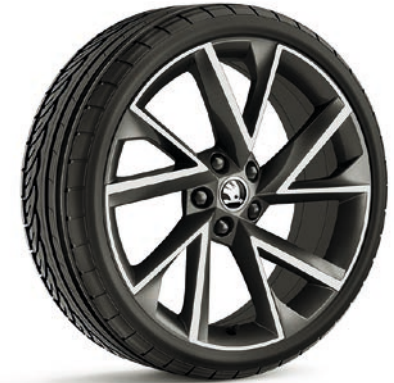
Le ŠKODA SUPERB SportLine Plus est équipé de JANTES EN ALLIAGE LÉGER 19" «VEGA» anthracite.