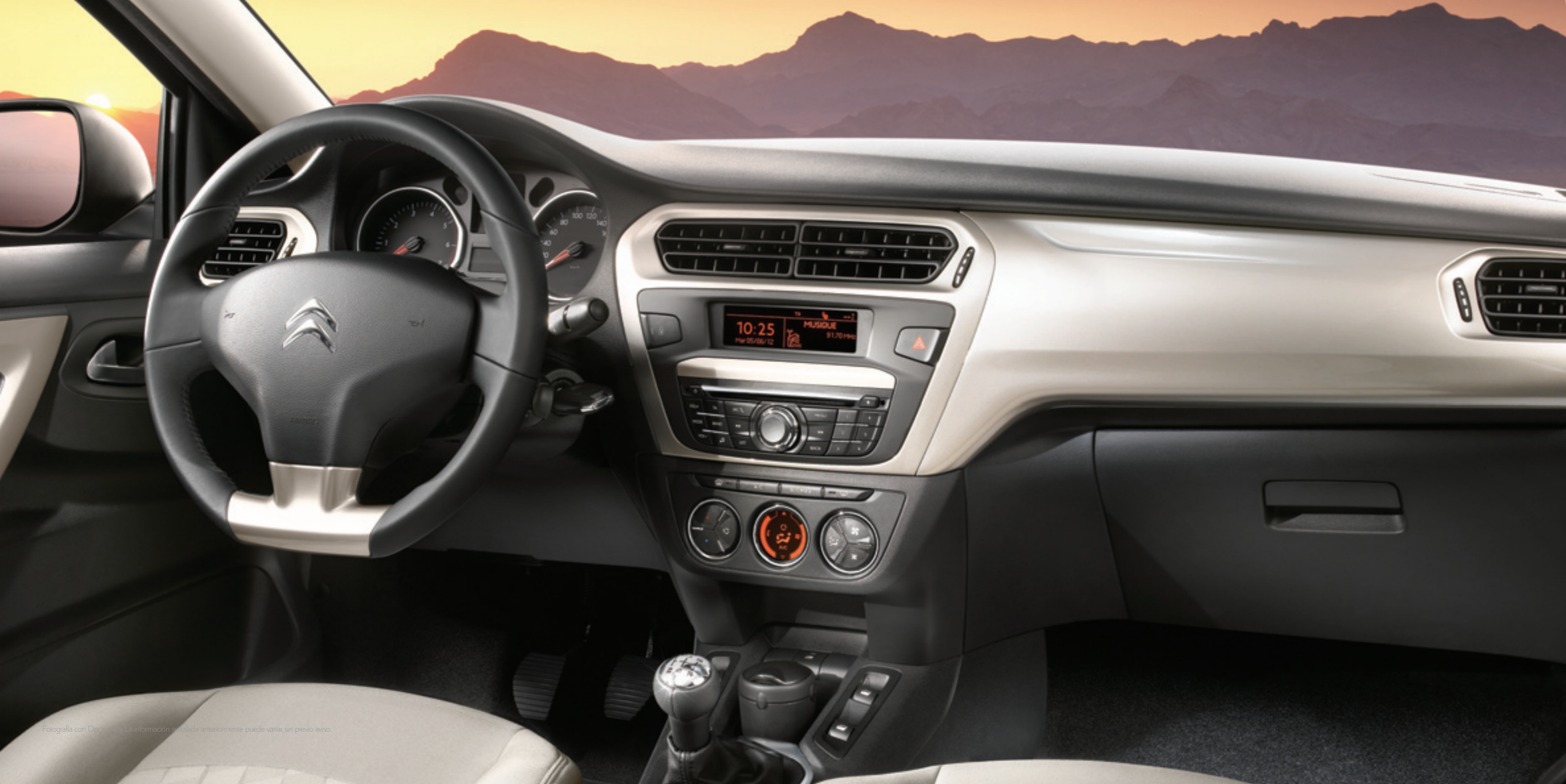
Fotografía con Opcionales. La información señalada anteriormente puede variar sin previo aviso.