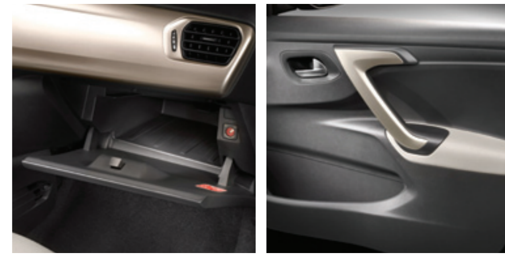
Fotografía con Opcionales. La información señalada anteriormente puede variar sin previo aviso.