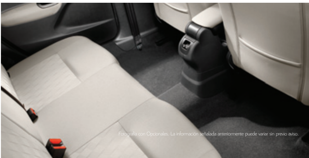
Fotografía con Opcionales. La información señalada anteriormente puede variar sin previo aviso.