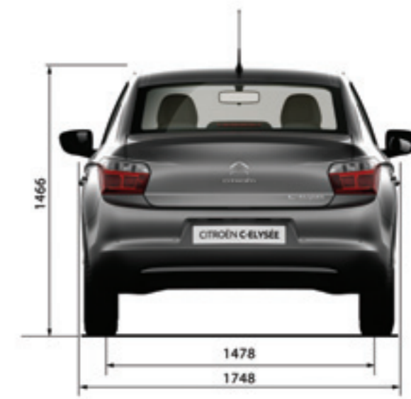
CITROËN C-ÉLYSÉE DIMENSIONES (mm)