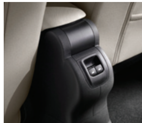
Fotografía con Opcionales. La información señalada anteriormente puede variar sin previo aviso.