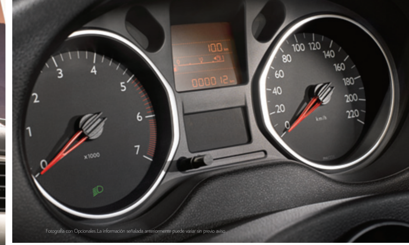
Fotografía con Opcionales. La información señalada anteriormente puede variar sin previo aviso.