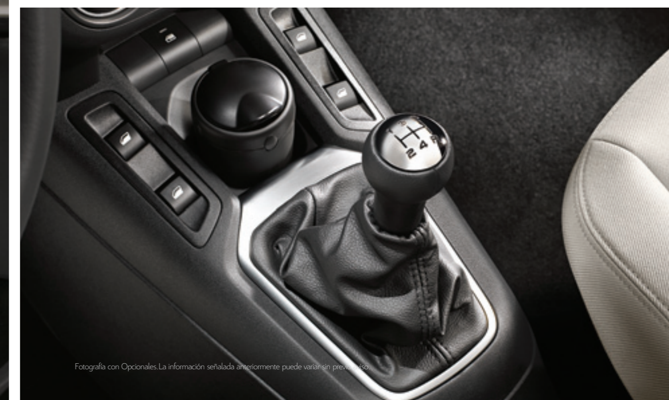
Fotografía con Opcionales. La información señalada anteriormente puede variar sin previo aviso.