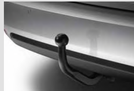
KIT ENGANCHE REMOLQUE DESMONTABLE SIN HERRAMIENTA 1613362180 - 1611864380 (cablería 13 vías)