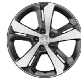
Llanta de aluminio de 17" RUBIS diamantada