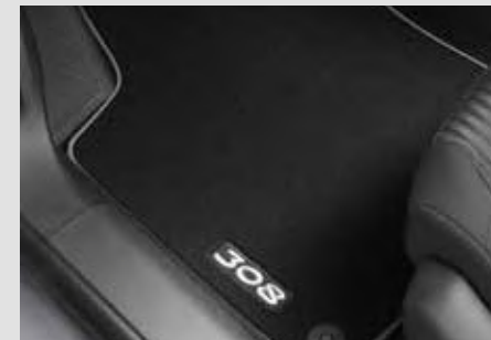
PISO DE ALFOMBRA 1609851780