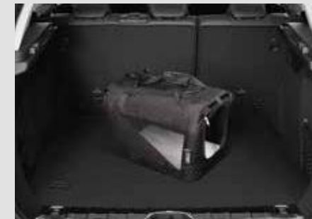
JAULA PARA TRANSPORTE DE MASCOTAS 1607076180