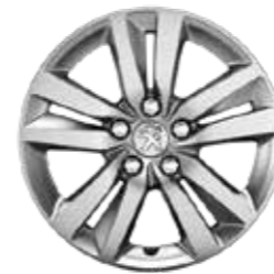
Llanta de aluminio de 16" QUARTZ

Para perfeccionar tu modelo, puedes elegir entre una amplia gama de embellecedores y llantas muy elegantes.