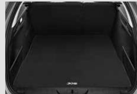
ALFOMBRA MALETERO REVERSIBLE 1609733980