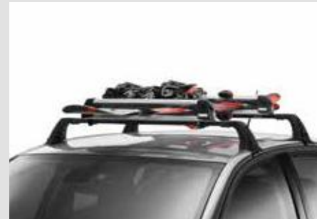
PORTA SKI 1629426080 (para 4 pares) 1629426280 (para 6 pares)