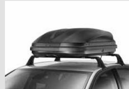
COFRE DE TECHO DE LONGITUD INTERMEDIA 1609665780 (420L) - 1609665680 (330L)