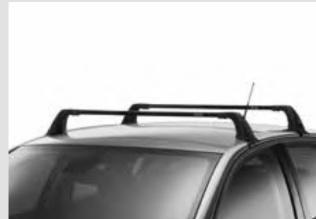
JUEGO BARRAS DE TECHO 1613509880