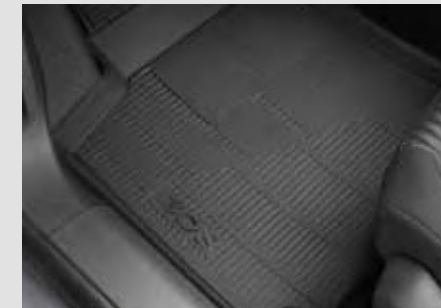
PISO DE CAUCHO 1609853080