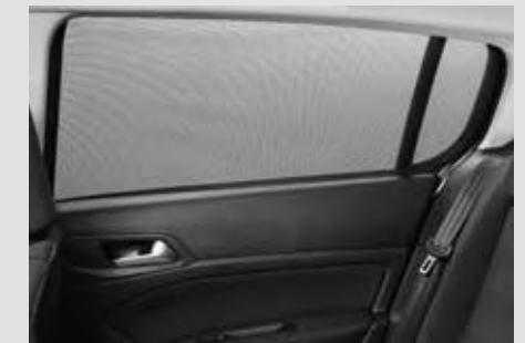
JUEGO DE CORTINILLAS PARASOL 1610040980