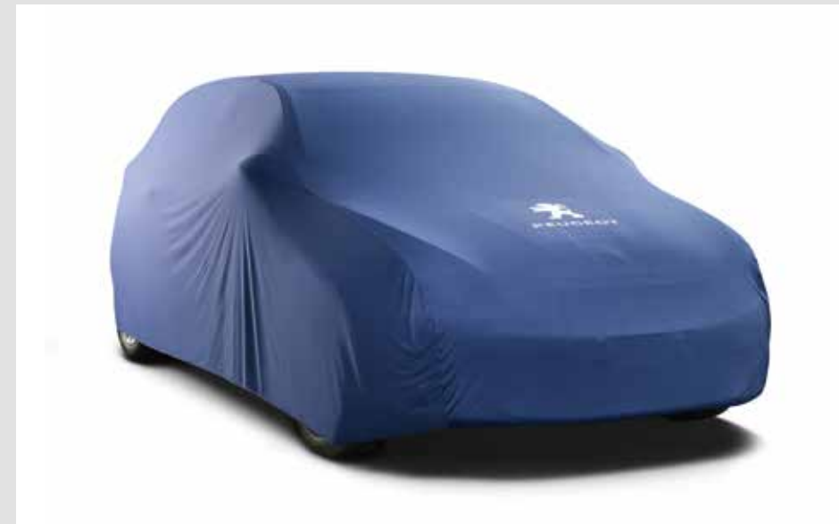
FUNDA DE PROTECCIÓN 00009623E7