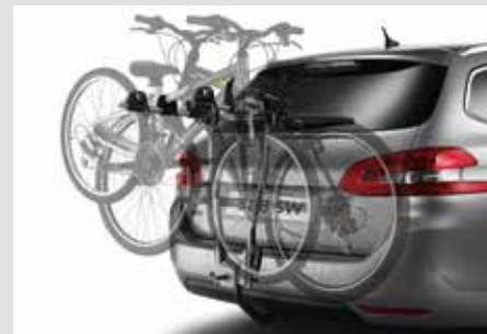
PORTA BICICLETAS 0000961509 (para 3 bicicletas) 0000961508 (para 2 bicicletas)