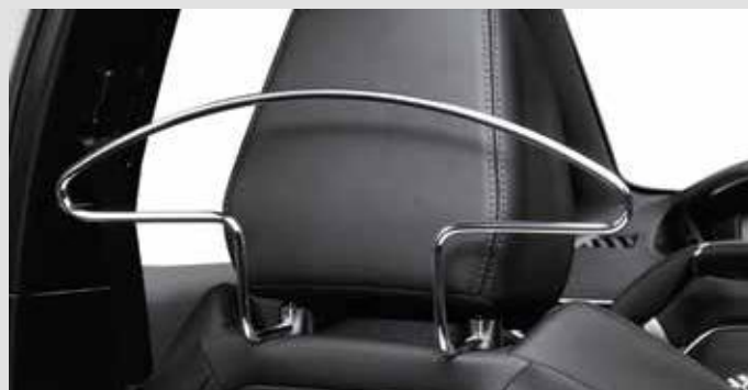
PERCHA REPOSACABEZAS 1607937780