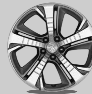
Llantas 18" RUBIS Diamantadas (bi-color)