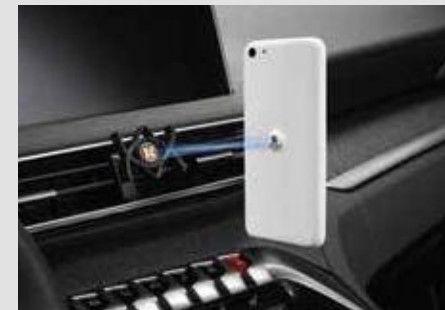
SOPORTE SMARTPHONE 1613579180