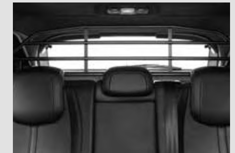
REJILLA PROTECCIÓN PARA MASCOTAS (UNIVERSAL) 1613700380