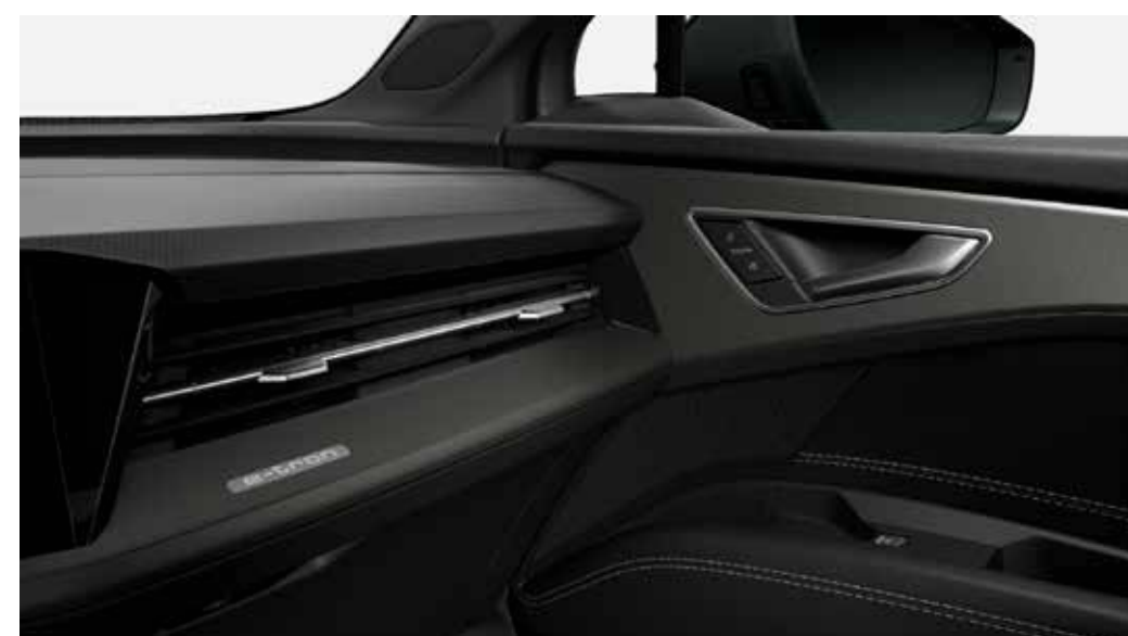
箭羽浮雕哑光 铝饰板