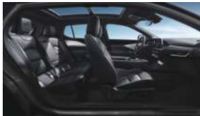
暗夜骑士 星际黑高级环保皮革座椅 高级拉丝真铝饰板