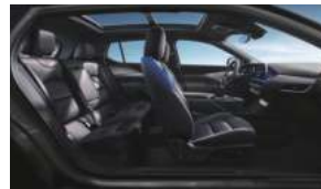
星际迷航(曜石熏黑运动套件) 极地蓝高级环保皮革座椅 高级拉丝真铝饰板