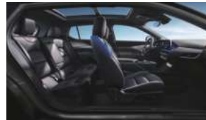
星际迷航(曜石熏黑运动套件) 极地蓝高级环保皮革座椅 高级拉丝真铝饰板