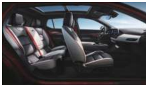
加州落日 琴键红高级环保皮革座椅 高级运动碳纤维饰板

声明:本产品资料尽可能在现有资料基础上做到全面详实,考虑到上汽通用汽车有限公司可能随时对产品参数、配置、材料、色彩等车型信息进行修改和调整,因此本产品资料仅作参考使用,具体车型的外观、配置及颜色等信息以销售的实车为准。上汽通用汽车有限公司有权合法使用凯迪拉克(Cadillac)产品商标名称,未经许可使用上述商标者,将被追究法律责任。