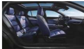
夜色西海岸 克莱因蓝高级环保皮革座椅 高级拉丝真铝饰板