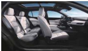
银河星云 深空银高级环保皮革座椅 高级拉丝真铝饰板