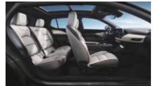
午后比弗利(曜石熏黑运动套件) 雅米高级环保皮革座椅 高级拉丝真铝饰板