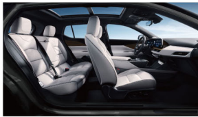
银河星云 深空银高级皮织座椅 高级艺术纹饰板