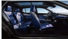
夜色西海岸 克莱因蓝高级环保皮革座椅 高级拉丝真铝饰板