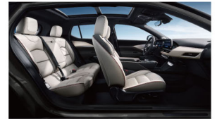
午后比弗利(曜石熏黑运动套件) 雅米高级环保皮革座椅 高级拉丝真铝饰板