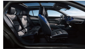
星际迷航(曜石熏黑运动套件) 极地蓝高级环保皮革座椅 高级拉丝真铝饰板