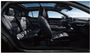
暗夜骑士 星际黑高级皮织座椅 高级艺术纹饰板