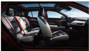
加州落日 琴键红高级环保皮革座椅 高级运动碳纤维饰板

声明:本产品资料尽可能在现有资料基础上做到全面详实,考虑到上汽通用汽车有限公司可能随时对产品参数、配置、材料、色彩等车型信息进行修改和调整,因此本产品资料仅作参考使用,具体车型的外观、配置及颜色等信息以销售的实车为准。上汽通用汽车有限公司有权合法使用凯迪拉克(Cadillac®)产品商标名称,未经许可使用上述商标者,将被追究法律责任。