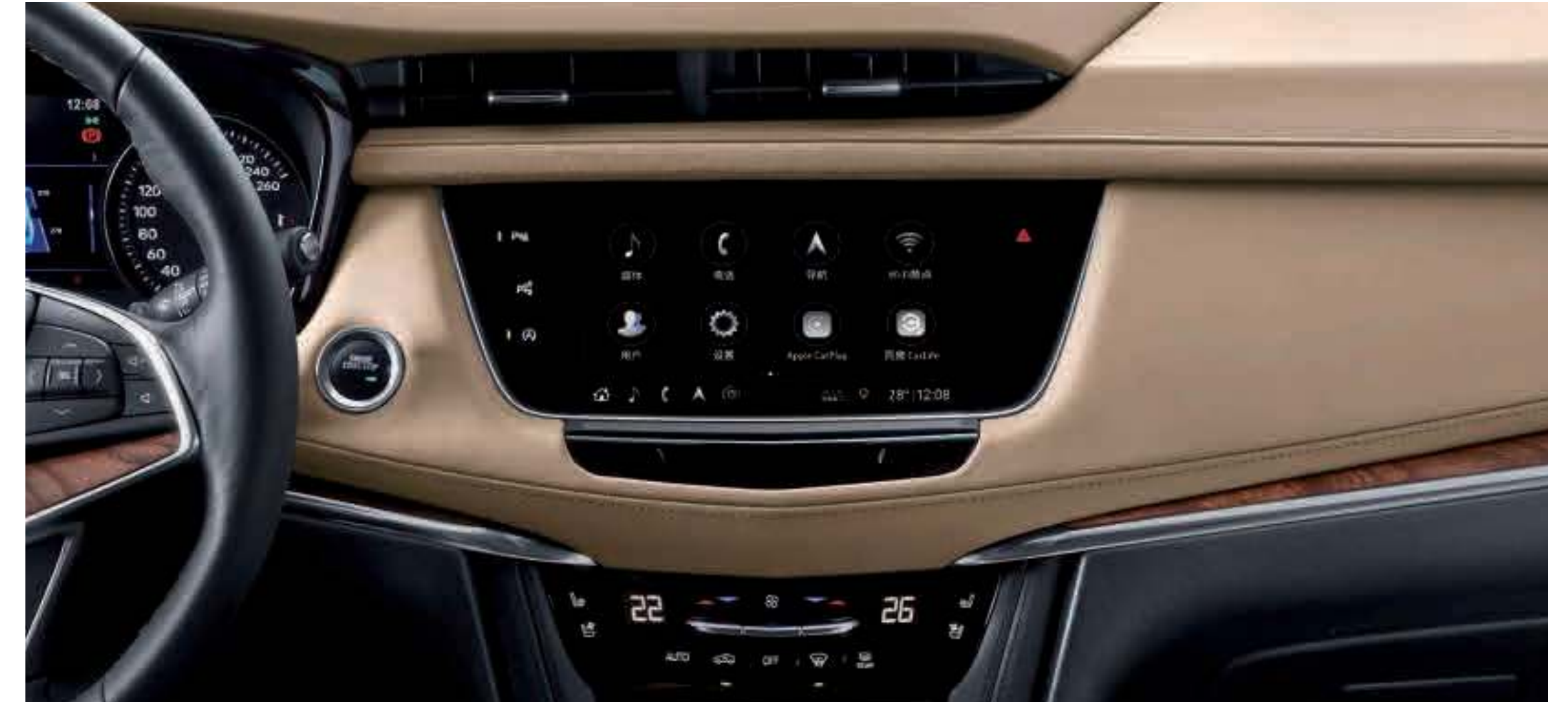
颠覆想象 八种直觉操作触屏手势

全新一代凯迪拉克移动互联体验CUE，新增百度智能语音交互系统，实现多场景无障碍智能语音操作：高识别度、多轮对话，带来流畅的人机交互体验。你可在车内坐享丰富的百度随心听，百科、天气、航班、违章查询，更可远程控制智能家居设备，为新摩登家庭开启车载AI体验的全新旅程。OTA智能云更新功能随时随地升级系统，更有终身制每年100G免费车载流量*，掌握实时资讯。原装无线苹果CarPlay可以将你的iPhone通过蓝牙系统轻松连接到车载大屏幕上，通过Siri语音操控系统或手指触控，在车载屏幕上实现电话、导航、音乐等你钟爱的体验。车载4G无线网络为全车提供高速便利的4G Wi-Fi热点，令你在行驶的同时，享受高速流畅的互联体验。OnStar安吉星服务搭载4G LTE Wi-Fi功能，一键智能启动，专业顾问团队24小时实时在线，一对一主动式关爱，集成碰撞自动求助、紧急救援协助、车况检测、导航、安全保障及手机App应用等专属服务，开启人车互联新时代。 5种HMI交互设计，在人车互动体验上突破以往的单一模式，让你在对驾驶系统下达命令时有了更多灵活的方式选择，在细节之中体会科技智慧带来的操控趣味和安全守护。